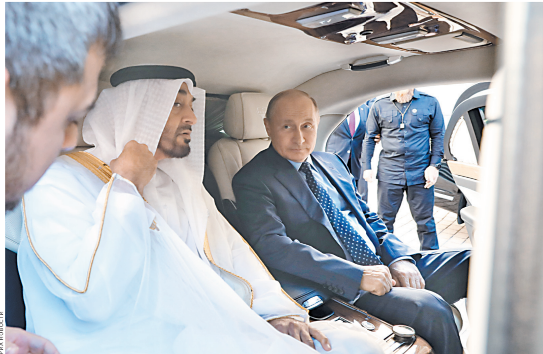
Владимир Путин продемонстрировал гостю свой новый лимузин серии «Кортеж».

ОАЭ стремится к сотрудничеству со всем миром, чтобы обес-