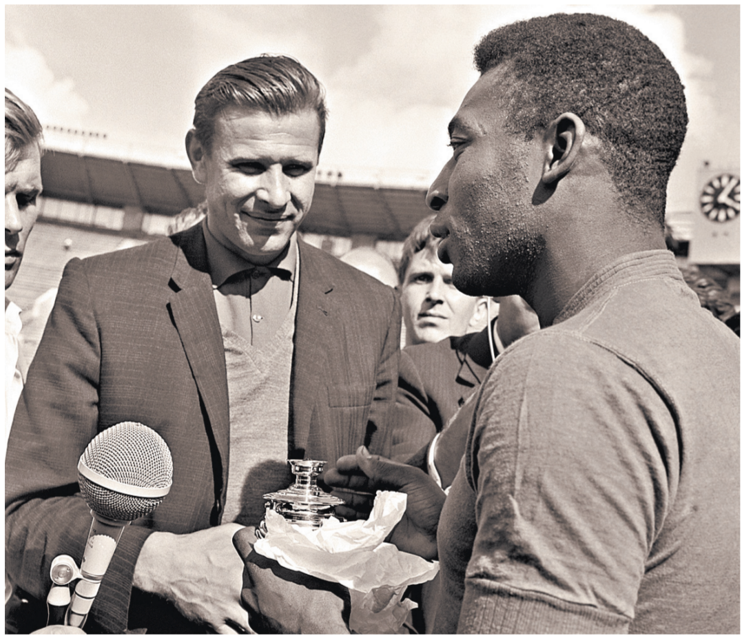
Яшин и Пеле. 1965 год.

Полный текст интервью читайте в июньском номере журнала «Родина».