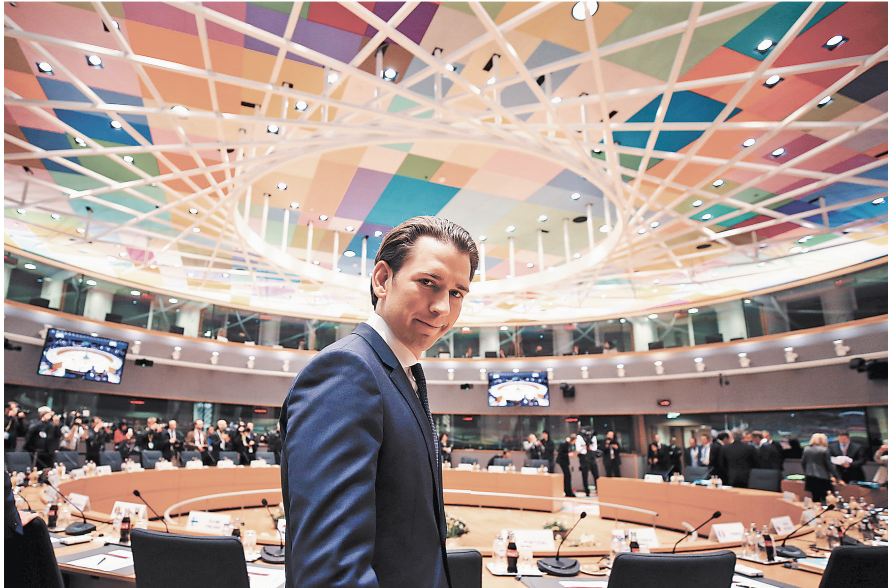
Себастьяну Курцу 31 год, и он — самый молодой глава правительства в Европе.

Какую роль сегодня играет двустороннее сотрудничество в области энергетики и в каких сферах, как вам кажется, отношения между нашими странами наиболее перспективны? Себастьян Курц: Я бы отметил плодотворное сотрудничество двух важнейших предприятий — австрийского ОМУ и российского «Газпрома», которое представляется мне исключительно выгодным для обеих сторон. Энерго-