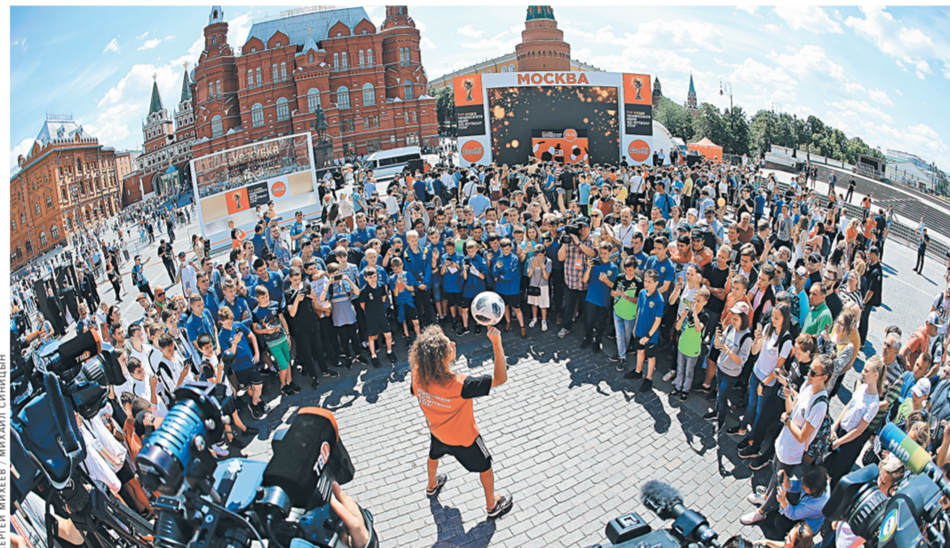
Атмосфера футбольного праздника чувствуется в столице уже сейчас.