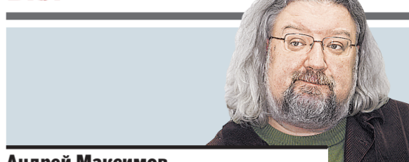
Андрей Максимов писатель, телеведущий