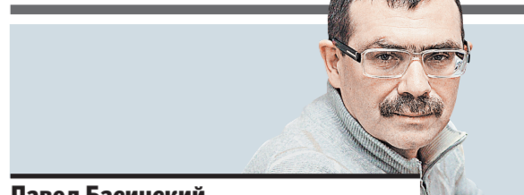
Павел Басинский писатель