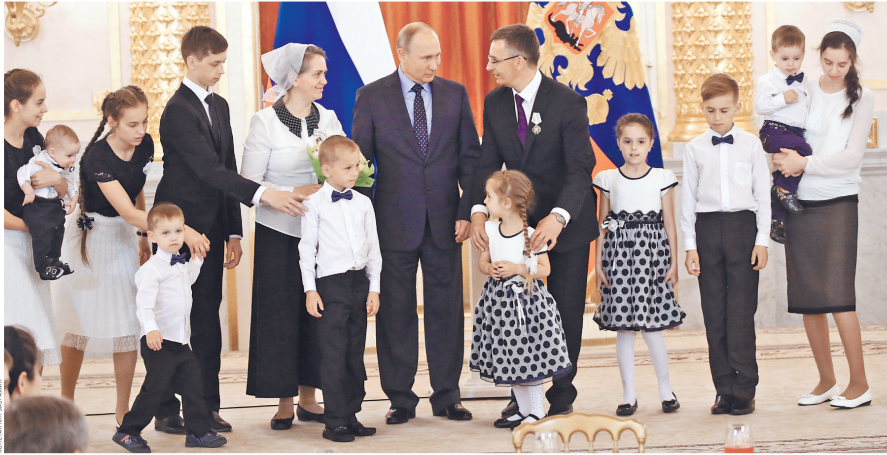
На церемонии награждения многодетные семьи стараются приехать в полном составе.