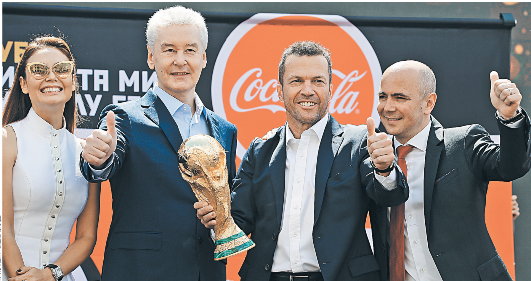
Мэр Москвы Сергей Собянин (второй слева) и легендарный немецкий футболист Лотар Маттеус (третий слева) встретили в российской столице Кубок мира.