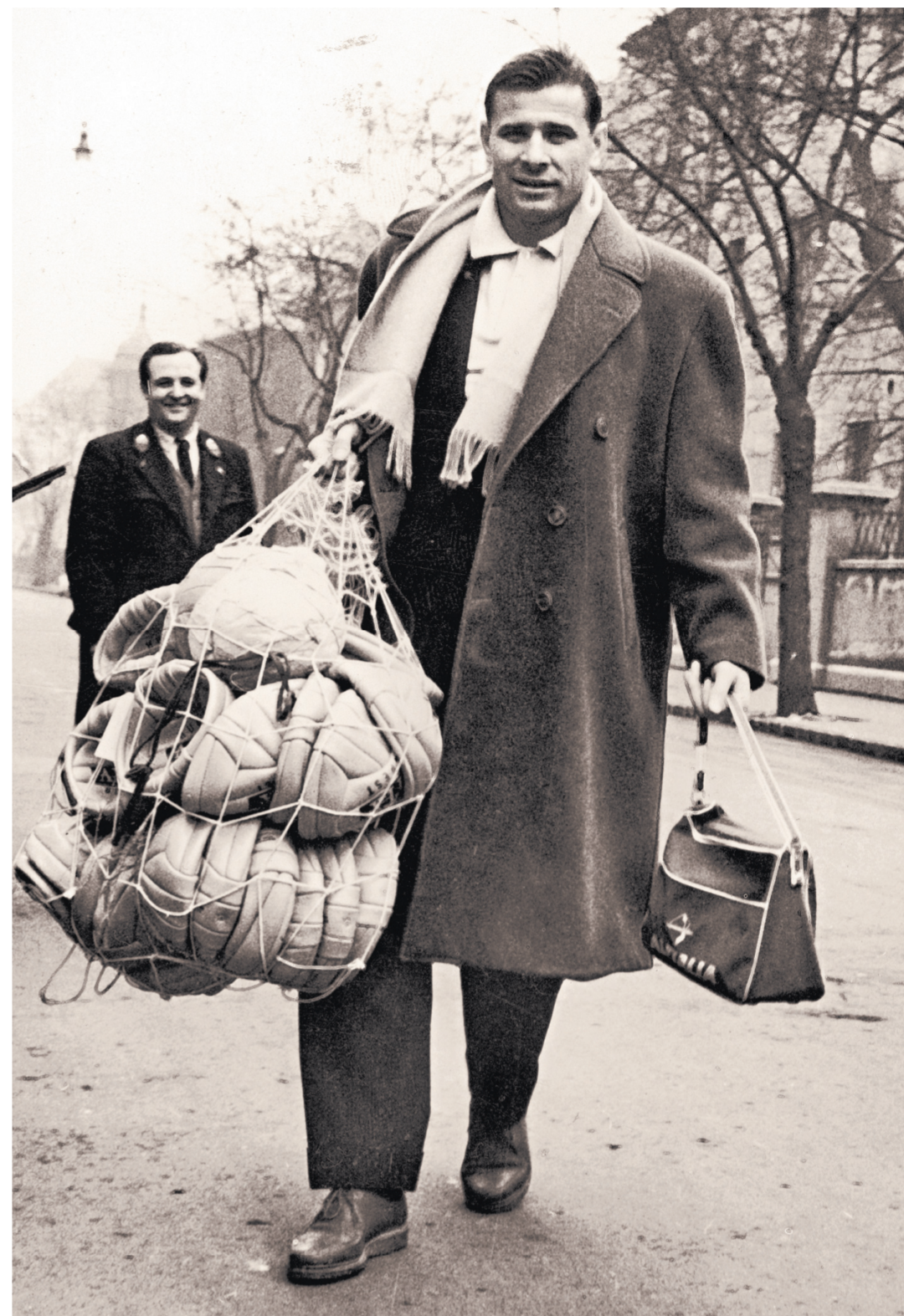
9 марта 1962 год. Голкипер Лев Яшин прибыл в Будапешт для тренировок перед чемпионатом мира в Чили.

Нам предложили эту квартиру, но мы не сразу решили на переезд. Она показалась слишком большой: три комнаты, сто одиннадцать квадратных метров... Зачем нам столько? Так и ходили с просмотром ордером, не могли определиться. Были молодые, неопытные... Более полвека живу тут.