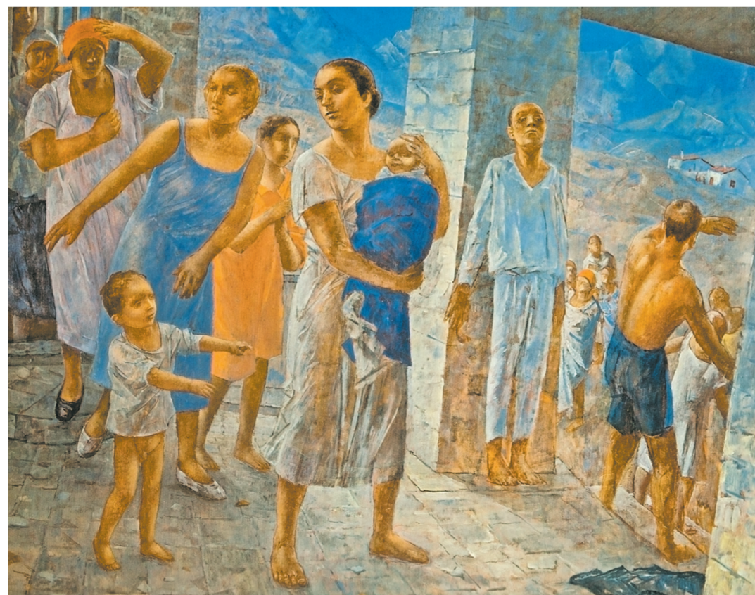
ПЕТРОВ-ВОДКИН. КАРТИНА «ЗЕМЛЕТРЯСЕНИЕ В КРЫМУ»

Удивительно, как, оставаясь в 20–30-е годы «очень советским» художником, Петров-Водкин умудрялся сохранять глубокую религиозность, сохранять и донести ее до зрителя. Ведь все его лучшие картины, даже самые революционные, такие как «Смерть комиссара» или «После боя», — это, по сути, парафразы библейских сюжетов. Да и могло ли быть иначе у художника, который начал свой путь в искусстве как ученик иконописца? Неудивительно, что творчество Петрова-Водкина не раз вызывало ожесточенную критику как справа, так и слева. Например, из-за полотна «Сон» случались в свое время Алек-