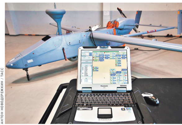
Беспилотный разведывательный комплекс «Форпост» включает три таких самолета и наземную станцию управления.

Помимо беспилотников, Борисов также интересовался многоцелевым самолетом Л-410. Минобороны заказало на Уральском авиазаводе 18 таких машин. Они нужны для оперативной переброски сил специальных операций в сложных метеословиях, в том числе для посадки на воду и снег. Кроме того, сейчас разрабатывается шасси для приземления Л-410 на мягкий грунт и неподготовленную площадку. В ближайшие два года военные также получат 32 учебно-тренировочные «эльзы» — с их помощью будут готовить будущих пилотов военно-транспортной авиации. Три таких самолета, по словам Борисова, уже переданы ВКС. Еще 17 машин курсанты увидят в будущем году и полтора десятка — в 2019-м. В планах Минобороны использовать эту машину и как платформу по другим направлениям, в том числе в качестве патрульного самолета.