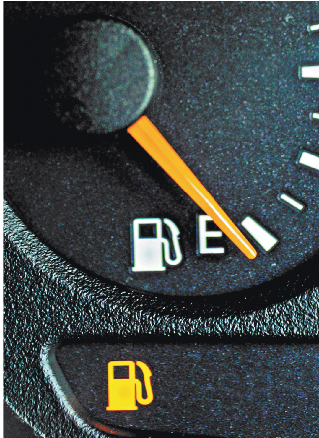
Обвал оптовых цен под конец года — нормальное явление: в 2014–2015 годах они опускались ниже уровня января.

Заявок из субъектов Федерации поступает много, и, по словам