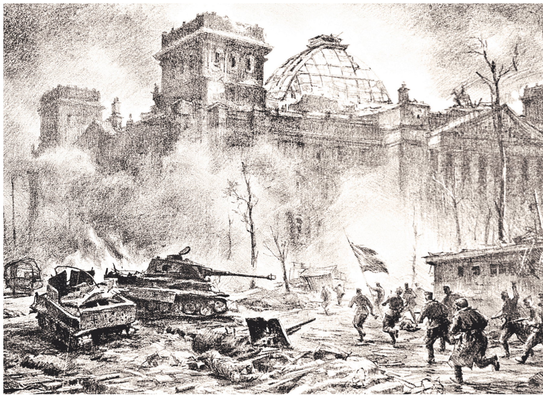
РЕПРОДУКЦИЯ ИЛЛЮСТРАЦИИ КОРАЛКИНЫ ТРИ КОВСКИ

1 У экспертов есть несколько предложений. Например, можно давать материал до 1945 года в 10-м классе, а в 11-м — продолжить изучение с 1945 года до наших дней. Или преподавать историю в 11 классе по модульному принципу. Например, может быть модуль для будущих спортсменов, которые историю страны будут изучать через историю спорта. Или модуль для будущих гуманитариев, технарей.