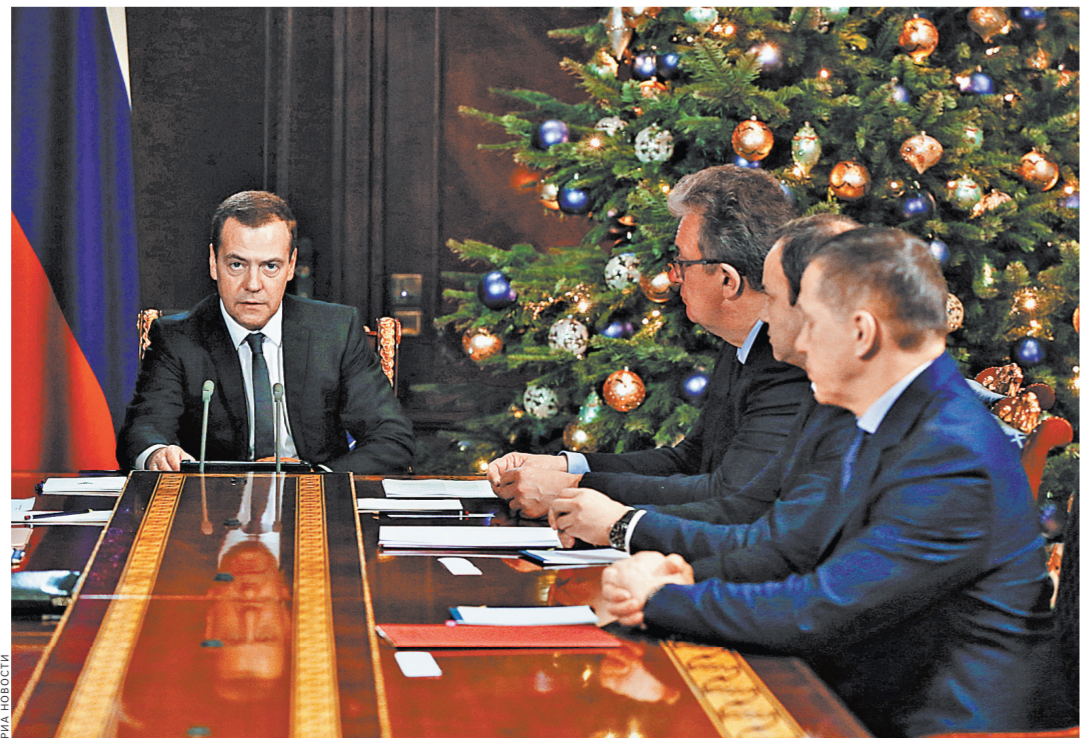
Статус ТОРа отзывают, если власти будут плохо использовать открывающиеся возможности, предупредил премьер.