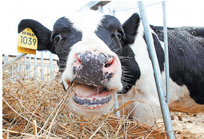
Не всякое молоко дает корова. Некоторая продукция имеет исключительно растительное происхождение.

В Орловской и Курской областях четверть проверенной в 2017 году молочной продукции оказалась фальсификатом. Такими результатами проверки территориального управления Россельхознадзора продавцов и производителей животноводческой продукции.