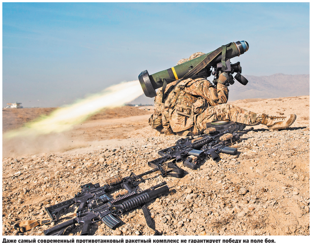
Даже самый современный противотанковый ракетный комплекс не гарантирует победу на поле боя.

Сейчас в Интернете принимают шуточные ставки на то, в какой именно третьей стране скоро появятся украинские «Джавелины», полученные из Америки. Учитывая коррупцию киевских властей, такой вариант вполне возможен.