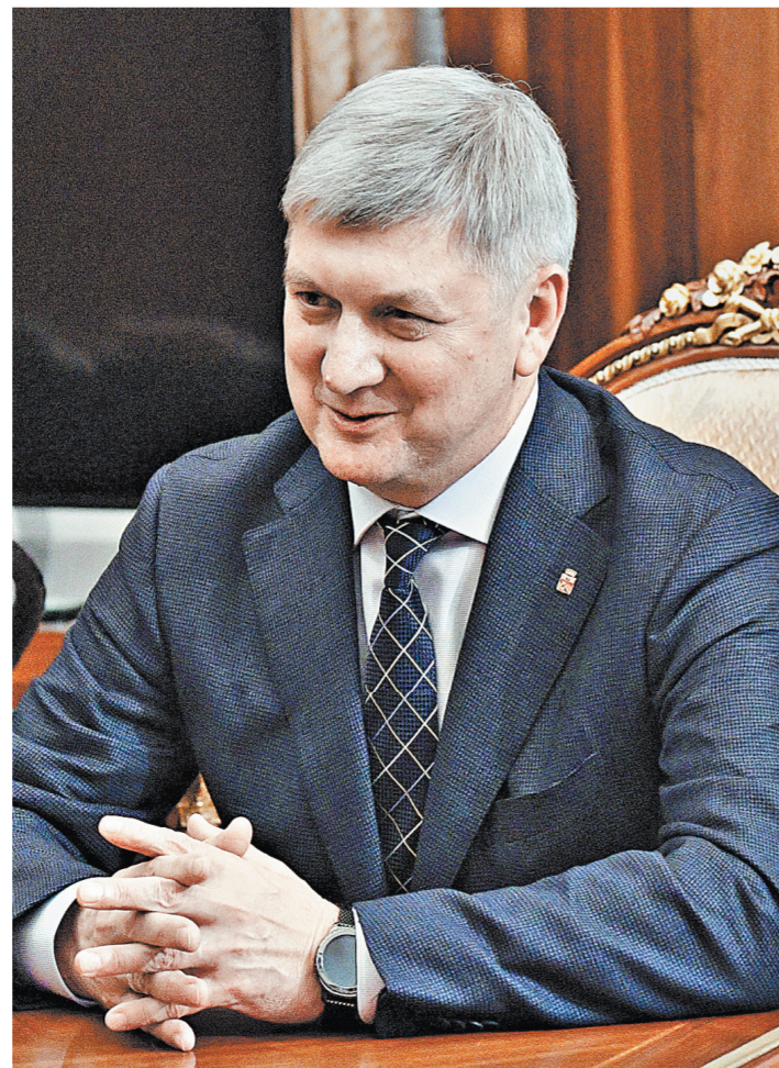
Александр Гусев на посту врио губернатора Воронежской области намерен продолжить курс своего предшественника.

Что касается должности губернатора Воронежской области, то временно исполняющим обязанности главы региона назначен мэр Воронежа Александр Гусев. Вероятно, врио он будет до ближайших региональных выборов, которые пройдут осенью 2018 года. Гусев возглавлял