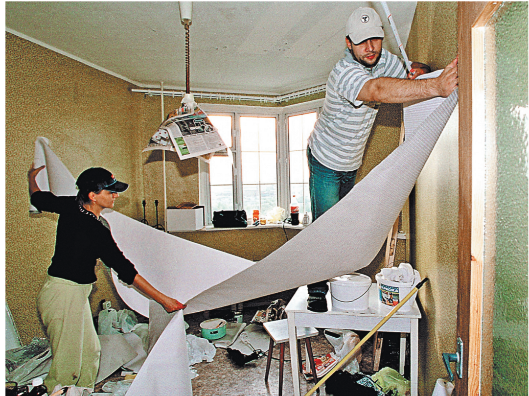
По мнению Верховного суда, отвечать за перепланировку должен только тот, кто ее делал.