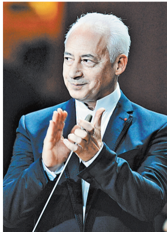
Скрипач и дирижер Владимир Спиваков — бессменный руководитель Дома музыки.

Среди тех, кто пришел на торжество Дома музыки, было множество узнаваемых артистов и политиков. Вечер, как и положено в подобных случаях, начался с поздравительных речей. «Мне повезло участвовать в церемонии закладки камня в строительство самого известного центра музыки. Несколько лопат бетона в фундамент этого здания — это правда, мои трудовые! Поскольку бетон был качественным, я гарантирую: с фундаментом все будет в порядке», — поделилась воспоминаниями председатель Совета Федерации Федерального Собрания РФ Валентина Матвиенко.