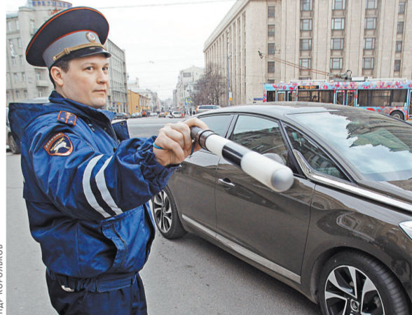
Автоинспекторы вправе на время забрать автомобиль у любого водителя, но на практике почти не пользуются этим.

Напомним, что по судебной статистике за первые шесть месяцев текущего года по статье о неповиновении были наказаны 43 тысячи россиян. 17,5 тысячи из них были отправлены под административный арест.