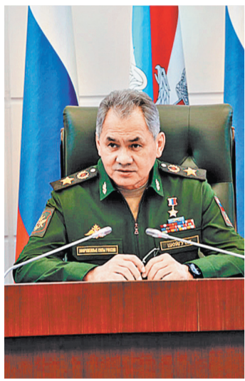
Сергей Шойгу пригласил общественников в Краснодар на первые полеты 16 девушек-курсанток.

Кроме того, сейчас завершается строительство полноценного аэродрома на архипелаге Земля Франца-Иосифа, который будет способен круглогодично принимать самолеты. «За всю историю освоения Арктики еще ни одна страна мира в условиях Крайнего Севера не реализовывала такие масштабные проекты», — заявил на коллегии Шойгу.