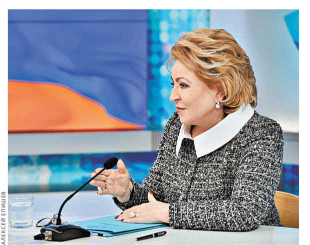
Итоги года удовлетворительные, но «головокружения от успехов» нет, считает Валентина Матвиенко.

Регионы станут меньше зависеть от федерального бюджета, а с губернаторов можно будет в полном объеме спрашивать за результаты работы.