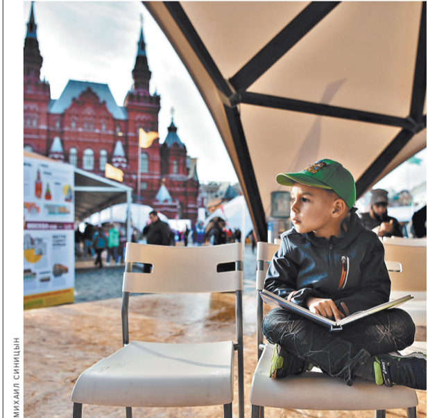
Дети любят читать книги, особенно если взрослые им не мешают.