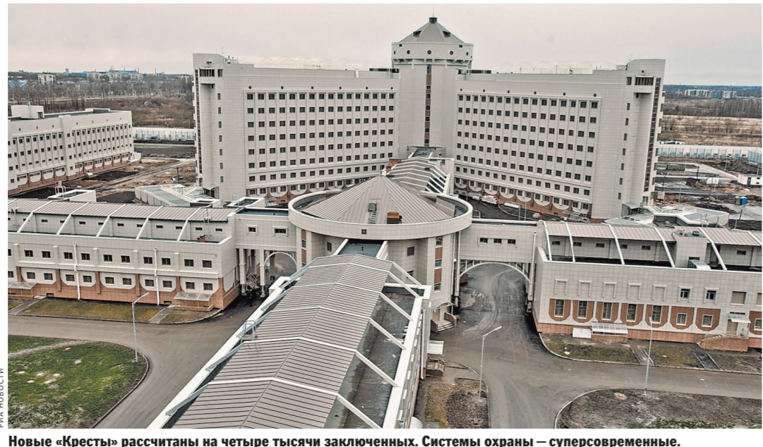
Новые «Кресты» рассчитаны на четыре тысячи заключенных. Системы охраны — суперсовременные.

Старое место — построенный в 1892 году комплекс исторических зданий «Крестов», что занимает 4,3 гектара в центре Петербурга, на Арсенальной набережной — также останется на казенной службе. Туда переедет региональное управление Федеральной службы исполнения наказаний. Также планируется открыть музей.