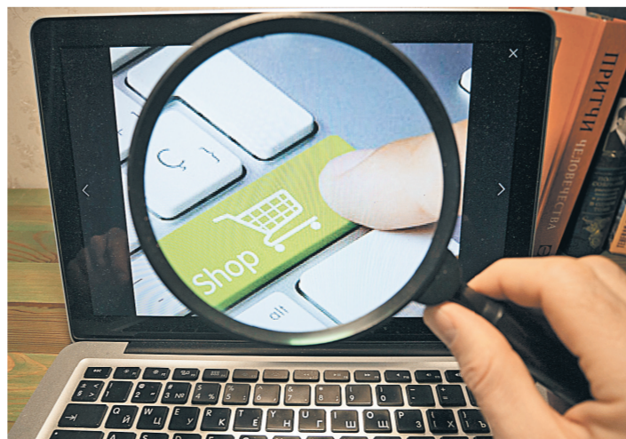
Покупку техники через Интернет Роспотребнадзор сделает безопасной.