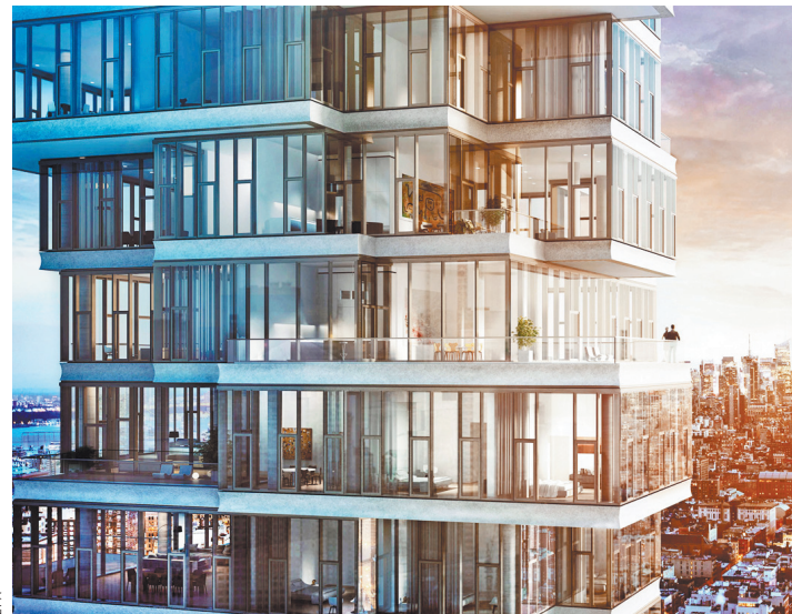
Небоскреб в Нью-Йорке — по проекту швейцарского бюро Herzog & de Mezon.