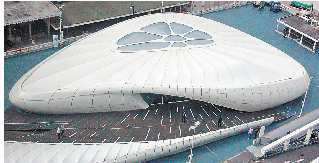
Футуристический павильон, созданный Захой Хадид в Гонконге.