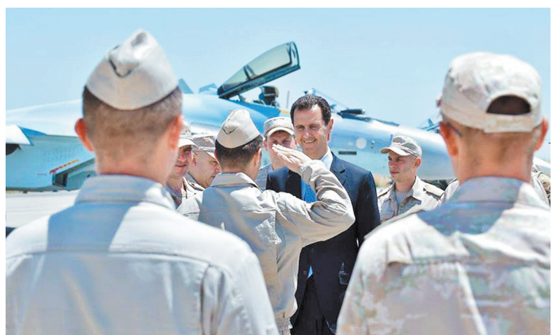
Президент Сирии Башар Асад уже привлек к голословным обвинениям западных политиков.

Глава Комитета Совета Федерации по международным делам