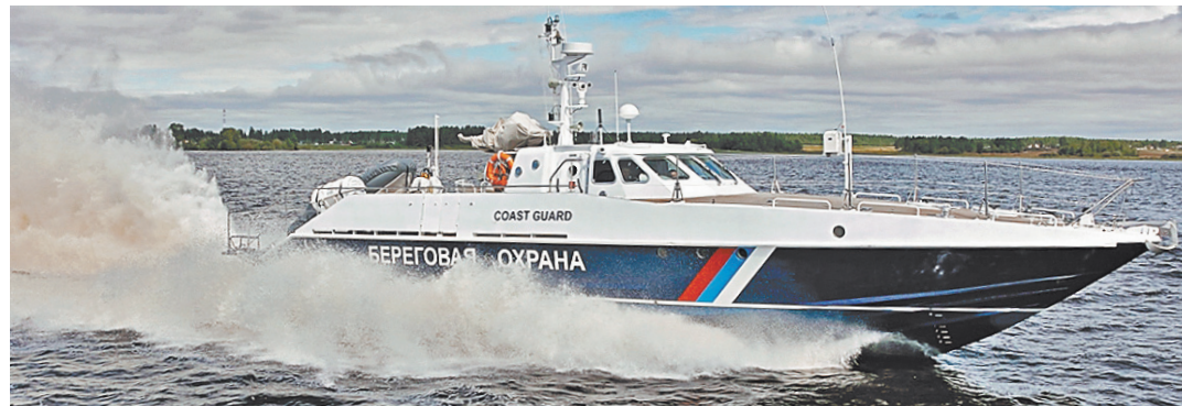
Катера от концерна «Калашников» уже встали на службу по охране морских акваторий.

Испытания новейшего транспорта России попали на видео — смотрите на сайте rg.ru/art/1417816