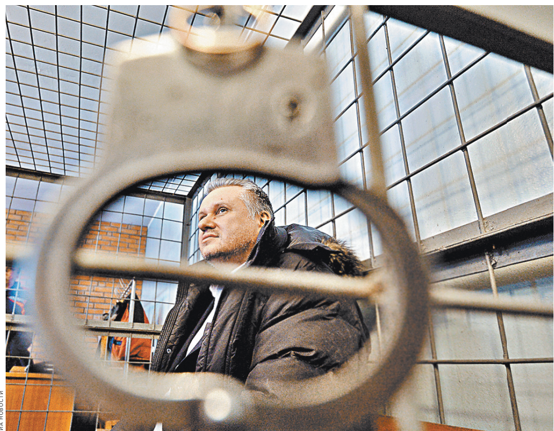
Бывший замгубернатора Челябинской области Андрей Третьяков попал на скамью подсудимых из-за того, что избил проводника рейса «Красноярск—Москва».

— В губе Андреева создана уникальная технологическая инфраструктура, которая позволяет производить эти сложные операции самым безопасным способом. Теперь у нас здесь целое производство. Наши иностранные партнеры, которые вошли в общей сложности около 8 миллиардов в расчете на рубль, продолжают участие в проекте, несмотря на все политические сложности.