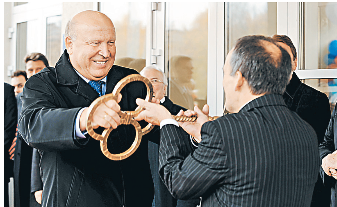
При Шанцеве в регионе были сданы под ключ сотни объектов от ФОКов до новых мостов и станций метро.