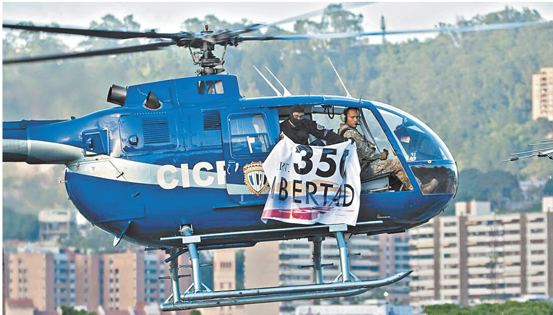
Оскар Перес вместе с четырьмя сообщниками обстреляли с вертолета здания МВД и Верховного суда Венесуэлы.

1 «Я осуждаю нападение и требую от оппозиционного объединения «Круглый стол демократического единства» сделать то же самое, — заявил президент Венесуэлы. — Я задействовал вооруженные силы для обеспечения безопасности. Мы будем ловить тех, кто совершил эту террористическую атаку».