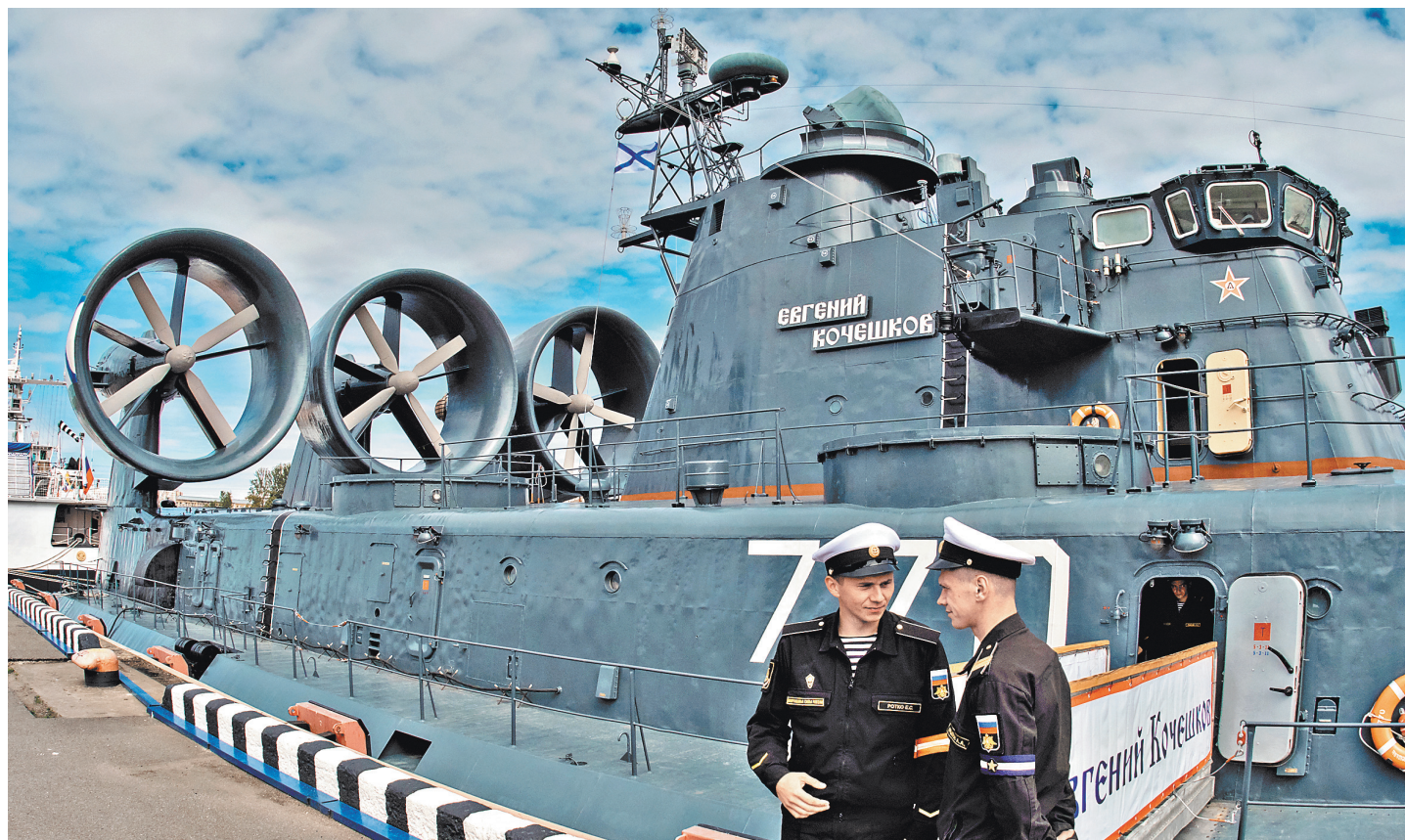
В России скоро возобновится производство боевых кораблей на воздушной подушке.

Например, концерн Воздушно-космической обороны «Алмаз-Антей» все более активно осваивает военно-морскую тематику. Достаточно вспомнить его «Калибры», которые становятся едва ли не основными крылатыми ракетами надводных боевых кораблей и подводных лодок. А одно из его структурных подразделений, разрабатывающее радиолокационное оборудование, можно сказать, ушло под воду и создало весьма интересный гидролокатор бокового обзора «Неман». Этот подводный радар способен обнаруживать и идентифицировать даже