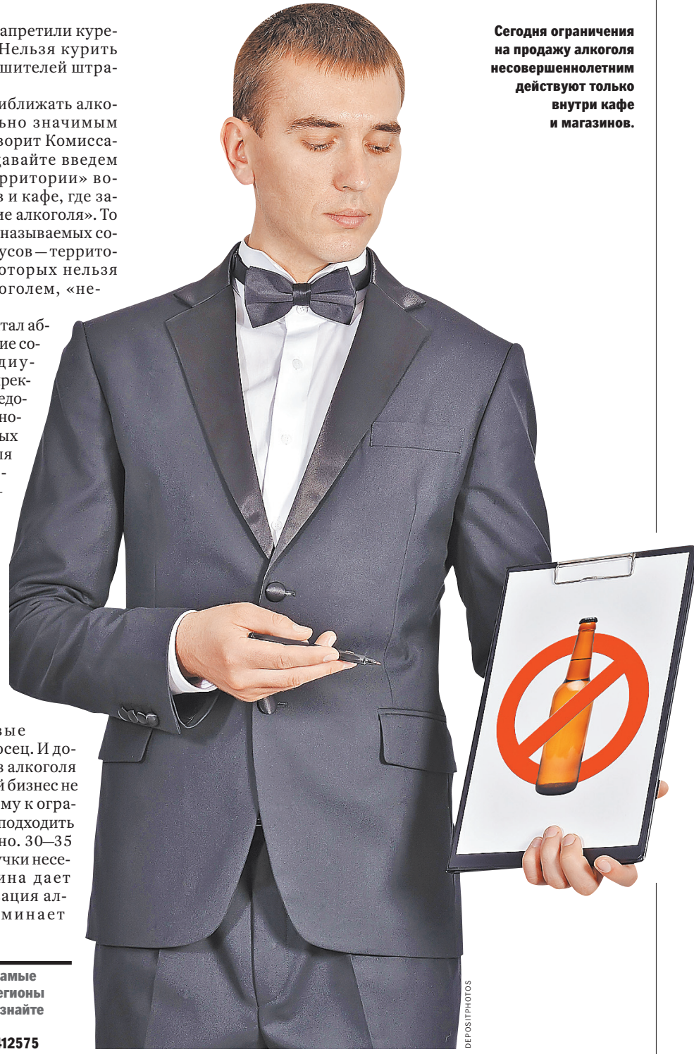
Сегодня ограничения на продажу алкоголя несовершеннолетним действуют только внутри кафе и магазинов.

Названы самые пьющие регионы России — узнайте на сайте rg.ru/art/1412575