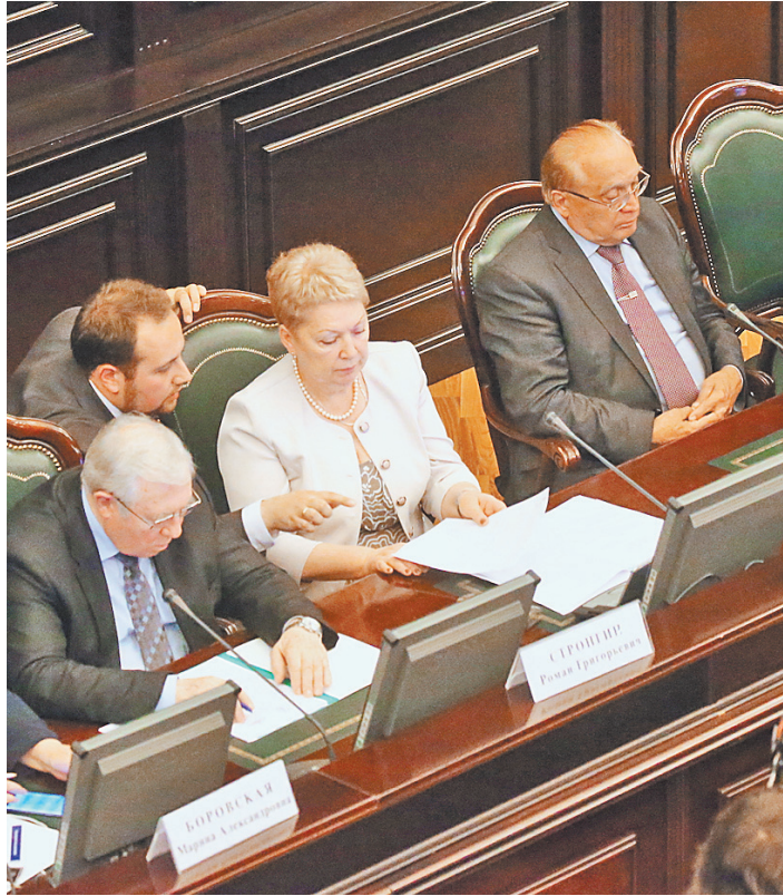
Почему ослабляется связь науки и образования, обсуждали ректоры вузов, ученые и руководители Минобрнауки.

В целом, участники первого совместного заседания были единодушны: у интеграции науки и образования нет альтернативы. Вузам и институтам надо создавать совместные базовые кафедры и исследовательские лаборатории, включать в программы образования курсы, связанные с приоритетными научными исследованиями, найти варианты мотивации молодежи заниматься наукой и возможности для самореализации.