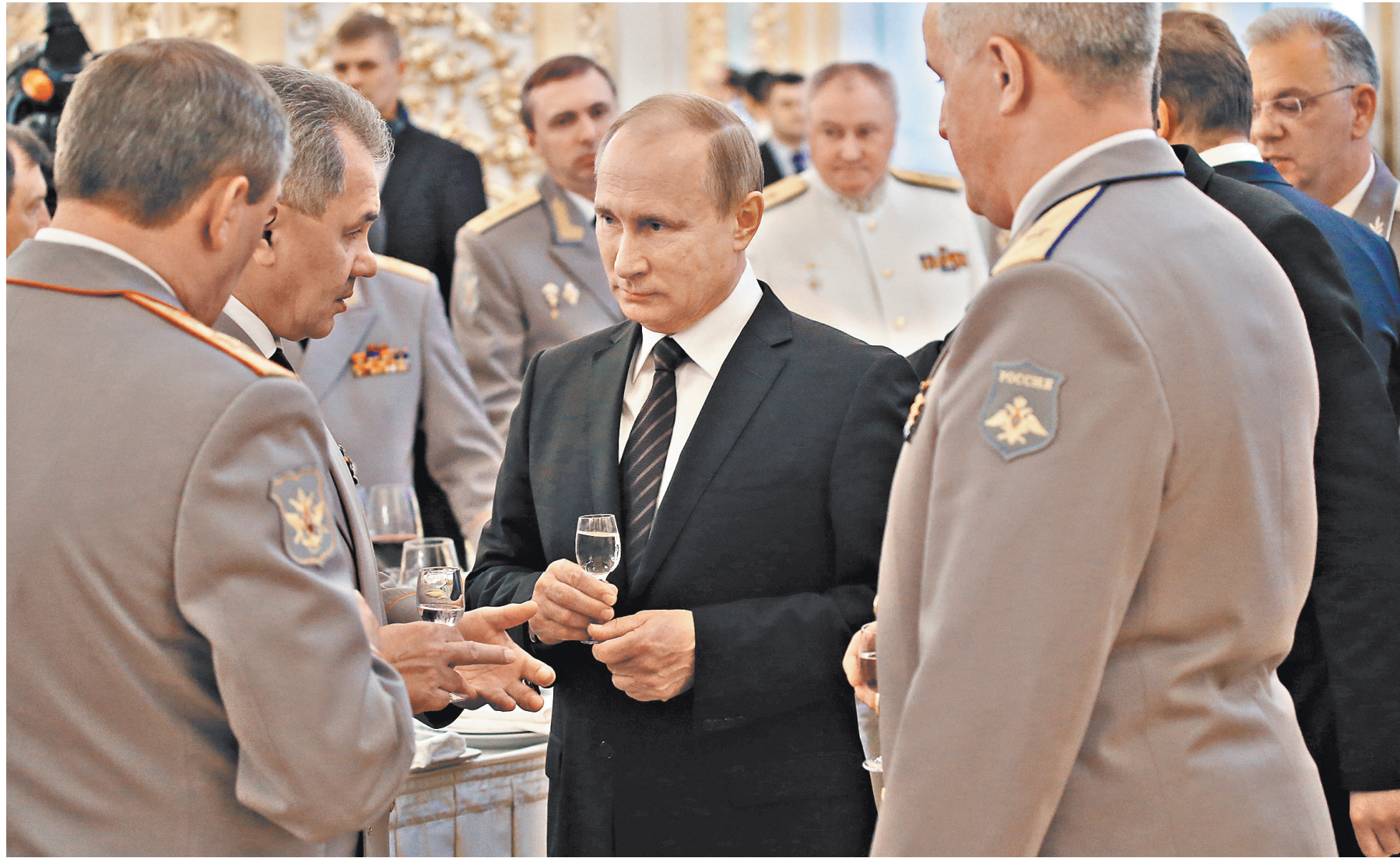
После официальной части Владимир Путин пообщался с руководством Минобороны.