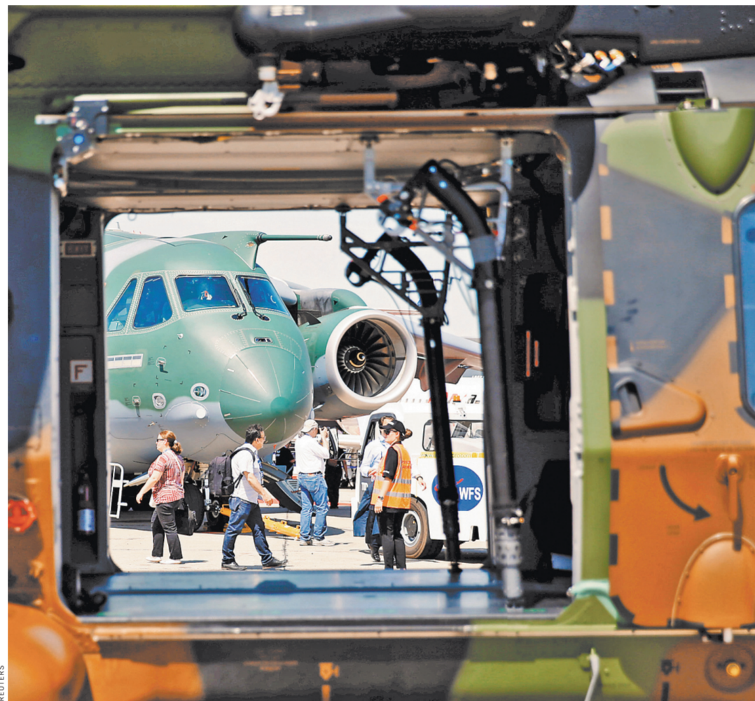
Из Ле-Бурже бразильский военно-транспортный самолет Embraer KC-390 отбудет в турне по другим странам.

К счастью, для меня неприятные приключения на этом закончились, чего нельзя сказать о других российских участниках авиационного биеннале. Например, глава делегации «Рособоронэк