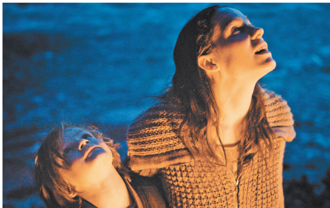
«Лучший из миров» Адриана Гойнгиера — реальная история молодой Хельги и ее сына Адриана.