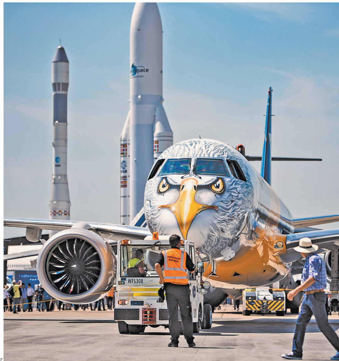
Пассажирский самолет среднемагистральных перелетов Embraer E190-E2 может вмещать 120 пассажиров в конфигурации с двумя классами и 146 — с одним. Максимальная дальность полета — 4537 км.

профессионалу хорошо известно, что пресс-службы и пресс-конференции как раз и являются лучшим средством для того, чтобы утаить информацию. Впрочем, иностранные компании в этом смысле мало чем отличаются от наших: таково, наверное, знаменитое время или специфика отрасли. Нашим еще можно было оправдать тем, что Россия на этом салоне была представлена исключительно макетами. Наша техника не стояла на смотровых площадках, не поднималась в небо, не мы, увыв, были главными героями этого праздника. Тому есть причины, связанные, как я понял, с войной санкций. А еще с тем, что сильно отстал наш гражданский авиационный парк за три десятка лет до передовых авиационных держав.