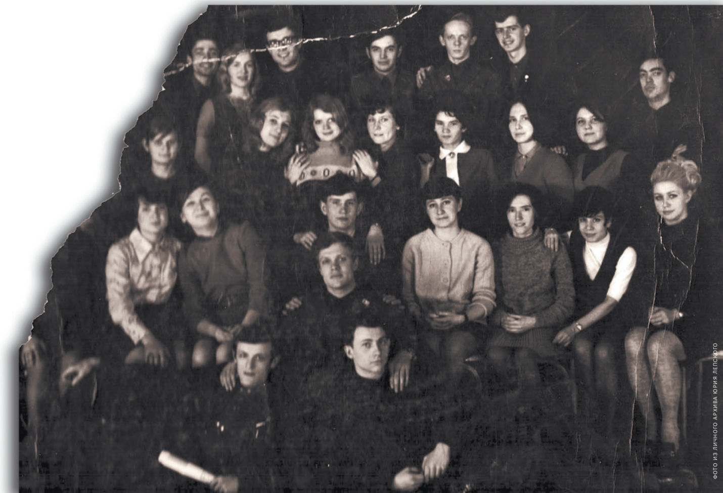
Наш курс на третьем курсе.

На втором курсе факультета журналистики мне предложили поработать журналистом. Разъездным корреспондентом в нашей университетской многотиражке. Я должен