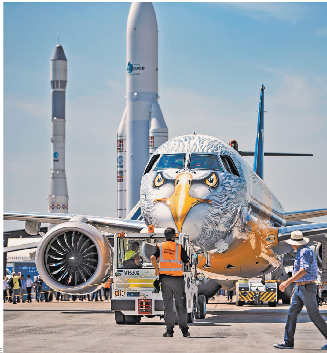
Пассажирский самолет среднемагистральных перелетов Embraer E190-E2 может вмещать 120 пассажиров в конфигурации с двумя классами и 146 — с одним. Максимальная дальность полета — 4537 км.

профессионалу хорошо известно, что пресс-службы и пресс-конференции как раз и являются лучшим средством для того, чтобы утаить информацию. Впрочем, иностранные компании в этом смысле мало чем отличаются от наших: таково, наверное, знаменитое время или специфика отрасли. Наши еще можно было оправдать тем, что Россия на этом салоне была представлена исключительно макетами. Наша техника не стояла на смотровых площадках, не поднималась в небо, не мы, увы, были главными героями этого праздника. Тому есть причины, связанные, как я понял, с войной санкций. А еще с тем, что сильно отстал наш гражданский авиатранс за три мутных десятилетия от передовых авиационных держав.