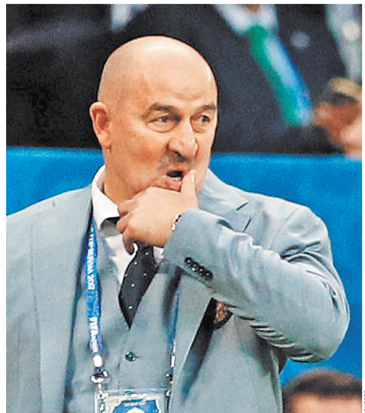
Черчесов считает: наша сборная все-таки сделала качественный скачок.