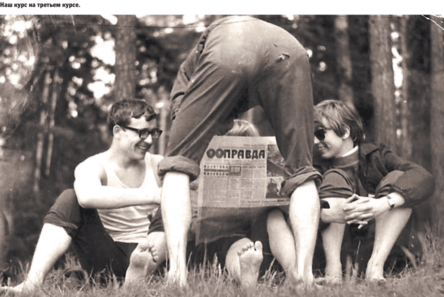
Мои однокурсники и в ту пору знали правильный ответ на вопрос «в чем сила, брат?»

был ездить по колхозам и совхозам Красноуфимского района и рассказывать читателям, как в этих колхозах и совхозах трудятся на уборке картофеля университетские студенты. Однажды я прикатил в какой-то колхоз вместе с агитбригадой. В составе агитбригады были танцоры с филфака и бард с истфака.