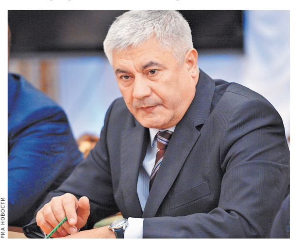
Владимир Колокольцев: Ситуацию удается держать под контролем.

«Ежегодно мы ликвидируем порядка 80 лабораторий, и уже с начала текущего года в России силами наших сотрудников ликвидирована деятельность 45 таких лабораторий», — рассказал Колокольцев. Министр привел пример, как в мае — июне в Московской области были ликвидированы три нарколаборатории и пресечена деятельность международной преступной группировки, в числе задержанных участников которой были граждане Украины. «Были изъяты наркотики. Их закладывали в 13 тайников. Оптовые партии по пять килограммов», — сказал министр. По его словам, наркотикорегистры общались между собой через различные мессенджеры.