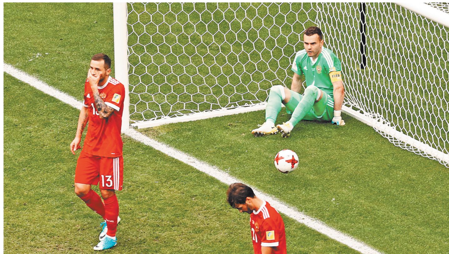
В действиях обороны россиян пока хватает несогласованности и ошибок. Остается надеяться, что через год в защите у нас будет меньше проблем.