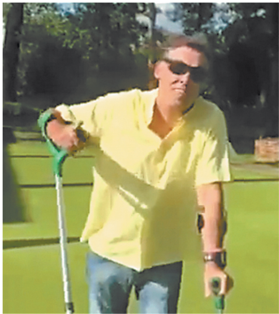
...А теперь в его руках костыли.