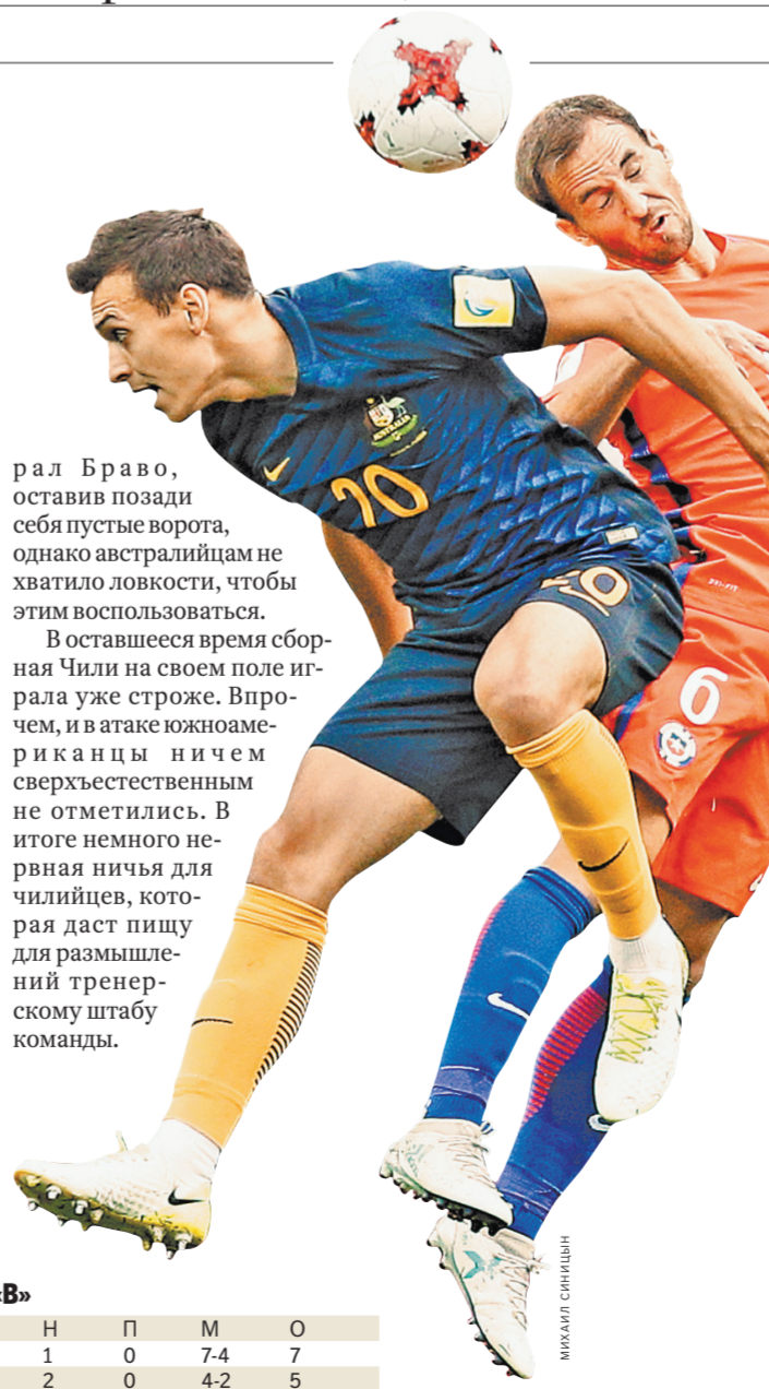
Во встрече обладателей Кубка Америки чилийцев и футболистов с Зеленого континента было много бескомпромиссной борьбы на втором этапе.

По лицам австралийцев было видно, как они расстроились. Но опускать руки «соккерузы» не собирались. На 73-й минуте форвард с гоночной фамилией Макларен один ворвался в чужую вратарскую, но не смог толково поставить ногу под удар. Чуть позже на выходе опротивчиво сыг-