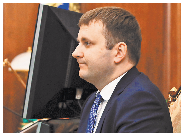
Максим Орешкин последние два года работал заместителем министра финансов.

«Как это сделать?» — спросил Путин. «Много ограничений. Сейчас как раз начнем работу и все детально распишем», — пообещал Орешкин, после чего получил напутствие президента. «Вы