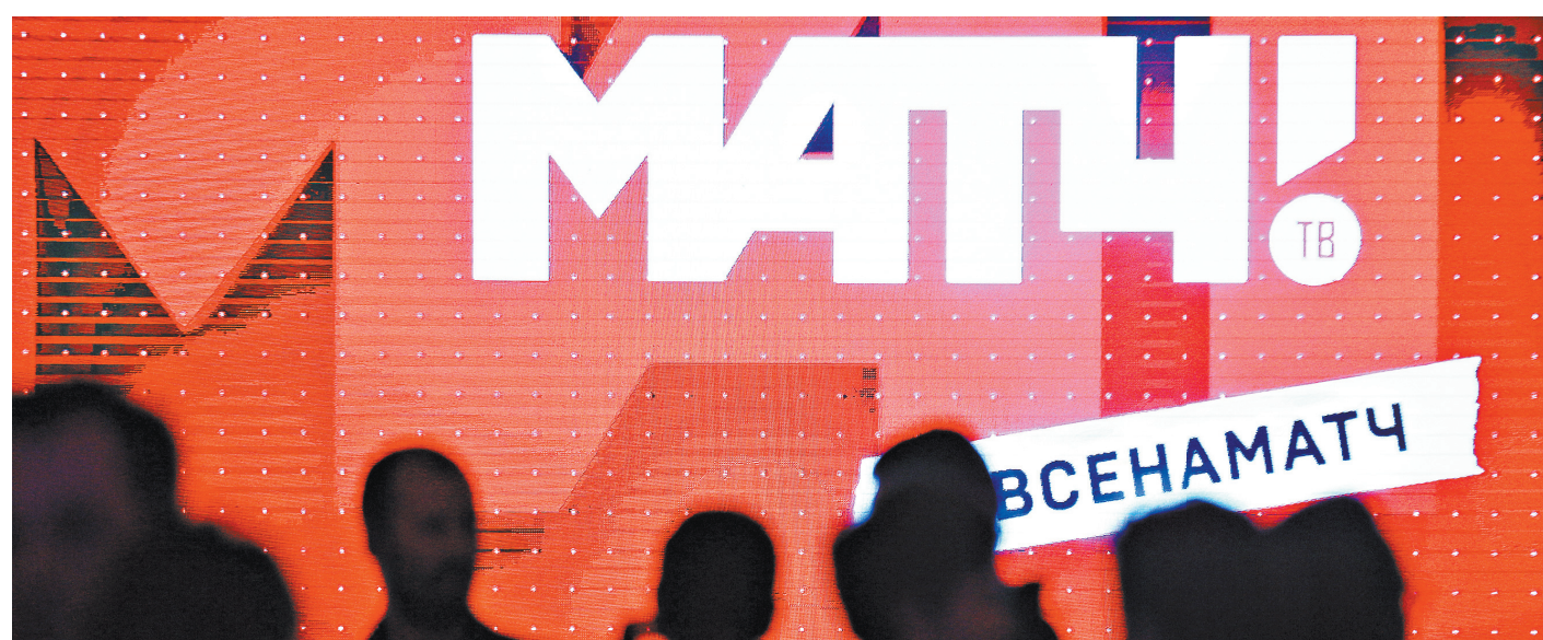
За год телеканалу «Матч ТВ» удалось привлечь к своему эфиру молодежную аудиторию, которая выросла в Интернете и привыкла к другому контенту.

И футбол не смотрят? Тина Канделаки: Высокие рейтинги футбола на телеканале «Матч ТВ» были, есть и будут. Речь о другом — о специфике просмотра. Цифры могут быть очень высокими, а потом, когда возникает понимание, что ход матча уже предопределен, люди переключают канал, потому что расстраиваются. И документальное кино чаще всего связано именно с победами