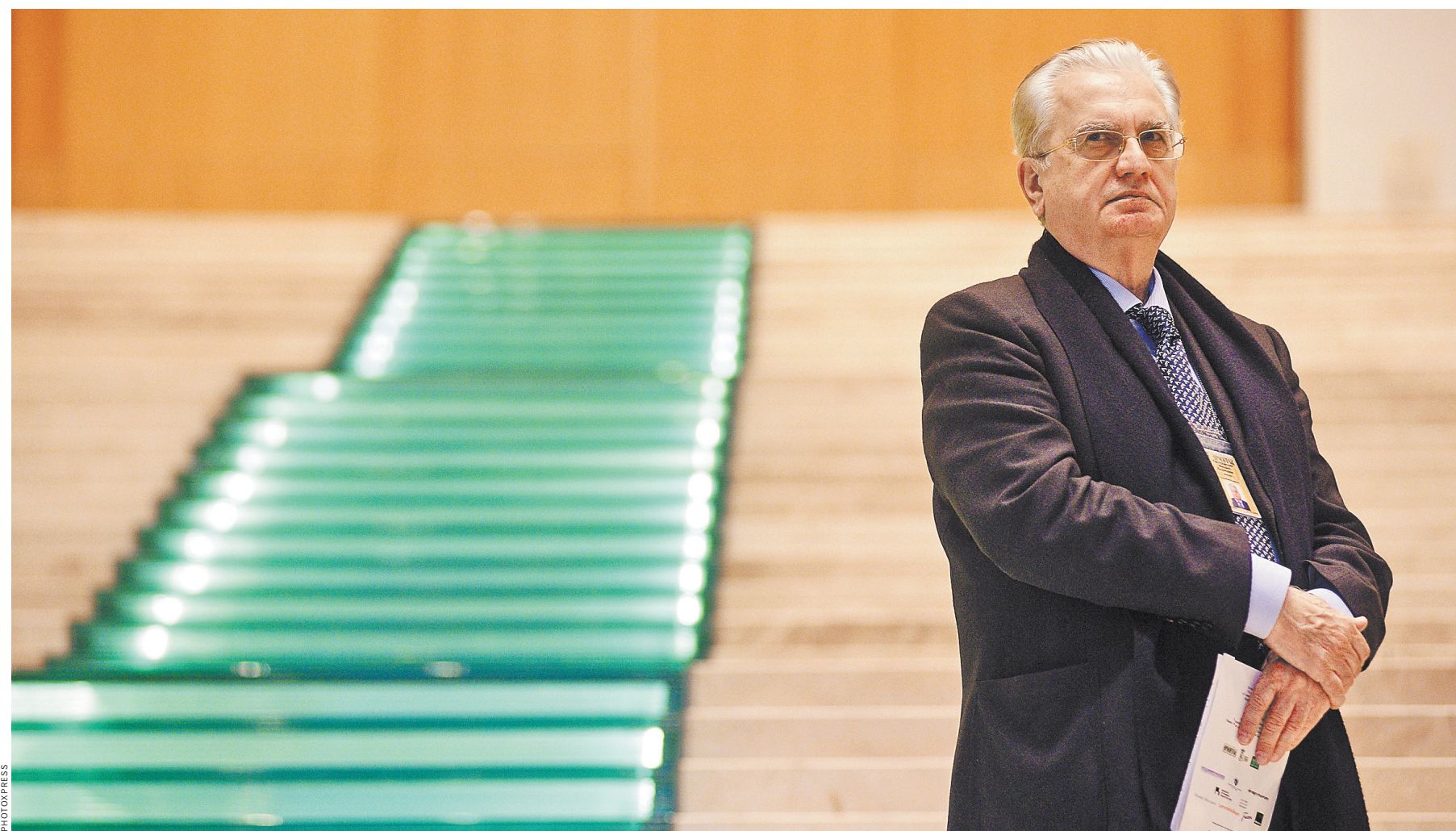
Михаил Пиотровский. Эрмитаж ждет гостей V Санкт-Петербургского культурного форума.

1 Раздражение экспозицией показывает, что у нас громадное количество людей не понимает классическое искусство. Я думаю, что все это станет предметом диалога на одной из самых интересных площадок форума — вечернем интеллектуальном марафоне, как раз посвященном современному искусству. На нескольких встречах марафона ожидаются острые и бурные обсуждения — с оглядкой на подарок, который Россия недавно сделала Центру Помпиду. Интересно будет обсудить особенности современного русского искусства в контексте мирового. Будет обсуждаться и архитектурный проект музея «Эрмитаж-Москва», который будет воздвигнут на площадке ЗИЛА.