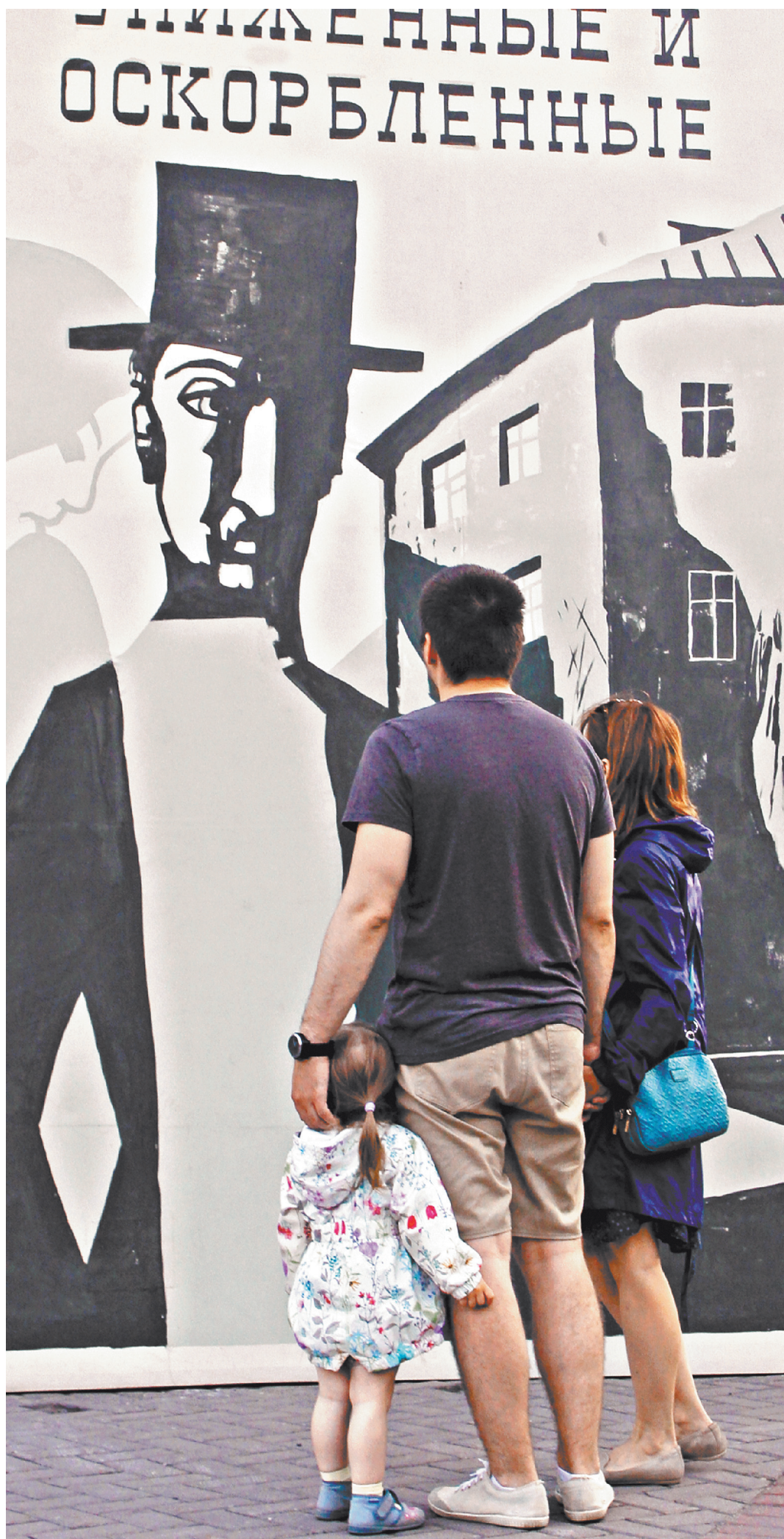
Павел Крашенинников: Семейная сфера требует очень взвешенного и аккуратного регулирования.

Многие ученые обосновывали различия между семейным и гражданским правом, их доводы и сегодня звучат не менее убедительно, чем 70—80 лет назад. Слишком значителен личный характер отношений, лежащих в основе брака, рождения детей, создания и жизни семьи. Договорные принципы, как бы они ни влияли на супружеские и родительские отношения, не могут быть противопоставлены лич-