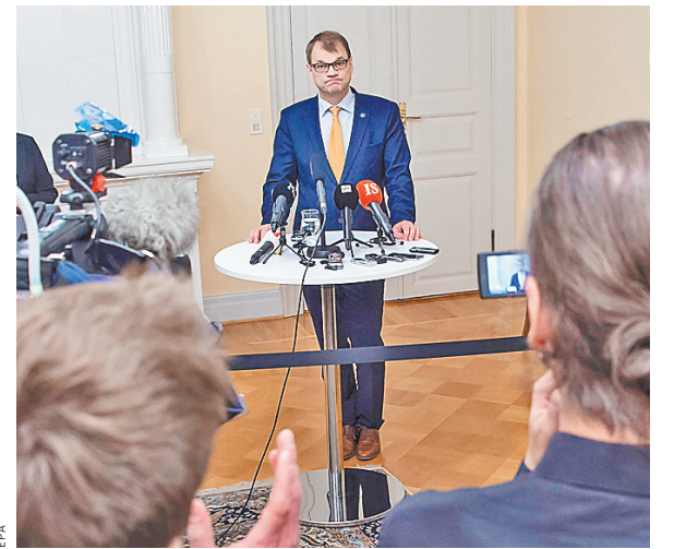
Финский премьер Юха Сиппиля весьма своеобразно понимает «свободу слова».

Журналисты продолжили копать дальше и нарыли доказательств еще на две громкие публикации. Но и на этот раз главный редактор Службы новостей «Юле» Атте Яакселяйнен запретил обнародовать новые факты о делах премьера. А вечером в понедельник руководителям отделов теле- и радиоканалов рекомендовали закрыть свои рты и более не обсуждать возможную ангажированность Сиппиля на интернет-страницах издания и в теле-программах. Возмущенные журналисты обратились с открытым письмом к руководству компании, выразив возмущение тем, что им запрещают доносить до граждан общественно значимую информацию о подозрительных делах премьера, публиковать статьи и выпускать ток-шоу на эти темы. Журналисты также обратили внимание, что Сиппиля отменил свое участие в большой вечерней программе «А-Студио», чтобы избежать острых вопросов.