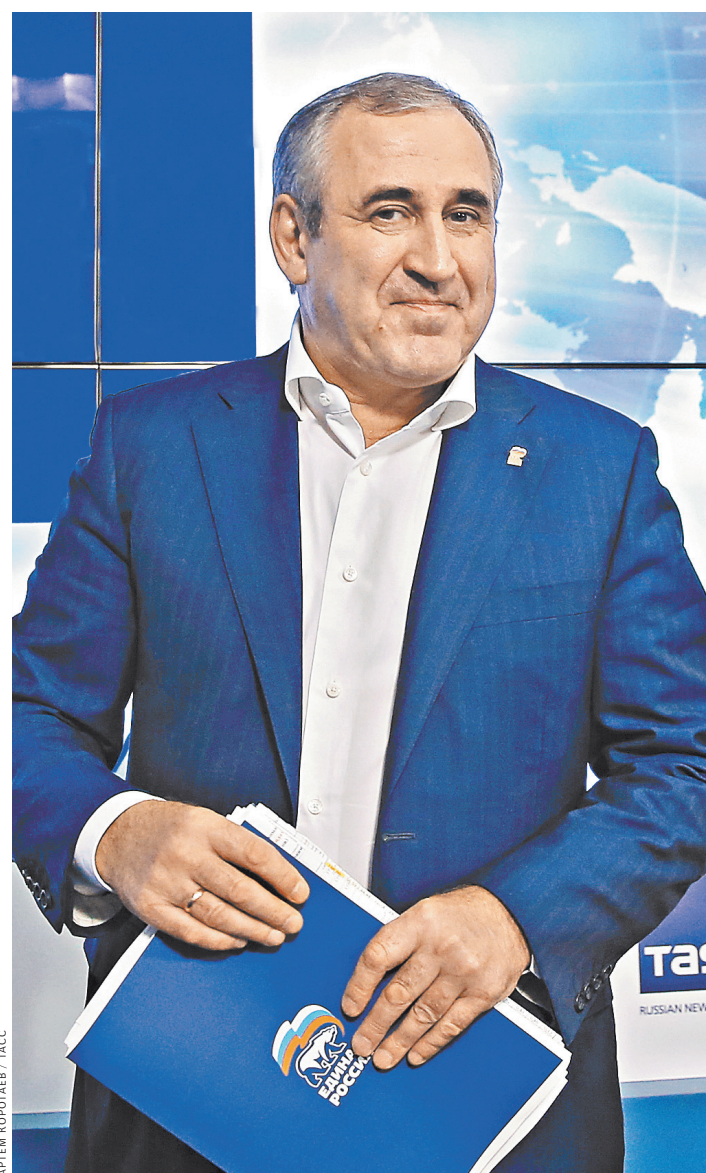
Сергей Неверов: Мы дорожим тем доверием, которое нам оказали наши граждане.

Сергей Неверов: Очень многое мы сделали в политической истории России впервые. Впервые в 2016 году список партии был сформирован по результатам открытого предварительного голосования за кандидатов, которое прошло в один день по всей стране. Проголосовать мог любой желающий гражданин на-