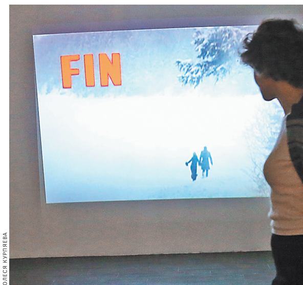
Расчитанный на несколько лет проект предстает исследованием, фильмом, которые создаются на наших глазах...

Все разговоры о любви начинаются с вопроса нашему отражению в зеркале: «У тебя найдется для меня время?»