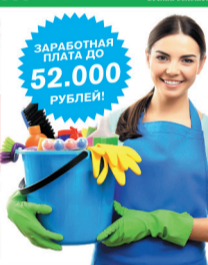
ГРАФИК РАБОТЫ 6/1

СТАБИЛЬНАЯ, СВОЕВРЕМЕННАЯ ВЫПЛАТА 2 РАЗА В МЕСЯЦ