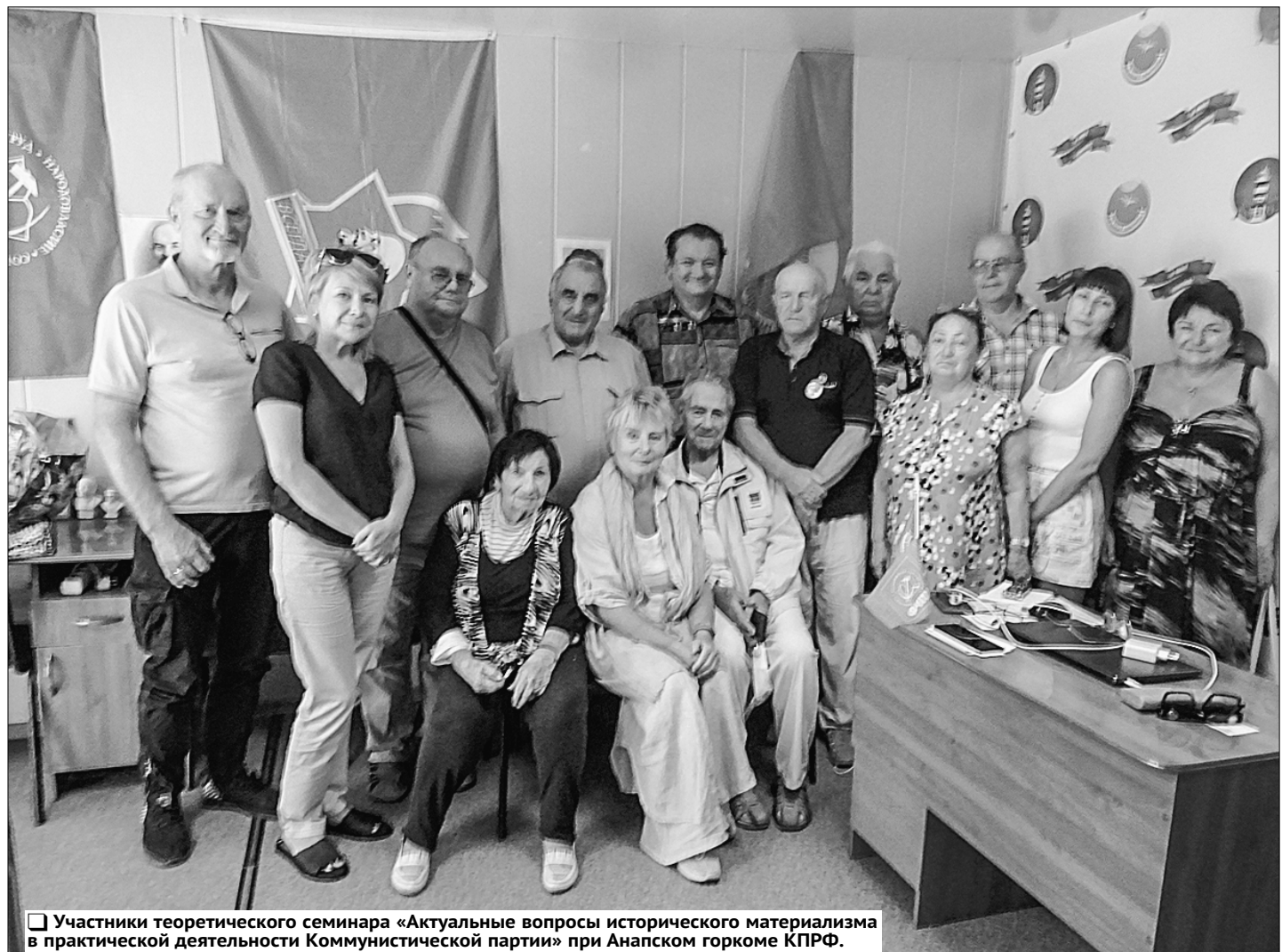
Участники теоретического семинара «Актуальные вопросы исторического материализма в практической деятельности Коммунистической партии» при Анапском горкоме КПРФ.

Любовь ЯРМОШ, соб. корр. «Правды». г. Анапа, Краснодарский край.