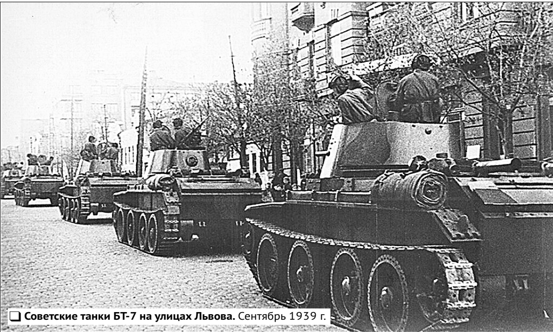
Советские танки БТ-7 на улицах Львова. Сентябрь 1939 г.

Тем не менее для Польши проблема Западной Украины оставалась нерешённой. По международным договорам, заключённым в 1918–1920 годах, Западная Украина формально и фактически не признавалась частью Польского государства. Польша считалась лишь временным военным оккупантом, чьё правовое положение регулировалось соответствующим международным статусом, утверждённым 25 июня 1919 года на Парижской мирной конференции.