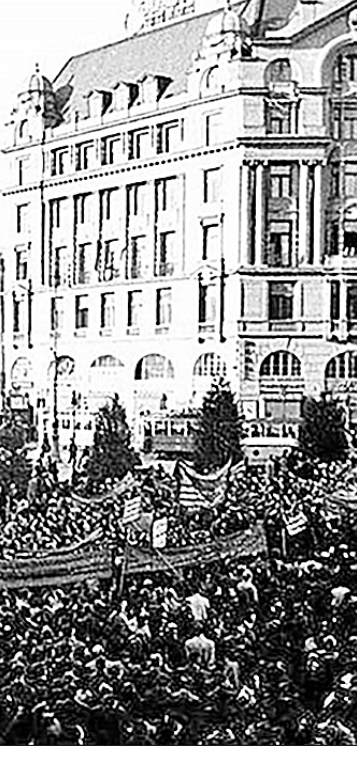
Митинг во Львове.

Росли также ряды и комсомольских организаций. К маю 1941 года в них насчитывалось 61824 члена ВЛКСМ.