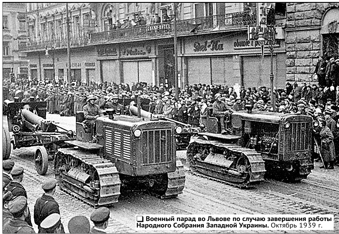
Военный парад в Львове по случаю завершения работы Народного Собрания Западной Украины. Октябрь 1939 г.

без гнёта и насилия, которые тяготели над трудящимися Западной Украины долгие годы. К политической жизни поднимаются широкие слои населения...» Далее излагались рекомендации по организации органов государственной власти и управления. Отмечалось, в частности, что основой