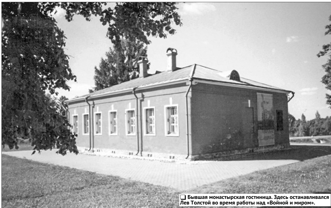
Бывшая монастырская гостиница. Здесь останавливался Лев Толстой во время работы над «Войной и миром».

На стене внешне больше ничем не примечательного одноэтажного кирпичного здания бывшей монастырской гостиницы я вижу мраморную доску, возвышающую, что здесь в сентябре 1867 года останавливался писатель Лев Толстой, работавший тогда над «Бородинскими» главами своей знаменитой эпопеи. А внутри домика теперь не маленькие комнатки-номера — в двух залах разместились постоянная музейная экспозиция «Герои романа «Война и мир» на Бородинском поле». Книжки и архивные документы, листы батальной живописи и портреты участников сражения, изображённых в толстовском произведении, копии страниц из рукописей писателя и находки с поля сражения — шаг за шагом мы всё глубже погружаемся в далёкую эпоху, в творческую лабораторию Льва Николаевича Толстого, начинаем смотреть на Бородинскую битву глазами романтических персонажей.