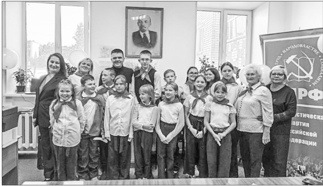
Коммунисты Кировского района Пермского края совместно с комсомольцами организовали туристический поход для пионеров.

Делом были подготовлены разные тематические станции, на которых они пели походные песни, собирали палатки на скоростях и играли в торочки. Также для ребят были организованы игры на сплочение и курс по первой медицинской помощи.