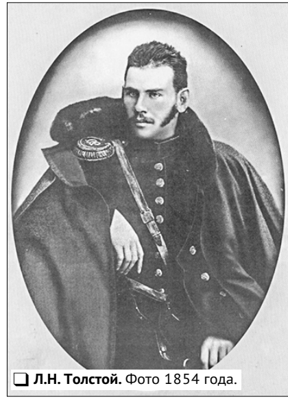
Л.Н. Толстой. Фото 1854 года.

«Солнце стояло несколько влево и зади Пьера и ярко освещало сквозь чистый, редкий воздух огромную, амфитеатром по поднимавшейся местности открывшуюся перед ним панораму. Вверх и влево по этому амфитеатру, разрезывая его, вилась большая Смоленская дорога, шедшая через село с белой церковью, лежавшее в пятистах шагах впереди кургана и ниже его (это было Бородино). Дорога переходила под деревянный мост и через спуски и подъёмы вилась всё выше и выше к видневшемуся вёрст за шесть селению Валуеву (в нём стоял теперь Наполеон). За Валуевым дорога скрывалась в желтевшем лесу на горизонте. В лесу этом, берёзовом и оловом, правдо от направления дороги, блестяли на солнце дальний крест и колокольня Колоцкого монастыря. По всей этой синей дали, вправо и влево от леса и дороги, в разных местах виднелись дымящиеся костры и неопределённые массы войск наших и неприятельских. Направо, по течению рек Колочи и Москвы, местность была ущелиста и гориста. Между ущельями их вдали виднелись деревни Безузово, Захарьино. Налево местность была ровнее, были поля с хлебом, и виднелась одна дымящаяся, сожжённая деревня — Семёновская...»