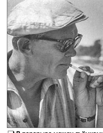
□ В перерыве между съёмками.

К тому времени Гайдай был уже сложившимся актёром. Он окончил театральную студию, после чего служил в Ир-