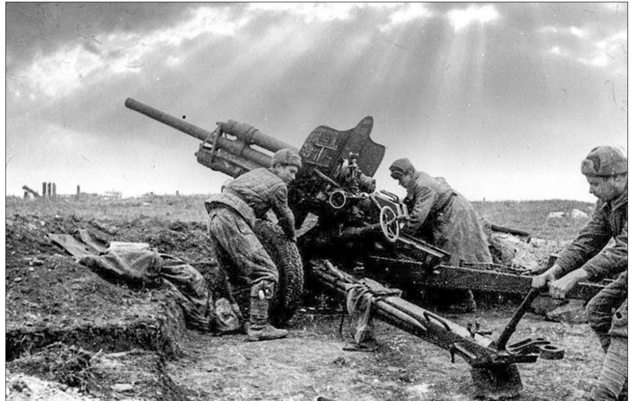
□ В обороне Спартановки большую роль сыграла наша артиллерия, находившаяся на островах и левом берегу Волги.