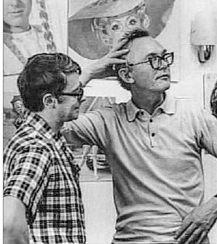
□ На съёмках фильма «Иван Васильевич меняет профессию».

В одном из писем, которые мешками слали Гайдаю, советский школьник написал: «Дорогой дядя Гайдай! Я вашу картину «Операция «Ы» смотрел 32 раза. Очень понравилась. Возьмите меня сниматься». И то была чистая правда: нередко советская детвора соревновалась в том, кто во дворе больше раз посмотрит тот или иной понравившийся всем фильм. А поскольку детский билет в кинотеатр в 1960-е годы стоил 10 копеек, то названный выше рекорд был тогда вполне достижимым. Потому что школьный обед стоил 20 копеек, и можно было, сэкономив деньги, что мама дала тебе на обед, сходить лишний раз в кино.