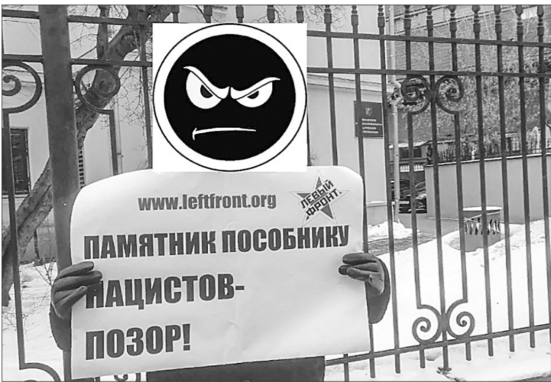
Возле здания представительства Ростовской области в Москве активисты «Лёвого фронта» провели пикет, требуя демонтировать памятник нацистскому пособнику Ивану Добробабину, который установлен в городе Цимлянске.

Участники акции вышли с плакатами «Памятник пособнику нацистов — позор!», «Уберите памятник Добробабину!», «Дашё денационализацию Цимлянска!».