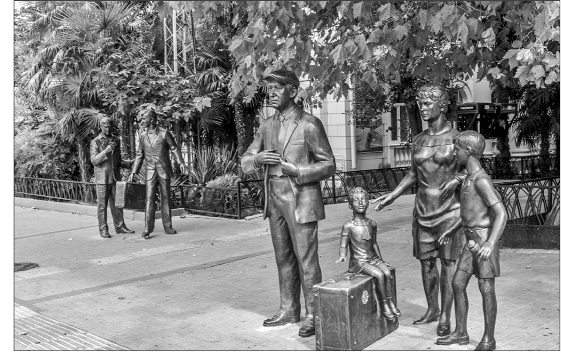
□ Памятник героям «Бриллиантовой руки» в Сочи.

По горизонтали: 5. Объём чего-либо, вычисление объёма фигуры. 6. Часть войск, находящаяся впереди главных сил. 11. «...воет, лик и злобен, меж утёстных громад» (М. Лермонтов). 12. Форма рельефа. 13. Обращение, лозунг. 14. Часть ударного механизма в огнестрельном оружии. 16. Пёстрая дневная бабочка, а также листва с красноватой шерстью. 17. Небесное тело. 21. Устройство для напорного перемещения жидкости или газа. 24. Древнегреческий струнный инструмент, родственный лире. 25. Остановка в пути, а также место остановки (по С. Ожегову). 26. Млекопитающее семейства беличьих, объект промысла. 28. Научная или философская теория. 29. Привлечённое закрытое женское среднее учебное заведение в дооктябрьской России. По вертикали: 1. Подземная горная выработка. 2. Сим-