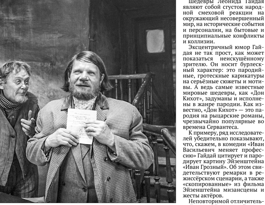
□ Л. Гайдай-актёр (в роли Варфоломея Коробейникова). Кадр из фильма «12 стульев».

кутском областном драматическом театре актёром и осветителем. Среди сыгранных им ролей — Солёный в чеховской пьесе «Три сестры», Иван Земнухов в «Молодой гвардии», Медведев в «Славе» Гусева, Винченцо в «Укрошении строптивой» Шекспира, шофёр Граченко — «Под каштанами Праги» Симонова, радист Аланасенко — «За тех, кто в море» Лавренёва, Яков Яссе в «Заговоре обречённых» Николая Вирты и десяток мелких ролей.