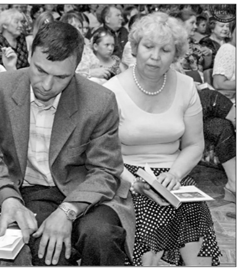
Со своими читателями.