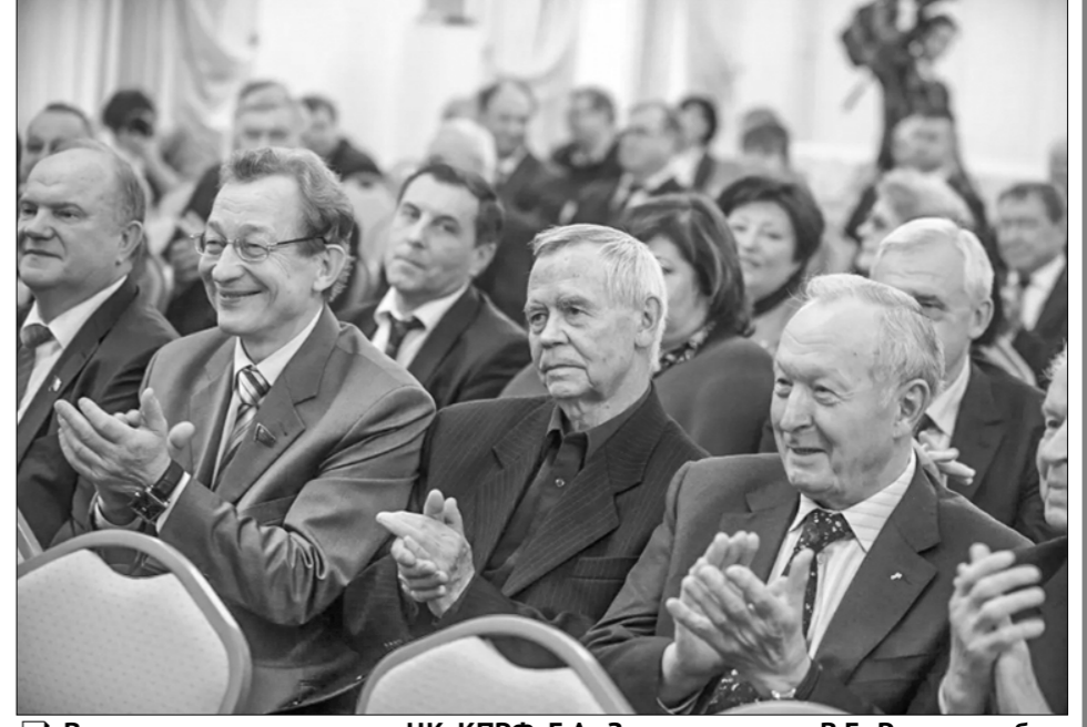
Вместе с председателем ЦК КПрФ Г.А. Зюгановым он, В.Г. Распутин, был участником важных партийных мероприятий.

Публикуемый сегодня диалог (с небольшими сокращениями) состоялся в марте 2009 года.