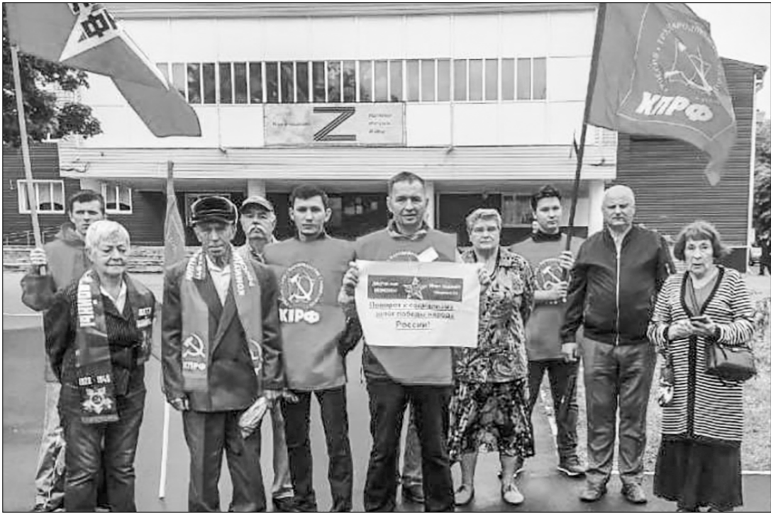
В Брянске коммунисты продолжают нести людям слово правды. На сей раз на площади возле Дворца культуры им. Д.Е. Кравцова активисты Володарского отделения КПРФ провели митинг.

С юда вместе с коммунистами и комсомольцами пришли и представители общественной организации «Дети войны», движением «За новый социализм» и «Левый фронт», «ВКС — Назад России».