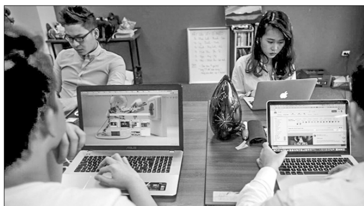
В этой школе стартапов в Ханое готовятся будущие капитаны инновационной экономики.

Успехам стартап-движения содействовала не только политика партии и государства, но и энтузиазм молодых вьетнамцев, которые в условиях реформ проявляют интерес к предпринимательской деятельности.