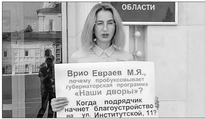
Врио Евраев М.Я., почему прокусовывает губернаторская программа «Наши дворы»? Когда подрядчик начнёт благоустройство на ул. Институтской, 11?

дровны, жильцы одного из домов обратились к ней, так как опасаются, что асфальт в их дворе «по сложившейся традиции» начнут укладывать в снег.