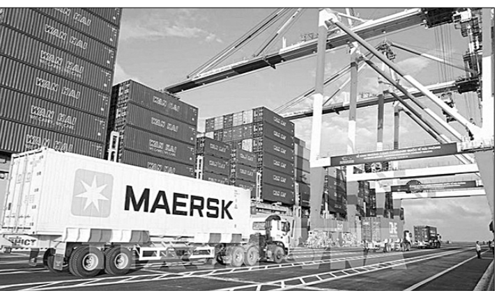
Порт Хайфона — ворота Вьетнама в мировую торговлю.