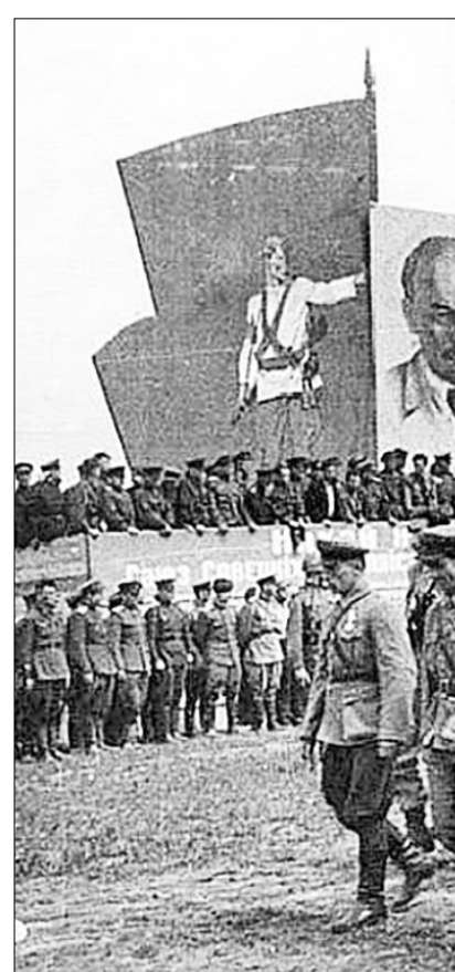
16 июля 1944 года в Минске прошёл парад, в котором участвовали бойцы партизанских отрядов, сражавшиеся на оккупированной гитлеровцами территории.

Большая работа проводилась по созданию подполья и партизанских отрядов. В 89 районах республик были созданы подпольные органы и 397 территориальных подпольных организаций. Для работы в нелегальных условиях осталось около 8 тысяч коммунистов. По данным на 25 июля 1941 года, были сформированы 118 партизанских отря-