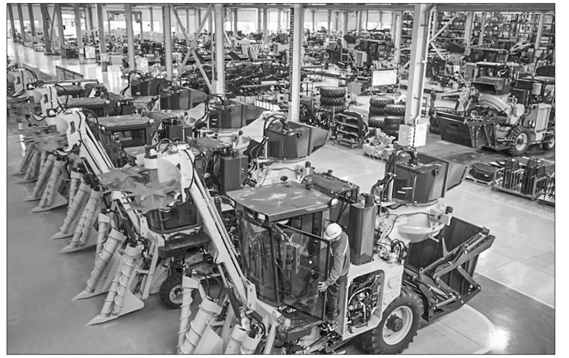
Чем ближе сезон производства тростникового сахара, тем больше заказов на комбайны для уборки сахарного тростника получает завод сельскохозяйственной техники в городе Лючжоу (Гуанси-Чжуанский автономный район, Южный Китай). Рабочие предприятия спешат собрать и протестировать достаточное количество уборочных машин.