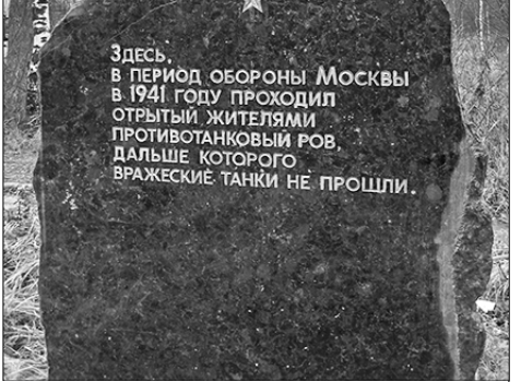
Памятник «Противотанковый ров» в Лобне.

купантов из посёлка рядом со станцией. В братской могиле покоятся 103 павших воина. В память о них здесь воздвигнут монумент на средства, собранные школьниками. Одна из улиц названа в честь 35-й отдельной стрелковой дивизии. Далее Лобненского рубежа обороны столицы немцы из Красной Поляны и деревни Катюшки не прошли.