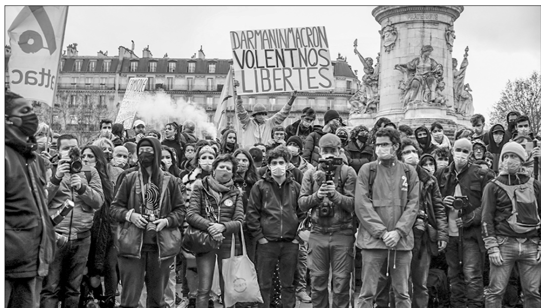
В Париже протестуют как против законопроекта о глобальной безопасности...