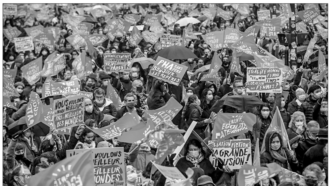
...так и против законопроекта о биоэтике.