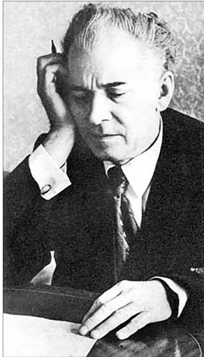
поэт был удостоен в 1941 году Сталинской премии первой степени, он писал:

И КОЛЬ уж заговорили об искренней любви Тычины к братским народам, выразившейся в знаменитом стихотворении 1936 года «Чувство семьи единой», то следует сказать, что это чувство, вместе с уверенностью в необходимости поддержания постоянной дружбы народов, жило в нём всегда. Ещё в 1929 году он писал: «Когда сходятся народы — что может быть лучше? Когда встречаются культуры — какой же там высекается огонь? Высекается признание, и на давних надеждах и мечтах вырастает дружба». В этом прекрасном стихотворении, давшем название сборнику стихов, за который