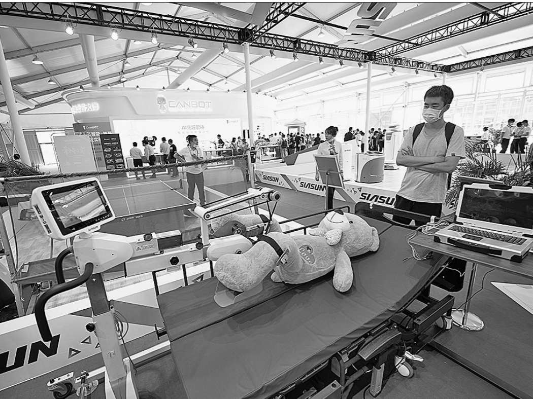
● Здесь демонстрировалась система реабилитационных тренировок.