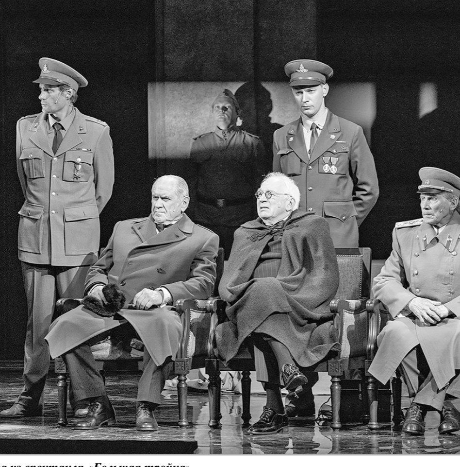
Сцена из спектакля «Большая тройка». Малый театр, сентябрь 2020 г.

разрыв с набившей оскомину карикатурой при его изображении, тоталюно утвердившейся за последние десятилетия.