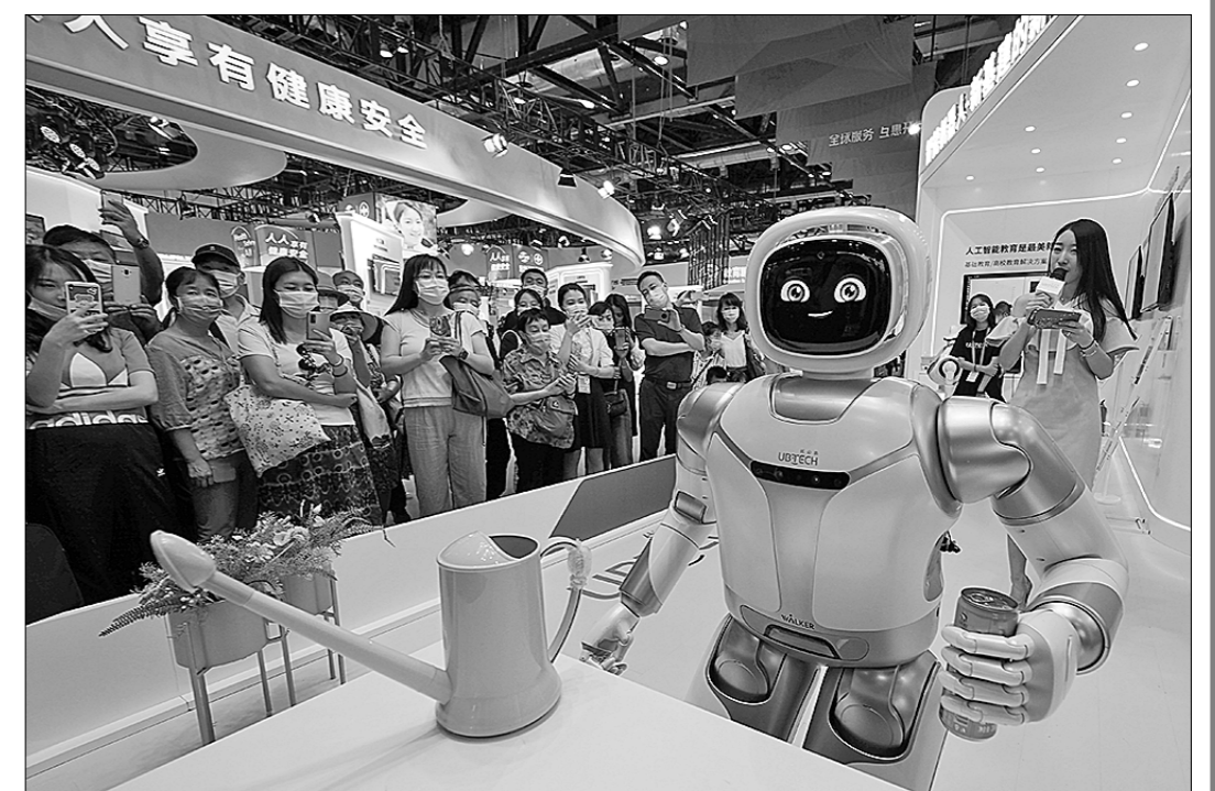
● Посетители наблюдают за работой умных домашних роботов.

С развитием информационных технологий торговля новыми услугами с использованием интернета, больших дан-