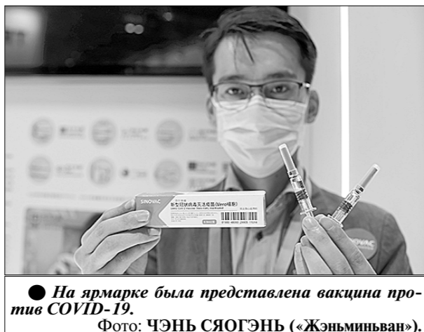
● На ярмарке была представлена вакцина против COVID-19.

Сотрудничество между Китаем и странами вдоль «Пояса и пути» в торговле услугами представлено туризмом, транспортом и строительством. Связи между народами способствуют стремительному росту торговли услугами в туристической сфере. Страны вдоль «Одного пояса, одного пути» ежегодно принимают свыше 25 млн китайских туристов. Китай стал крупнейшим туристическим донором для государств и регионов по маршруту «Пояса и пути». Туристы из Китая способствовали росту экономики и занятости в странах и регионах вдоль «Пояса и пути», стимулировали торгово-экономическое взаимодействие.