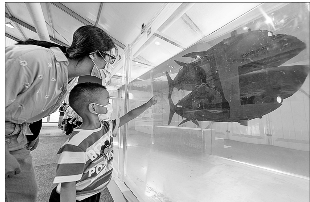
● Мальчик с мамой с интересом рассматривают механизированную рыбу.

В настоящее время торговля услугами уже стала новой движущей силой глобального экономического роста. Доля тор-