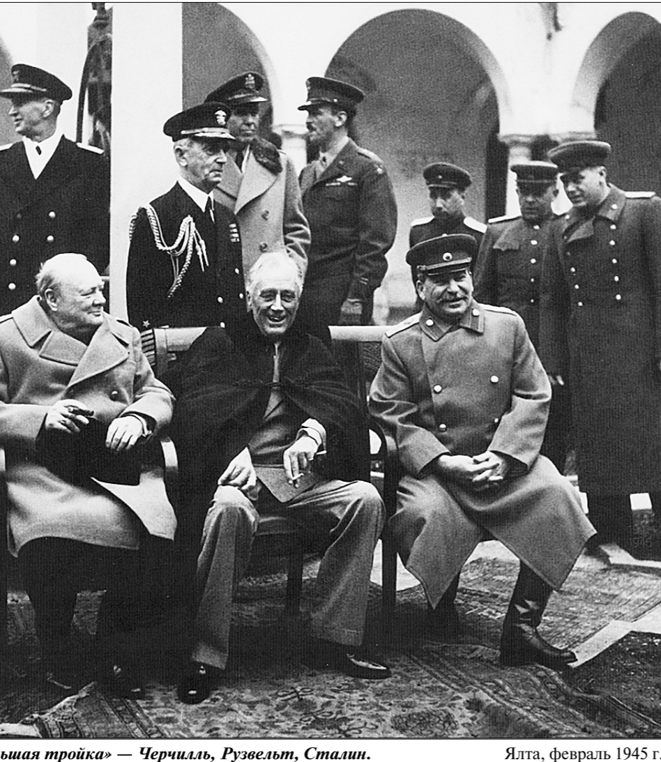
«Большая тройка» — Черчилль, Рузвельт, Сталин. Ялта, февраль 1945 г.

Не всё удалось так, как хотелось бы. Не всё вполне удовлетворяет и самих создателей спектакля. Но главное, что, на мой взгляд, придаёт ему особую значимость, — это всё-таки серьёзный и в основном подход к образу Сталина. Такой подход, в котором видится определённый