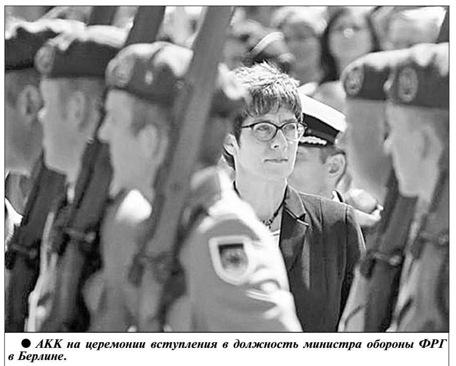
● АКК на церемонии вступления в должность министра обороны ФРГ в Берлине.

«Дойче велле», комментируя этот поворот в поведении главы ХДС, подчёркивает, что тот, кто хочет стать кандидатом на пост канцлера, должен себя проявить не только на партийной работе. Этого недостаточно: в традиционной партии, где доминируют мужчины, невозможно укрепить свой авторитет и заслужить уважение только путём диалога. Нужно взять на себя ответственность и воспользоваться властью.