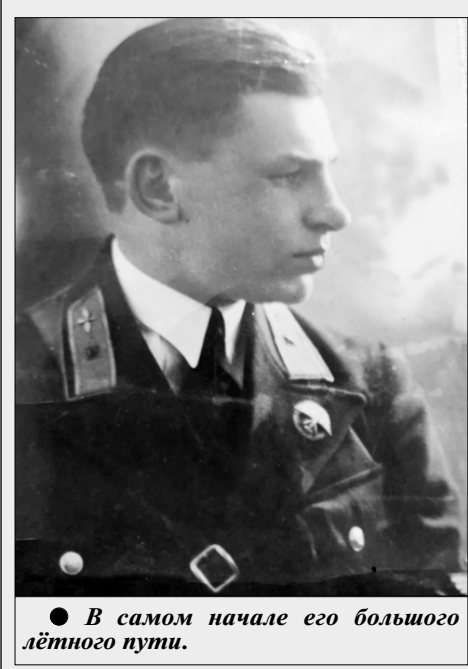
● В самом начале его большого лётного пути.

Высоты, высоты, высоты... Небесные, боевые, командирские и жизненные.