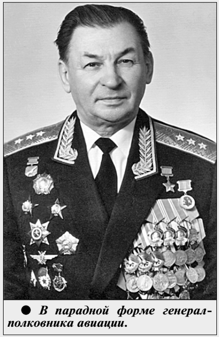
● В парадной форме генерал-полковника авиации.

В пределах этого векового отрезка бурного времени он стал поистине легендарной личностью советской эпохи. Его жизненный путь можно разделить на несколько периодов: покориение неба, участие в Великой Отечественной войне, деятельность по укреплению обороноспособности страны во время «холодной войны» и неугомонные, полные дел и забот пенсионные годы. И в каждом периоде были свои высоты.