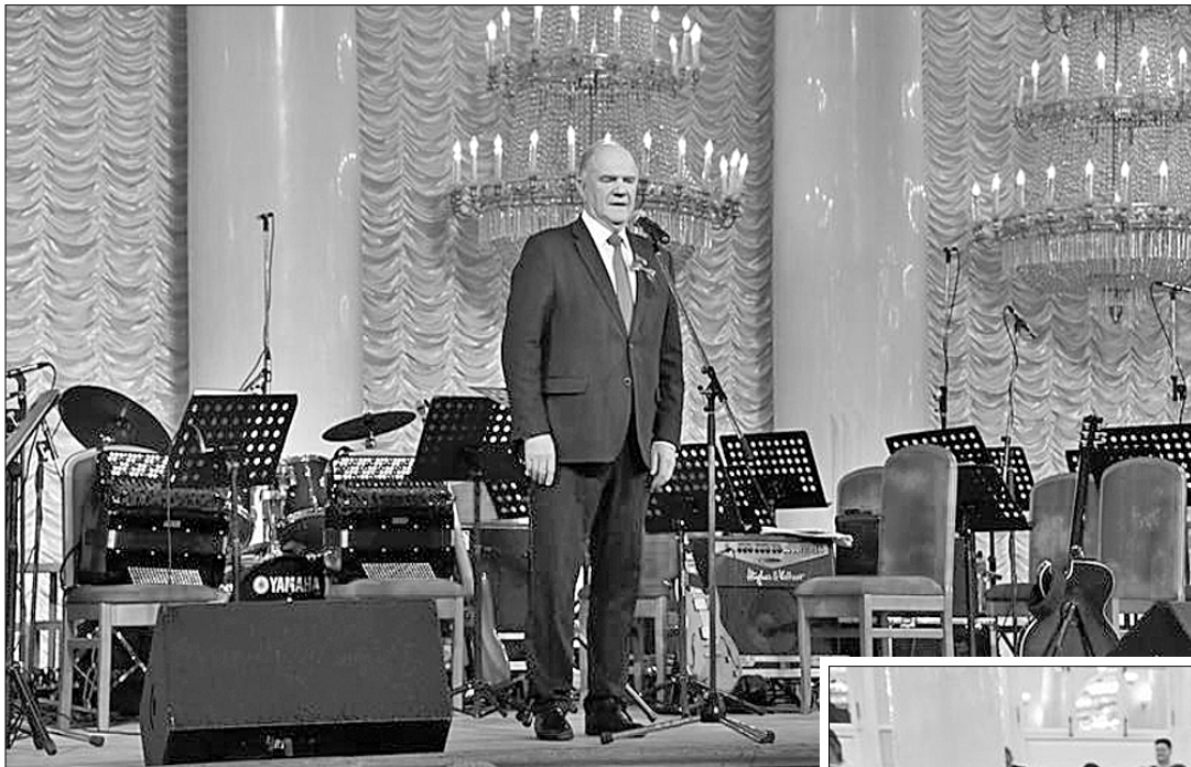
20 декабря в Москве, в Колонном зале Дома союзов, состоялся торжественный вечер «Полководцы Победы», посвященный 140-летию со дня рождения И.В. Сталина и 75-летию Победы советского народа в Великой Отечественной войне. Открыл вечер Председатель ЦК КПРФ, руководитель фракции КПРФ в Государственной думе Г.А. Зюганов.

«УВАЖАЕМЫЕ ТОВАРИЩИ. Мои друзья, — обратился к зрителям лидер КПРФ. — Сегодня в этом величественном зале мы проводим вечер, посвященный полководцам Победы. Проводим его в честь 140-летия со дня рождения товарища Сталина. Я приветствую и поздравляю вас с этой славной датой». «Хочу напомнить, что накануне Великой Отечественной войны партия большевиков одержала ещё три выдающиеся победы. Прежде всего победу в объединении нашей тысячелетней державы. Российскую империю спалили в Первой мировой войне. Ленин и Сталин предложили на съезде собраться и проголосовать за то, чтобы объединиться в рамках Союза Советских Социалистических Республик. Тогда в центре были не национализм, не имперские амбиции, а человек труда, справедливости и дружбы народов. Прекрасное образование и великодушная наука стали торжествовать в нашей державе», — отметил Геннадий Андреевич. «Ленин и Сталин реализовали за пять лет четыре варианта