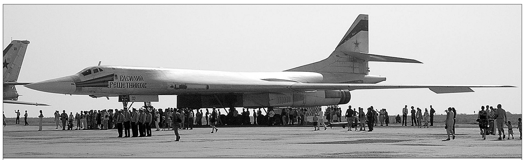
● Вот он, современный боевой воздушный корабль «Василий Решетников».