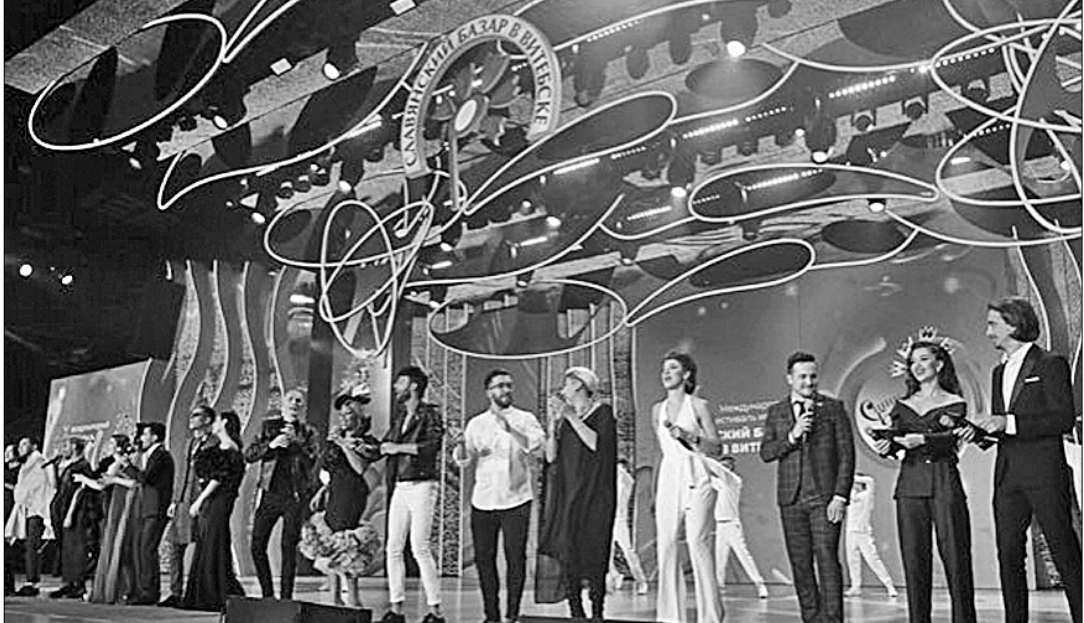
Представителей более чем сорока стран собрал нынешний, XXVII Международный фестиваль искусств «Славянский базар в Витебске». Кроме ближайших соседей, в город на Двине приехали гости из Северной Кореи, Кубы, Колумбии, Египта, Гвинеи, Канады и Великобритании.

● АБУ-ДАБИ. Правительство Объединённых Арабских Эмиратов (ОАЭ) утвердило Национальный проект по экотуризму, призванный привлечь внимание путешественников к достопримечательностям своей страны. Министерство по изменению климата и окружающей среде в рамках данного проекта намерено организовывать туры поездки в заповедники. В ходе поездок туристам удастся посетить 43 природных заповедника, расположенных в пустынных и прибрежных областях ОАЭ. (По сообщениям информагентств).