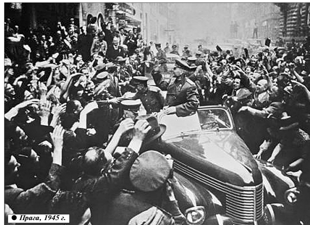
● Прага, 1945 г.