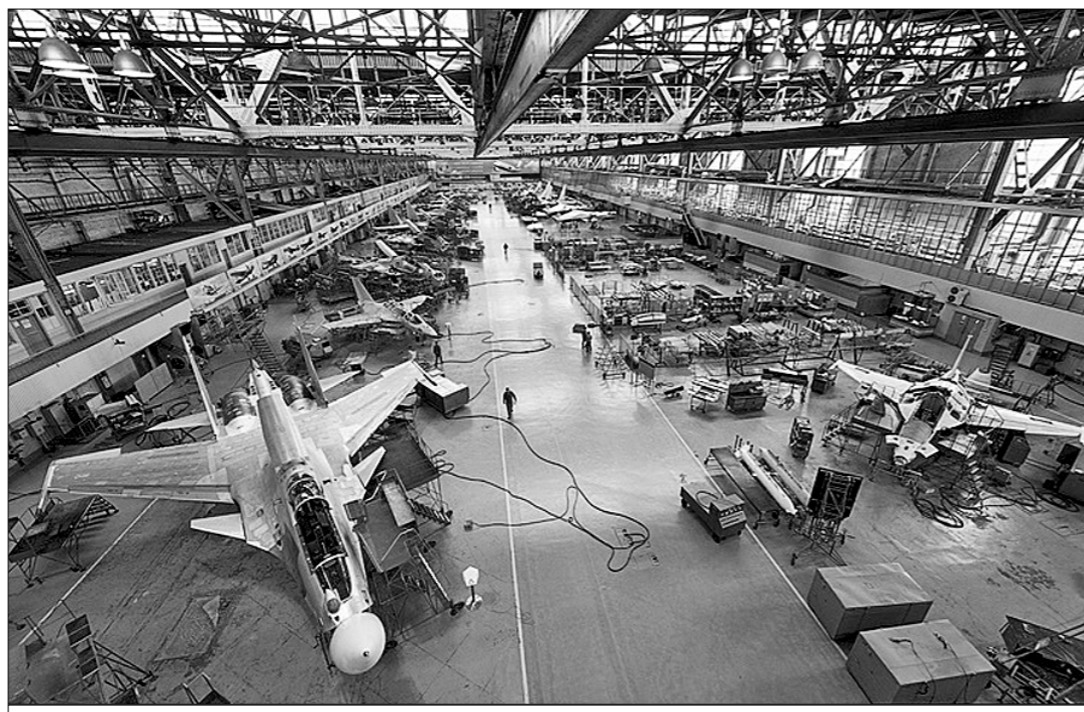
● За время своего существования Иркутский авиационный завод выпустил более 7000 самолетов 20 типов. География поставок ИАЗа охватывает 37 стран мира.

тет в экономике — это рост промышленного производства и реализации политики реального импортозамещения. Чтобы достичь этих целей, задействуются механизмы государственного стратегического планирования. В стимулировании развития производственных сил на территории Иркутской области государство играет ключевую роль: