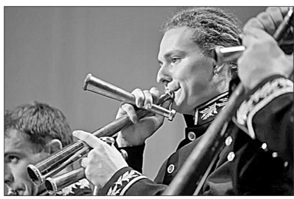
Или над невисскими брегами Я тешусь по ночам рогом И греблей удалых гребцов...