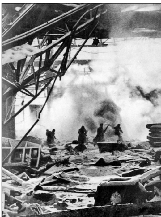
Один из эпизодов боёв на металлургическом заводе «Красный Октябрь».

Победа советских войск над немецко-фашистскими войсками под Сталинградом — одна из наиболее славных страниц летописи Великой Отечественной войны. С 17 июля 1942 года до 2 февраля 1943 года продолжалась Сталинградская битва.