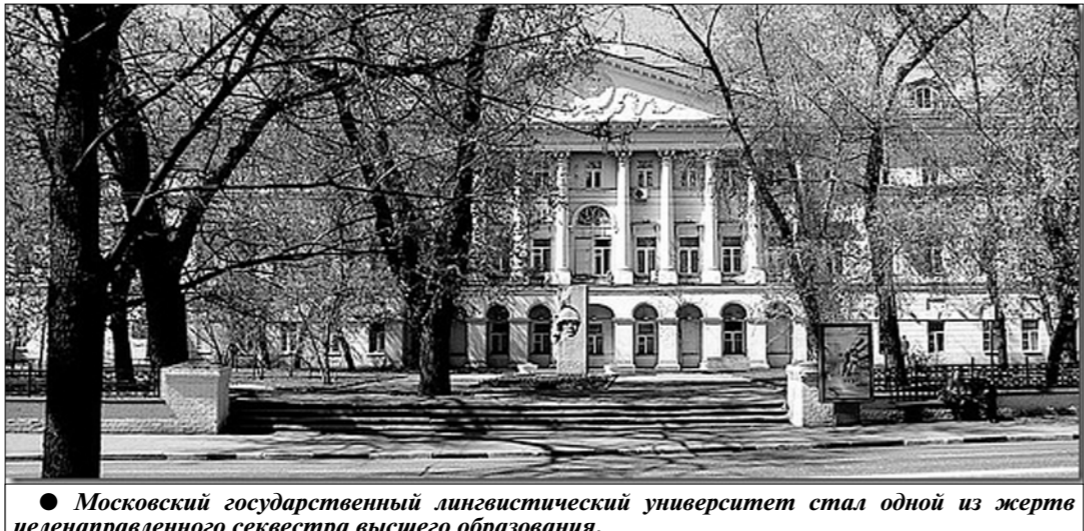
Московский государственный лингвистический университет стал одной из жертв целенаправленного секвестра высшего образования.