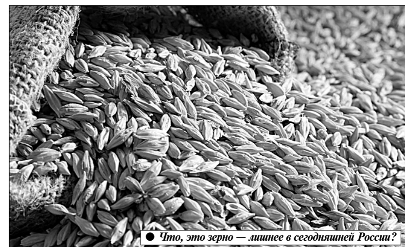
● Что, это зерно — лишнее в сегодняшней России?

Естественно, по цене, в несколько раз превышающей ту, за которую мы сырьё продали. Всё, как в царской России. Хорошо же примеры «рачительного хозяйствования», нечего сказать! Но так ведь и непосредственно с зерном сегодня складывается похожая картина. Во-первых, ситуация с географией экспорта российского зерна толь-в-толь напоминает ту, что была в России дореволюционной. Так, по данным минсельхоза, главными покупателями российской пшеницы в 2015 году стали Египет, Турция, Иран, ряд африканских государств. Так что надуть шёлки и говорить, что мы-де «кормим развитой Запад», ну никак не получается. А вот сходство посерьёзнее. По данным Росстата зернового союза, урожай в минувшем году составил 104 миллиона тонн зерна. Это — уместно напомнить — по-прежнему не дотягивает до лучших урожаев, собиравшихся в советское время в РСФСР. Тем не менее, по тем же данным, на середину февраля нынешнего года Россия вывезла за границу больше 23 миллионов тонн зерна, в том числе пшеницы — 18,6 миллиона тонн. Нет сомнения, что эти цифры также будут фигурировать в пропагандистских материалах партии «медведи» как показатели «успехов» их руководства страной. Но можно ли этим гордиться?