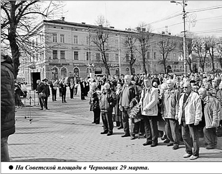
● На Советской площади в Черновцах 29 марта.

25 марта стало знаменательным днем для жителей Хмельницкого. Именно в