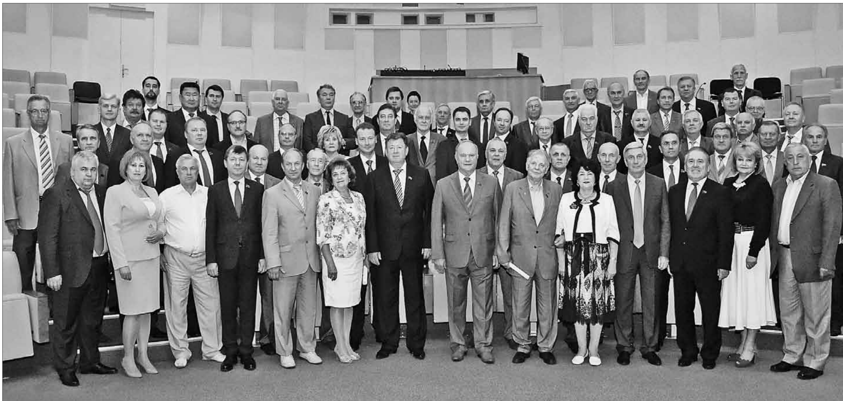
● Фракция КПРФ в Государственной думе Российской Федерации шестого созыва. Июнь 2015 года.

Отчёт о работе фракции КПРФ в Государственной думе Российской Федерации в весеннюю сессию 2015 года