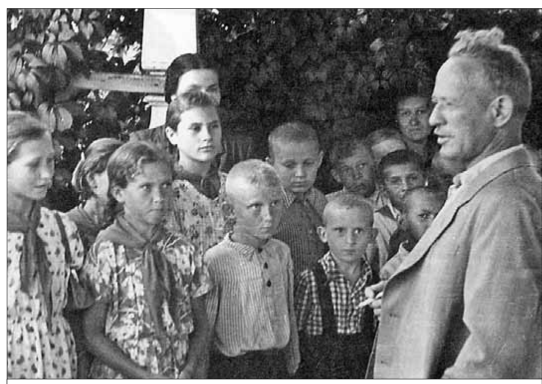
● М.А. Шолохов с детьми из города Серфимовича.