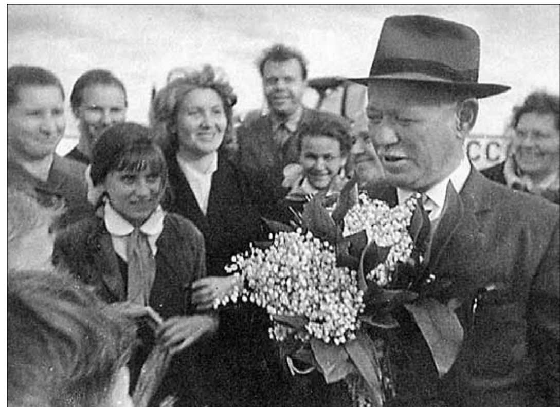
● М.А. Шолохову — 50 лет.