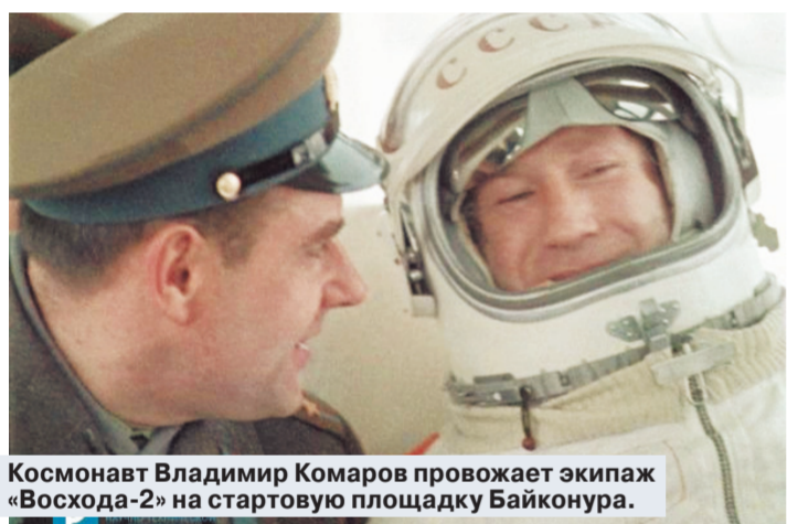
Космонавт Владимир Комаров провожает экипаж «Восхода-2» на стартовую площадку Байконура.