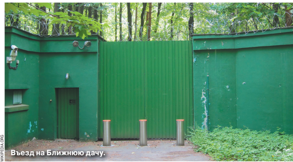
Въезд на Ближнюю дачу.