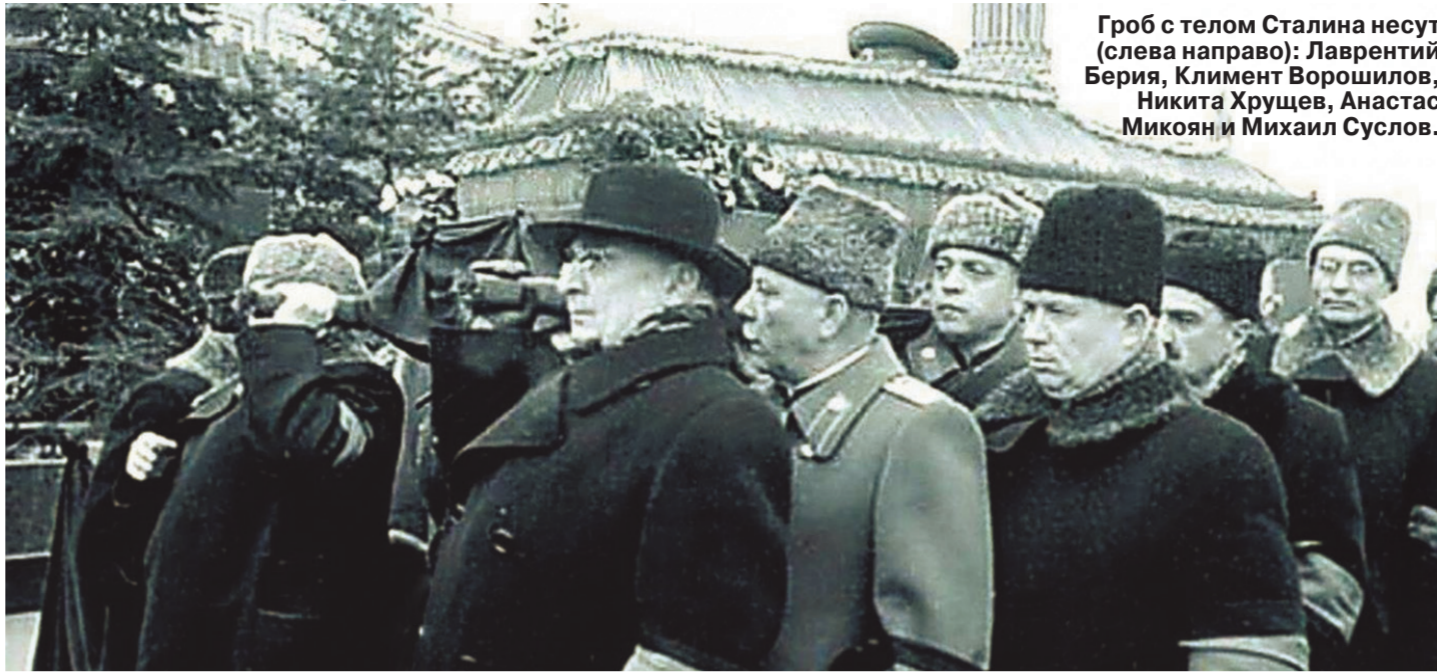
Гроб с телом Сталина несут (слева направо): Лаврентий Берия, Никита Хрущев, Анастас Микоян и Михаил Суслев.

«Его нет, но его тень продолжает стоять над всеми нами, и еще очень часто продолжает диктовать нам, и еще очень часто мы действуем по ее указу...» Эти строки, написанные дочерью Сталина через 10 лет после его смерти, ничуть не устарели. Его нет вот уже 70 лет, но его тень по-прежнему стоит над всеми нами. И как кажется многим, подобно тене отца Гамлета, указывает на то, что официальная версия кончины, говоря словами Шекспира, — «поддельная басня».