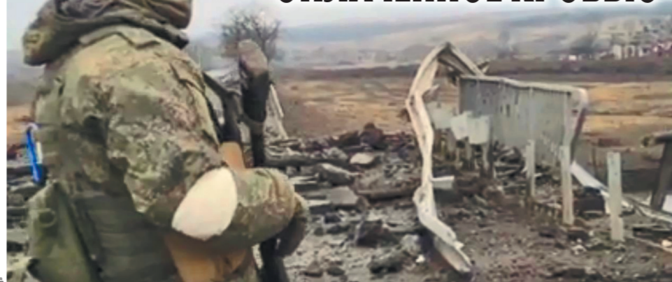
ВСУ при отступлении уничтожают мосты.