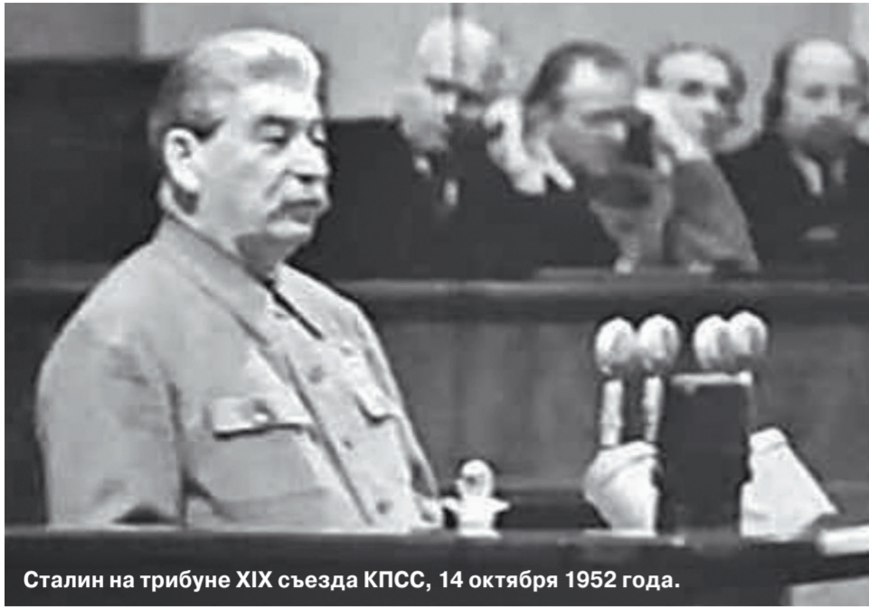
Сталин на трибуне XIX съезда КПСС, 14 октября 1952 года.