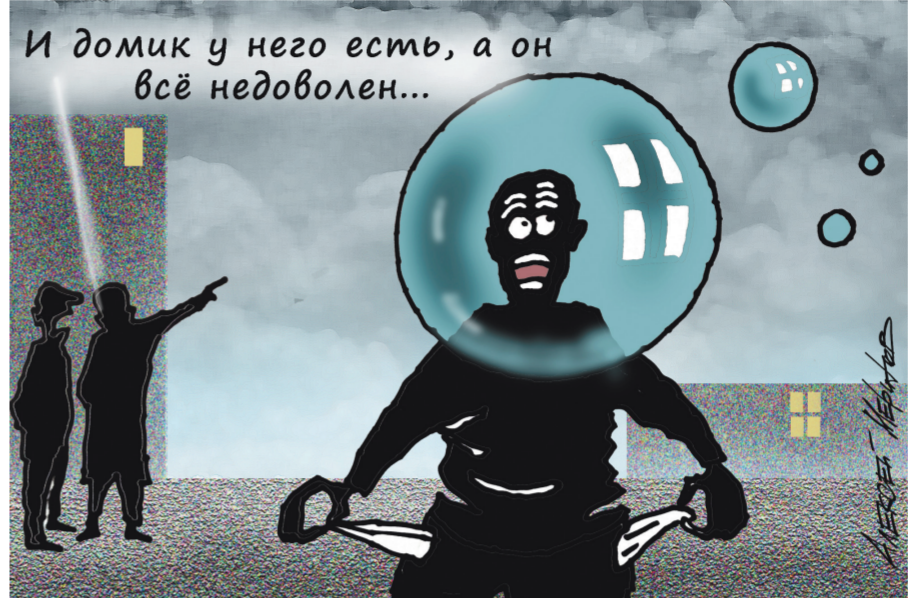
И домик у него есть, а он всё недоволен...