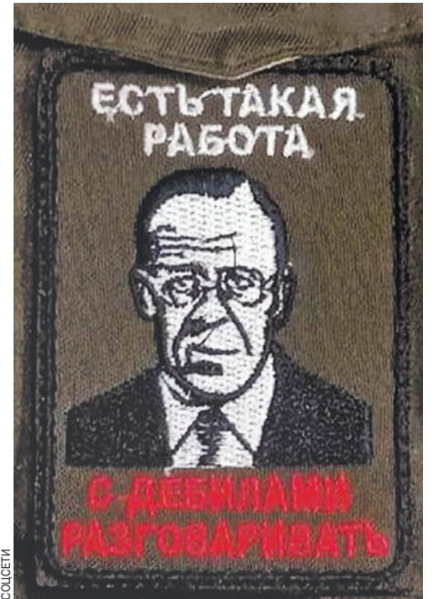
ЕСТЬ ТАКАЯ РАБОТА