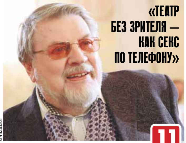
Александр Ширвиндт: о чем думается в коронавирусном заточении