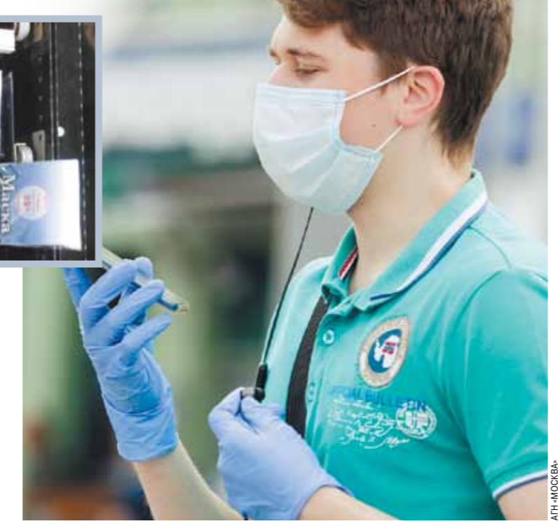
Читайте 12-ю стр.

И все-таки: начал заканчиваться режим самоизоляции или нет? С одной стороны, вечером 11 мая, после выступления президента Владимира Путина, многие — особенно молодежь — решились выскочить на улицы и даже пытались штурмовать парки. С другой стороны, последнее слово главы государства оставил за руководителями регионов, а мэр Москвы Сергей Собянин продлил режим повышенной готовности до 31 мая. Наверняка можно утверждать только то, что с 12 мая в столице введен масочный режим.