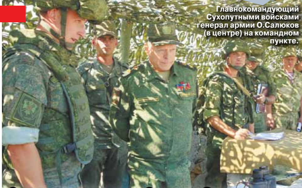
Главнокомандующий Сухопутными войсками генерал армии О. Салюков (в центре) на командном пункте.