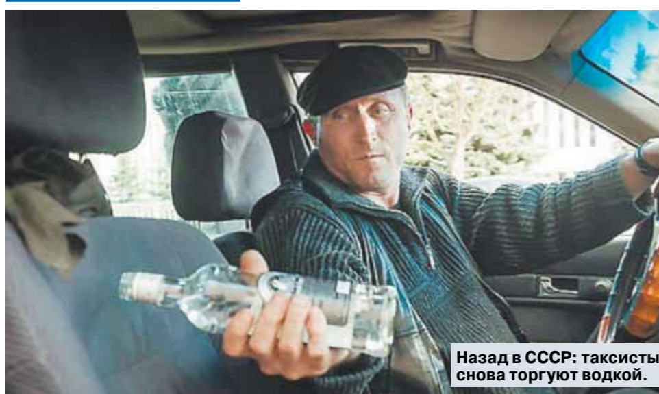
Назад в СССР: таксисты снова торгуют водкой.