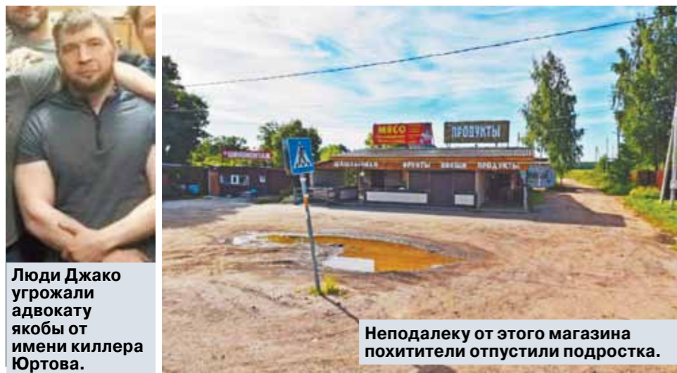
Люди Джакко угрожали адвокату якобы от имени киллера Юртова.