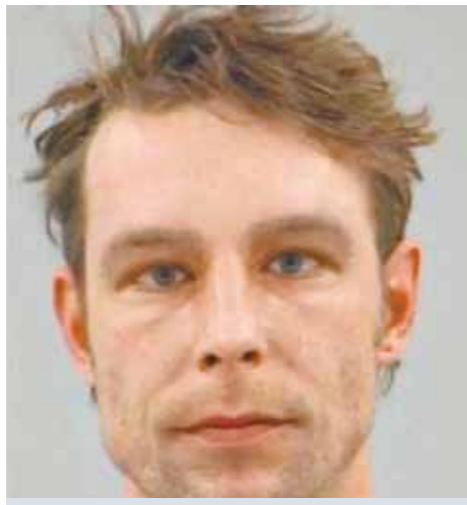
Кристиан Брюкнер может быть причастен к серии исчезновений детей.

В 1994 году за свои действия Брюкнер, бросивший учебу в школе, чтобы обучаться профессии автомеханика, был арестован.