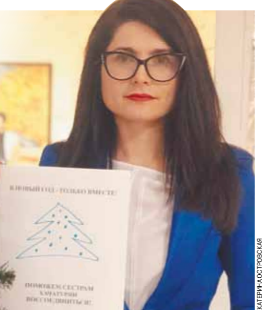
Наш мини-пикет в поддержку сестер Хачатурян.