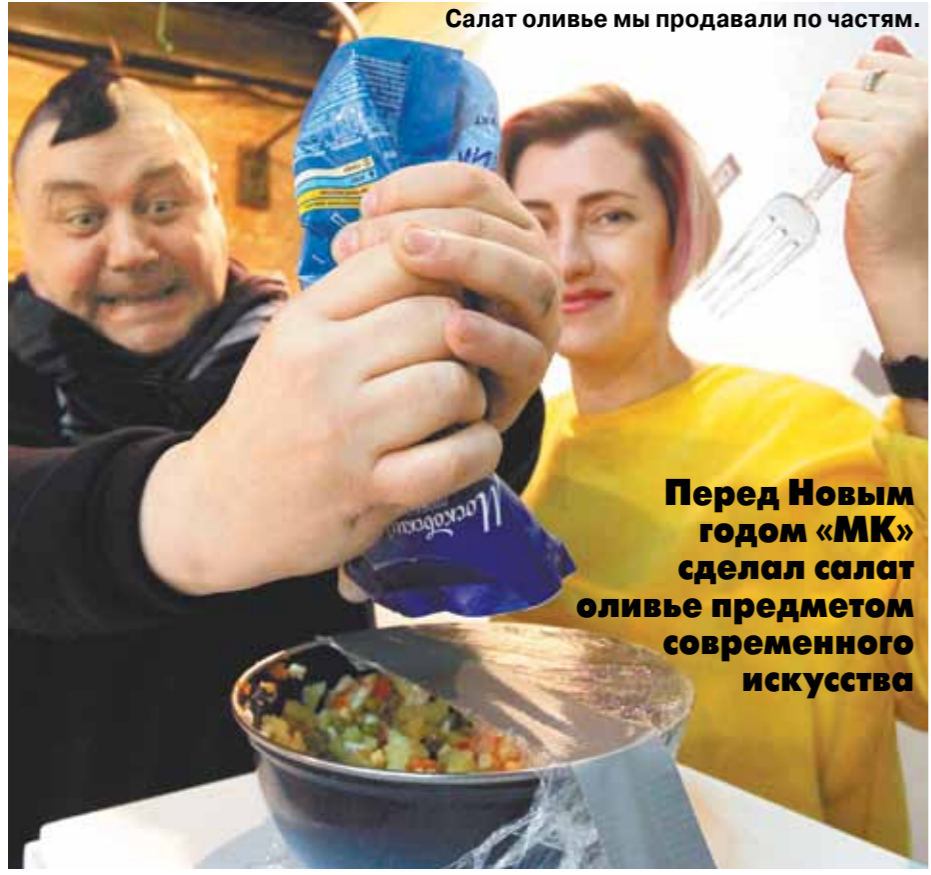
Салат оливье мы продавали по частям.

Перед Новым годом «МК» сделал салат оливье предметом современного искусства