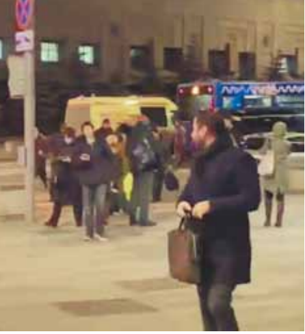
КАДР ИЗ ВИДЕО