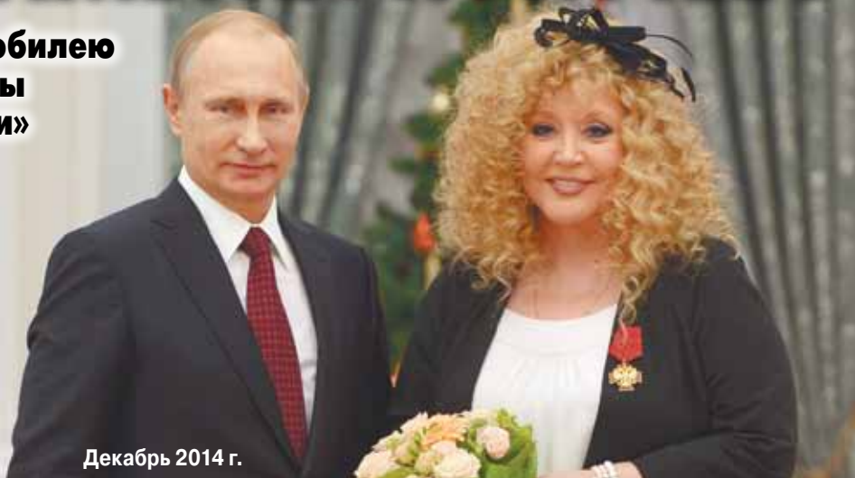
Декабрь 2014 г.

Награду к юбилею Примадонны «проглядели»