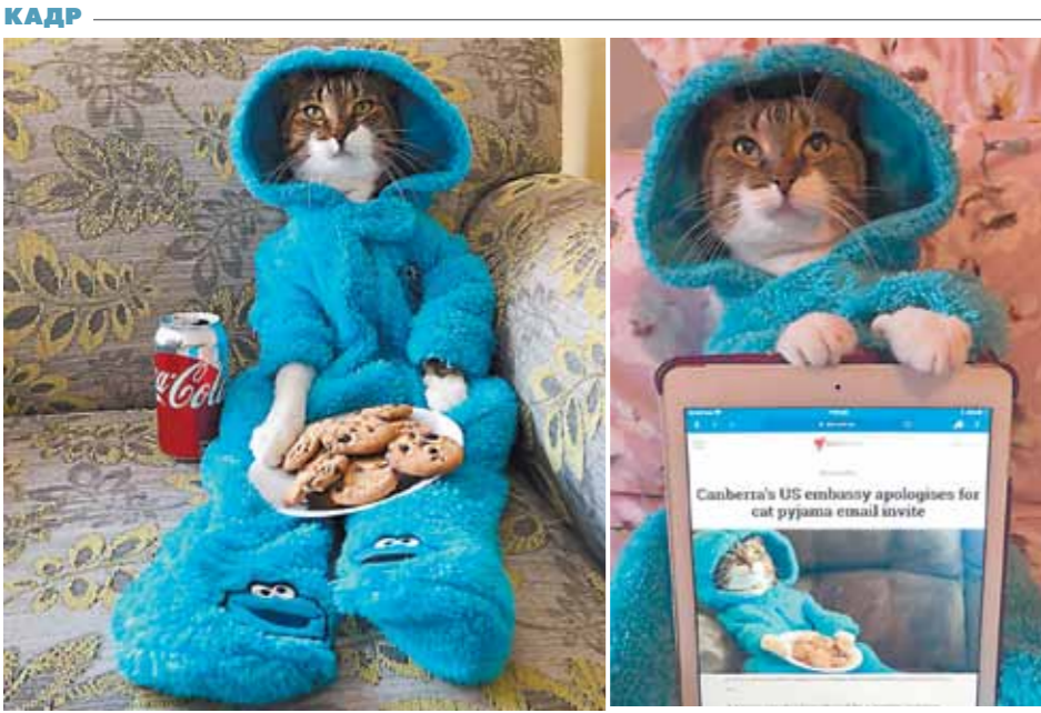
ИНСТАГРАМ: СОВЕТСКИЙ БИВЕР