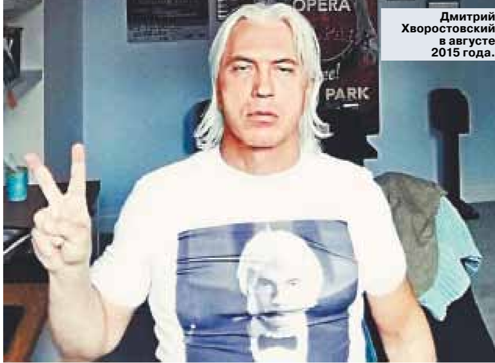
Дмитрий Хворостовский в августе 2015 года.