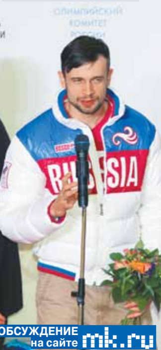
Федерация бобслея России уже заявила, что уверена в чистоте своих спортсменов и будет добиваться справедливости вплоть до гражданских судов.