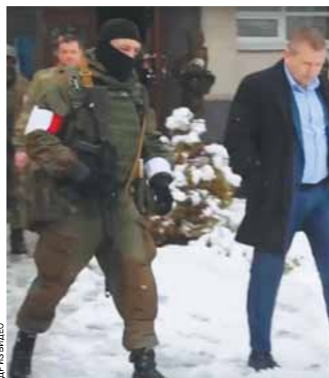
...люди главы МВД Корнета арестовали руководство прокуратуры республики.

В ночь со вторника на среду в Сети появилось видео, где в сторону Луганска направляется автоколонна бронетехники с вооруженными людьми, которые якобы выехали из ДНР в ЛНР для наведения правопорядка. В связи с этим некоторые российские политики даже заявили о возможном объединении двух самопровозглашенных республик. Впрочем, источник «МК», близкий к руководству ДНР и ЛНР, утверждает, что такая возможность даже не рассматривается. Более того, представитель Минобороны ДНР Эдуард Басурин заявил «МК», что донецкая военная техника «находится на своих местах», а в ЛНР сейчас, в отличие от 2016 года, не происходит ничего, в чем могла бы понадобиться помощь Донецка. Правда, члены наблюдательной миссии ОБСЕ на Донбассе выложили фотографии, подтверждающие передвижение бронетехники из Дебальцева в Луганск. Но в Дебальцево находится техника как ДНР, так и ЛНР. Возможно, в связи с ситуацией в столице с передовых позиций танки просто перевели в город.