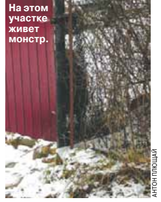
На этом участке живет монстр.

— Сейчас муж находится в Боткинской больнице, — едва сдерживая слезы, рассказывает супруга эксплицитного Вереника. — Прогнозов нам никаких не дают, но велика вероятность, что он останется инвалидом. У мужа сильно изношены органы, ноги и область половых органов. Страшно то, что хозяева собаки никак не реагируют на произошедшее! Притом это уже не первый случай. В конце лета пес набросился на одного из рабочих и откусил ему верхнюю часть бедра. Бедному строителю пришлось уехать обратно на Украину лечиться.