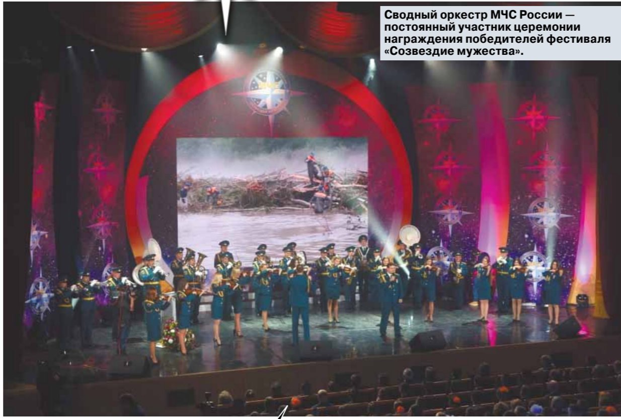
Сводный оркестр МЧС России — постоянный участник церемонии награждения победителей фестиваля «Созвездие мужества».

Более 40 дней спасатели из Тверской области работали в Ульском районе Хабаровского края. В сложных погодных условиях он оказывал помощь людям в эвакуации из домов, оказавшихся в зоне подтопления, помогал пострадавшим перенести мебель и личные вещи, перевозил людей и животных через подтопленные участки дорог, участвовал в мероприятиях по возведению временных дамб и береговых укреплений. Во время патрулирования в поселке Калиновка Ульского района лично спас человека,