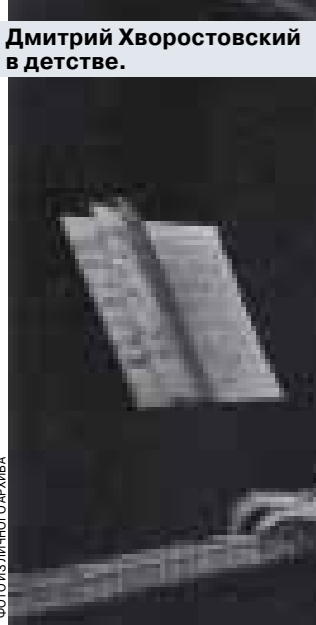
Дмитрий Хворостовский в детстве.