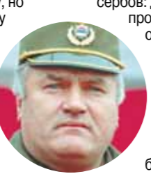
прокурора МТБЮ Карлы дель Понте «Охота: я и военные преступники», в которой рассказано о похищении и транспортировке в 1999-м в Албанию 300 косовских сербов: для изъятия и продажи человеческих органов. Россия обратилась в МТБЮ с запросом о наличии и трибунала данных о преступлениях против косовских сербов. В 2010-м был опубликован доклад спецподразделения ПАСЕ Дика Марти о «черной трансплантологии» в Косово. Но международное расследование этих фактов не было начато.

лет, Младич перенес два инсульта и инфаркт. Адвокаты неоднократно ссылались на плохое состояние здоровья подсудимого и просили судей не приговаривать его к пожизненному сроку, но трибунал им навстречу не пошел. Почти две трети обвиняемых МТБЮ — сербы. Сроки заключения для них, как правило, от 30 лет до пожизненного. Среди хорватов и боснийцев наиболее наказание — 24 года и 25 лет. В 2008 году вышла книга экс-