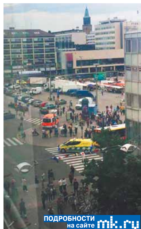
ПОДРОБНОСТИ на сайте mk.ru

В пятницу днем из города Турку (Финляндия) на фоне известий о барселонском теракте пришли тревожные вести: по данным СМИ, совершены нападения с холодным оружием. Случайным прохожим наносили ножовые удары. Как стало известно ко времени подписания номера «МК», в результате несколько человек получили ранения. Свидетели заявляли, что среди пострадавших были женщина и ребенок. Сообщается, что полицейским удалось ранить в ногу одного нападавшего. По некоторым сведениям, он мог быть одним из группы нападавших. Полиция обратилась с призывом к людям избегать посещения центра города.