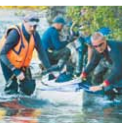
ПРОХОДИМОМУ РУЧЬЮ, а потом совершить волок через перевал Орлиный, где давным-давно никто не ходил, в бассейн реки Аниак.

Малаховым преодолела труднейший водный путь, пытаясь на собственном опыте понять, как в старину наши предки умудрялись в этих диких краях не только перемещаться сами, но и транспортировать партии грузов. Члены экспедиции смогли со снаряжением и байдарками сперва подняться вверх по практически не-