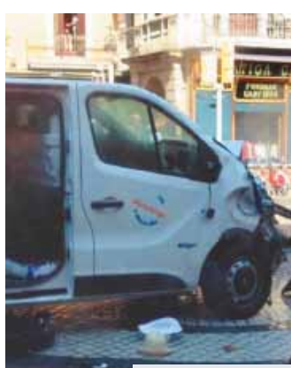
Автомобиль — орудие теракта.

террористов что понаехавшие туристы, что коренные барселонцы — все равно. Для них и те, и другие — это только мишень.