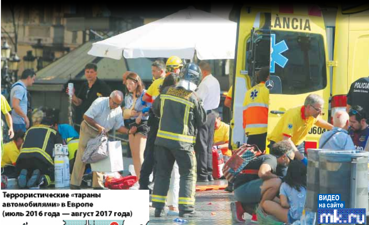
Террористические «тараны автомобилями» в Европе (июль 2016 года — август 2017 года)

Почему Испания стала мишенью террористов