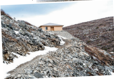
Курорт на острове Завьялова - очень перспективный проект.

бы, чтобы такие инициативы были успешными. Этот пример послужит стимулом, чтобы в туризм вкладывались и другие инвесторы, - сказал Юрий Трутнев.