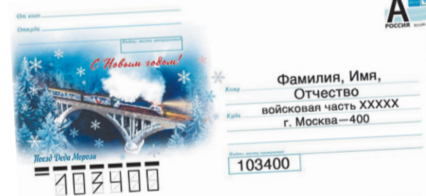
Как правильно подписывать конверт.

- Писать личное письмо бойцу проще от руки, а не печатать в телефоне. Да и другой связи с родными у военнослужащих нет. Близкие люди обязательно напишут в ответ. И чем длиннее будет письмо из дома, тем спокойней бойцу, - прокомментировали в пресс-службе ВВО.