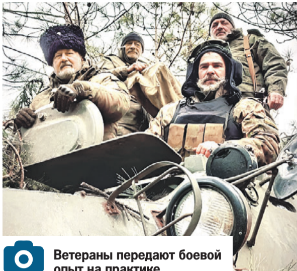
Ветераны передают боевой опыт на практике.

- Претерпели изменение и дополняются в основном пункты Стратегии, связанные с несением казаками государственной и иной службы и патриотическим воспитанием под-