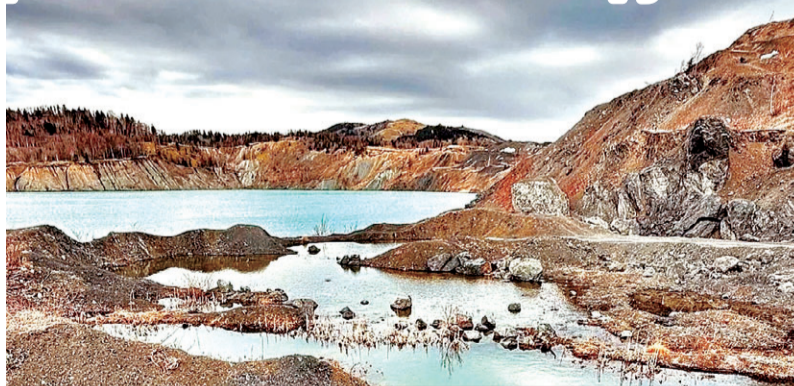
Бирюзовое озеро стоит того, чтобы идти до него пешком восемь километров.

- Снимите видео про свое прохождение маршрута и станьте участником