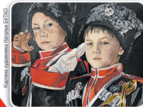
Картина художника Натальи БУТКО