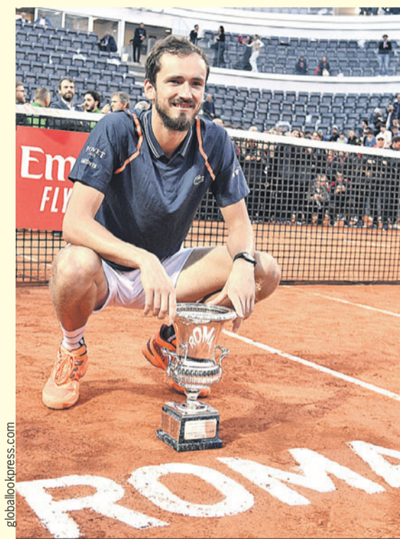
Даниил Медведев выиграл 20-й титул в карьере и заработал в Риме 1,1 млн евро.

28 мая стартует «Ролан Гаррос». Король грунтовых кортов 36-летний Рафаэль Надаль из-за травмы снялся со своего любимого турнира, где он победил 14 раз (!), а значит, трон свободен. Учитывая, что Медведев наконец-то заиграл на грунте, у него есть хорошие шансы повторить свой римский успех в Париже.