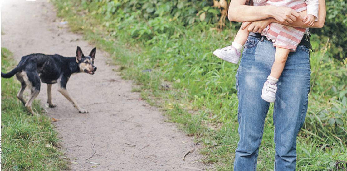
Собачий вопрос делает существование некоторых людей невыносимым. А иногда становится вопросом жизни и смерти.

потому что один человек может ошибаться.