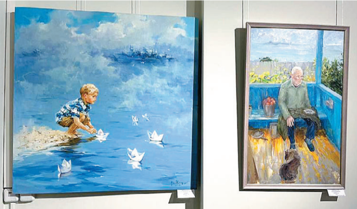
Мероприятие поддержало Приморское отделение Союза художников.

ние Союза художников России, разумеется, поддержали столь благородную и важную иници-