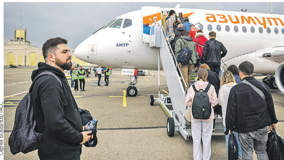
Пассажиры самолета Super Jet 100-95B «Амур» российской компании «Азимут» в Москве не ждали, что в аэропорту Тбилиси не все будут им рады.

- Эти люди относятся к деструктивной части оппозиции, - считает грузинский аналитик Васо Капанадзе. - Ими руководит член парламента Елена Хоштария. Они, как и президент, под диктатом Запада. Но основное большинство правительства и людей приветствует и прямые рейсы, и безвиз.