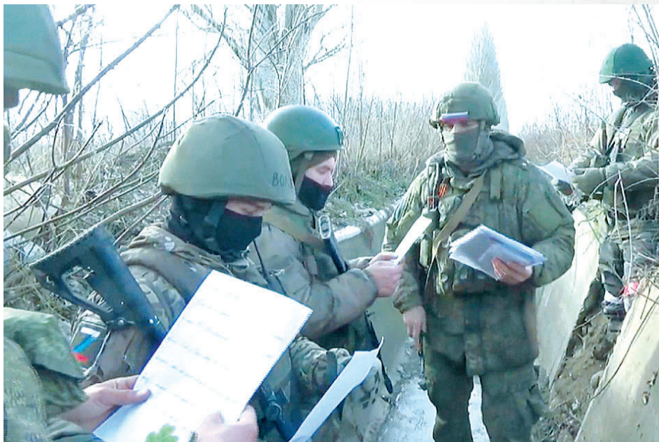
Бойцы читают послания сразу и делятся друг с другом самыми трогательными строчками.

Дальше отправления сдаются в обменные пункты ФПС группировок