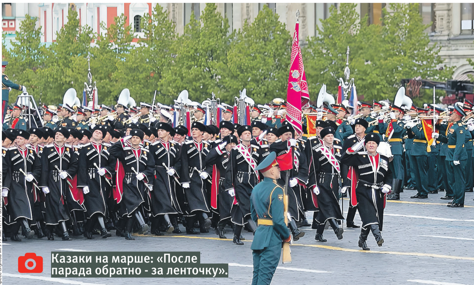
Пресс-служба МПГУ им. К. Г. Разумовского (ПКС)

По решению президента страны, Верховного главнокомандующего, на главной трибуне парада находились 54 казака-добровольца, удостоенные государственных наград.