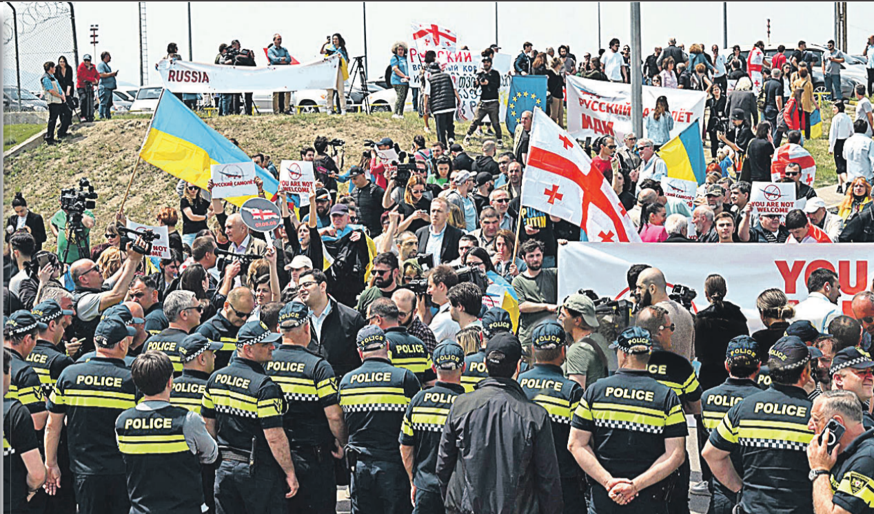
Не более 200 - 300 человек с флагами Грузии, Украины и антироссийскими лозунгами добрались пешком из Тбилиси до аэропорта, в здание которого их не пустила полиция.

Как Грузия встретила первый после 4-летнего перерыва самолет из России. Спецкор «КП» с трудом просочилась в аэропорт Тбилиси, где порадовалась спокойствию полицейских, порадовалась за пассажиров и нарвалась на хамство местных журналистов.