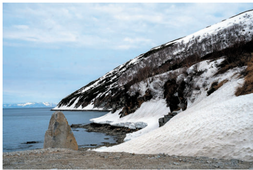
Телеграмканал Сергея НОСОВА