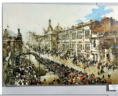
Работы посвящены борьбе с фашизмом и Сталинградской битве.

Организаторами стали администрация Владивостока, правительство Приморья, общественная организация «Сильная Россия» и советы почетных жителей столицы Приморья и края. - А мы, Приморское отделение