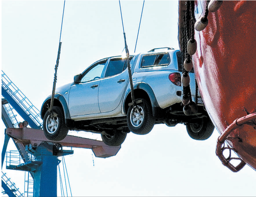
Дальневосточник без подержанной иномарки как без рук.

Мы спросили продавцов о том, какие машины сейчас в почете у дальневосточника со средним бюджетом. Публикуем срез цен на популярные модели на б/у рынке.