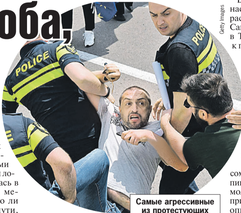
Самые агрессивные из протестующих до аэропорта им. Руставели не добрались.

Те, кто приветствует изменения, тоже были в аэропорту. Но вели себя тихо. А вот противники устроили шоу: хотя автоколонна не доехала, но пешеходы, завернувшие в украинские и грузинские флаги, с транспарантами и свистками прибыли аккурат к посадке самолета. Полиция эту группу человека в 200 остановила. Но свист и антирос-