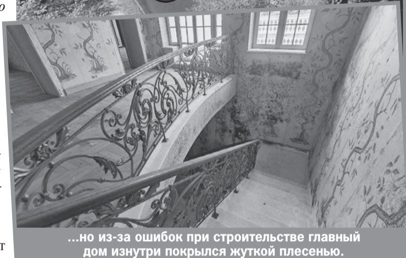
...но из-за ошибок при строительстве главный дом изнутри покрылся жуткой плесенью.

можно пройти к участку. Там, правда, упираешься в глухой пятиметровый каменный забор, обвешанный камерами. Перед тобой ворота и стоящий окнами на улицу дом прислуги (400 квадратных метров + гараж на четыре машины).