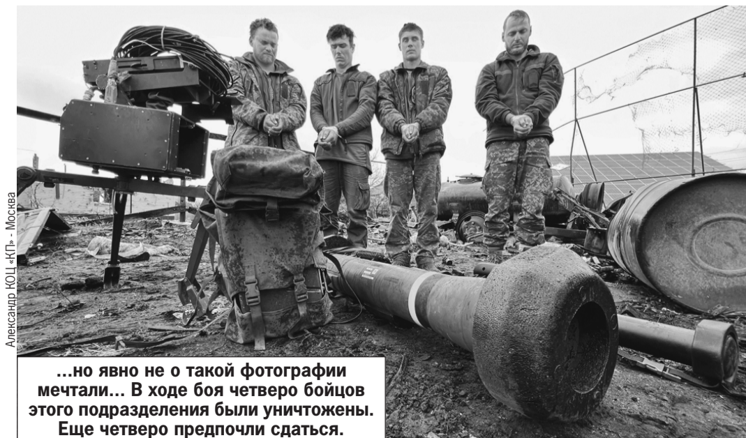
...но явно не о такой фотографии мечтали... В ходе боя четверо бойцов этого подразделения были уничтожены. Еще четверо предпочли сдаться.

Репортажи Александра Коца с места события, фото и видео - на сайте