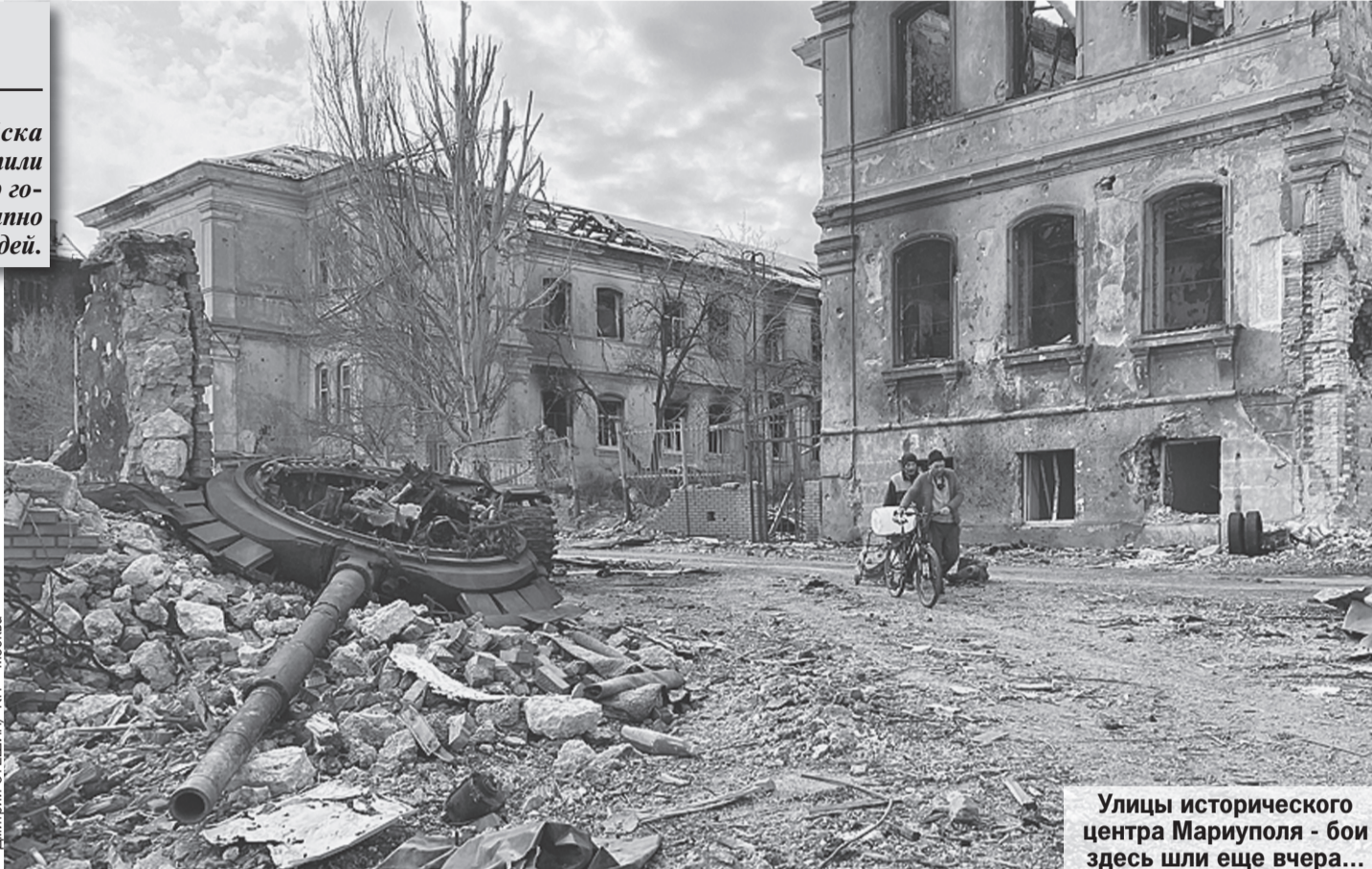
Улицы исторического центра Мариуполя - бои здесь шли еще вчера...

Спрашиваю, что за люди. Татьяна показывает: этот чиновник, тот -