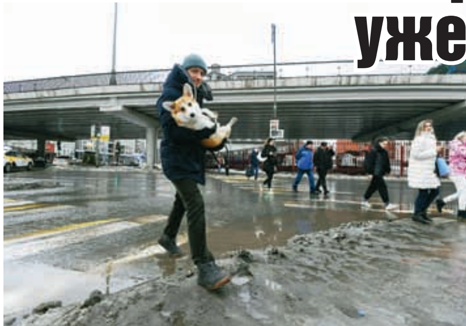
Сильные морозы больше не вернутся в Саратов.