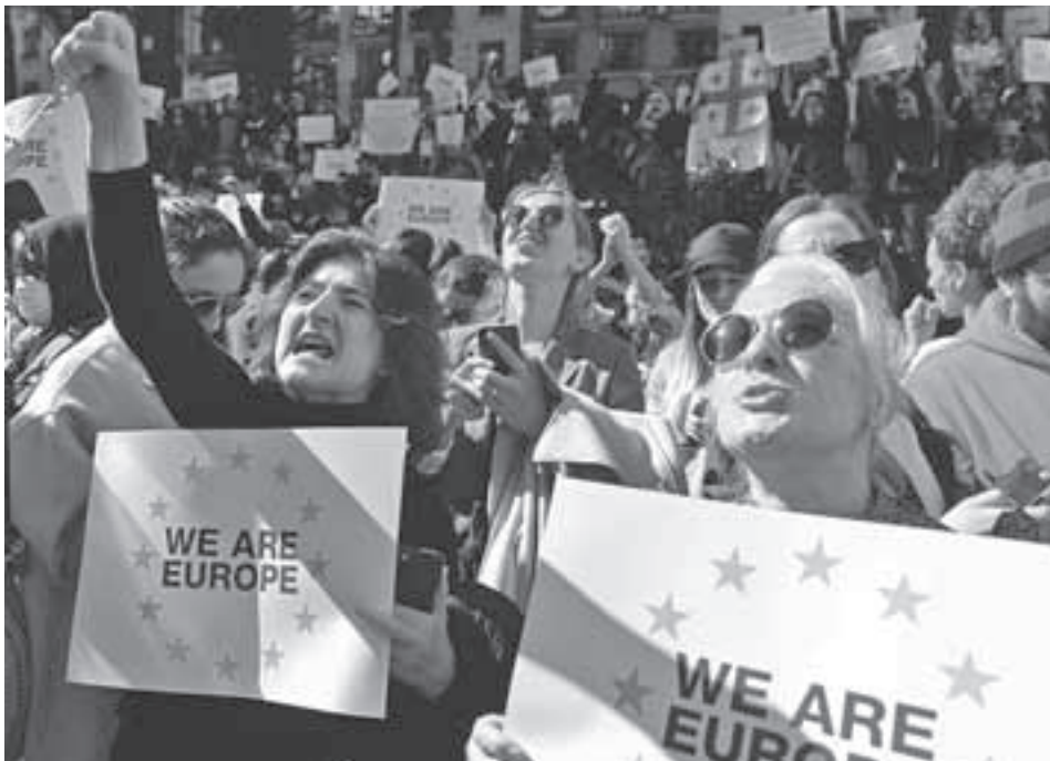
Демонстрантам на грузинском майдане раздали плакатики «Мы - Европа». Помните, на майдане в Киеве были такие же: «Украина - цэ Европа?»

ую линию границы кричит полицейскому про патлатого в очочках: «Это мой муж! Отпустите его! Мы в Гори живем». А муж только вытирал со лба пот.