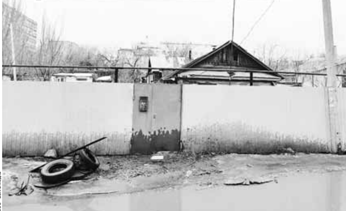
По юридическому адресу никаких признаков «Новой жизни» не оказалось.

Точные мотивы нападения неизвестны. Но Шостак, со слов других подопечных рехаба, утверждает, что у погибшего якобы могла быть связь с девушкой, также оказавшейся в реабилитационном центре.