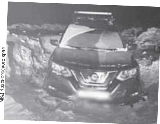
МВД Красноярского края