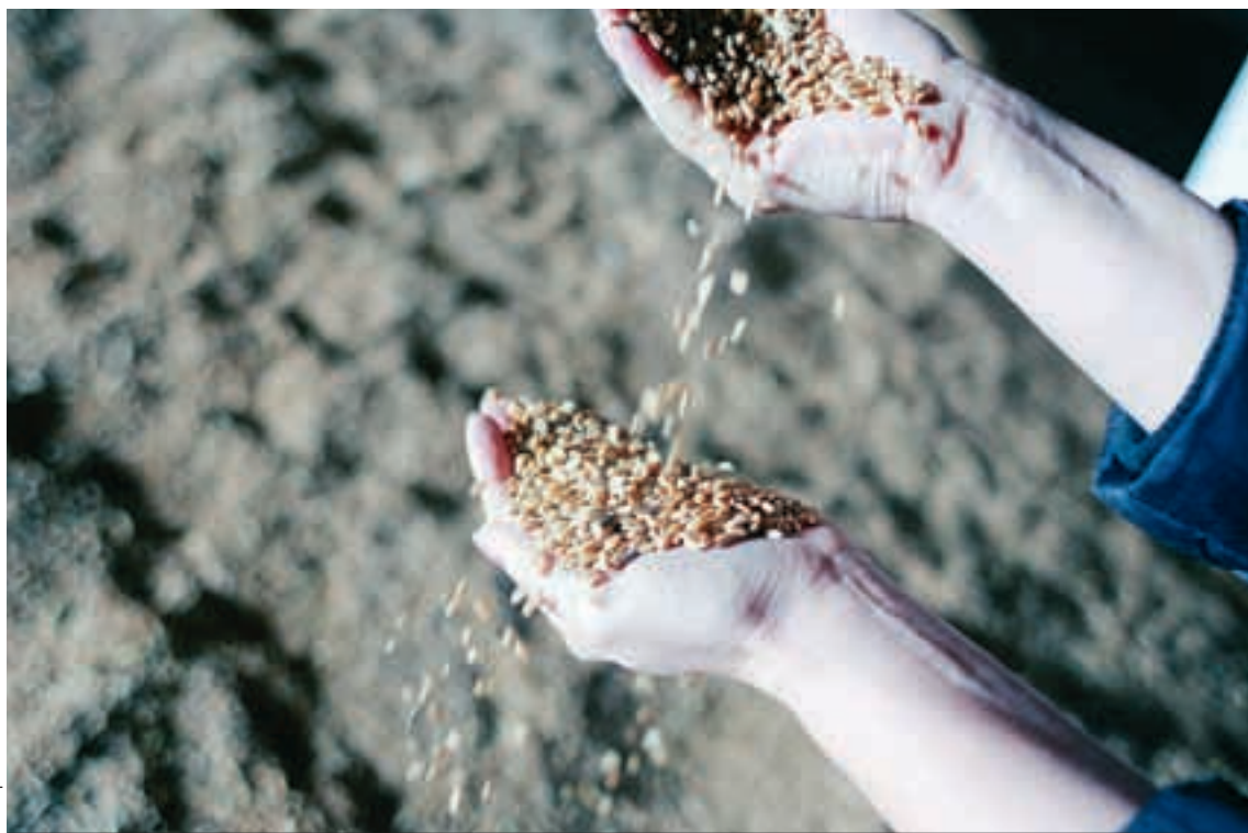
Сертификация дает гарантию качества семян.

Саратовский филиал ФГБУ «ВНИИЗЖ» является аккредитованным органом по сертификации семян и посадочного