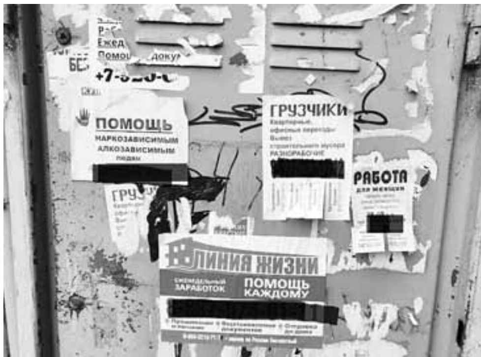
На стенах домов соседствуют рекламы «магазинов» запрещенных веществ и «клиник», которые обещают лечение от зависимостей.

Глава Следственного комитета России Александр Бастрыкин запросил у главы саратовского управления ведомства Анатолия Говорунова доклад по итогам расследования дела.