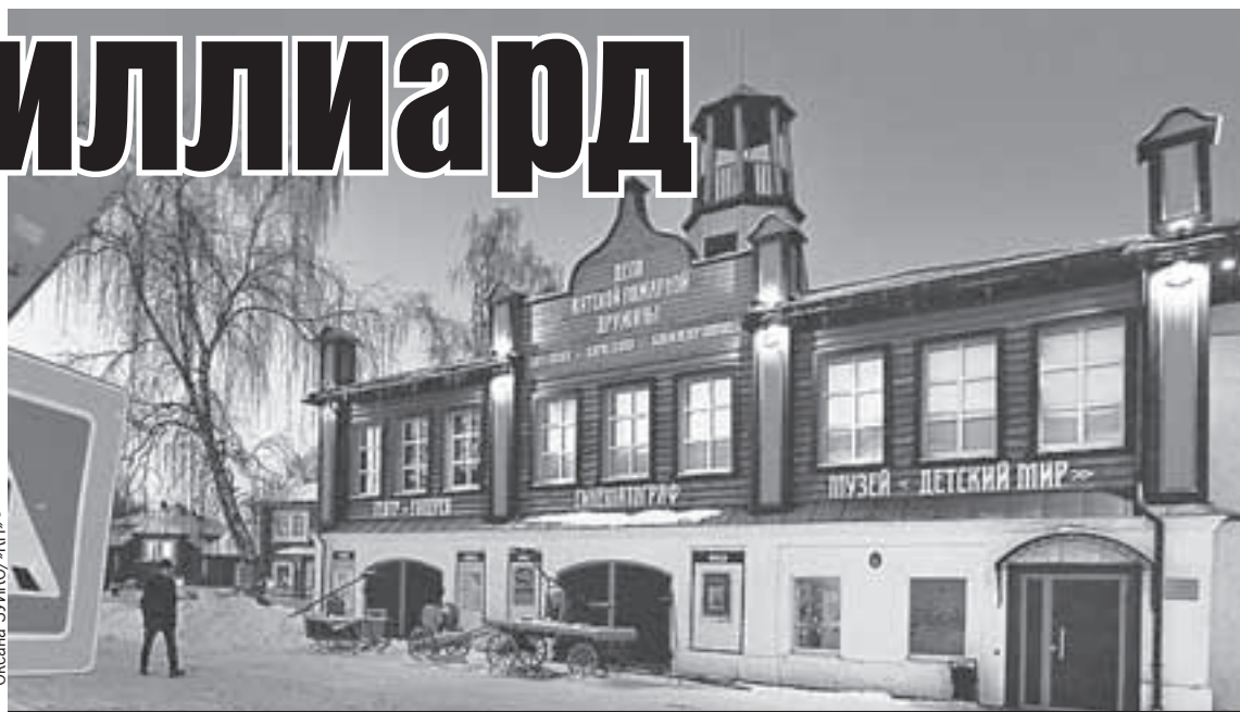
Вятское - изящный уголок старинной России с туристическим уклоном. Вот, например, фасад бывшего здания пожарной части. Сейчас здесь музей и киноконцертный зал.