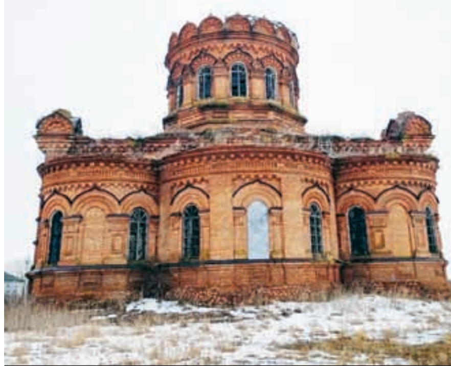
Кто-то видит на жестяном листе Спасителя, другие - Покров Богородицы или образ Николая Чудотворца.

В 1988 году жители Кутьино обратились в Саратовскую епархию с прошением об