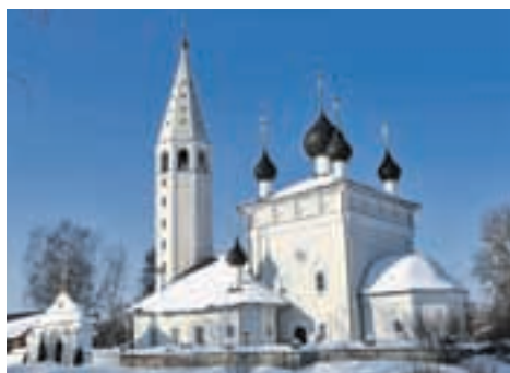
Оксана ЗУЙКО/«КП» - Москва