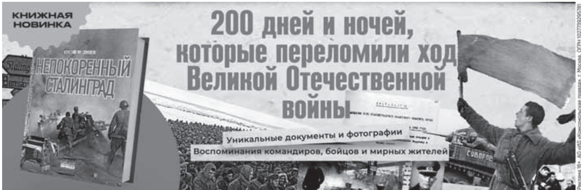
Рисунки И.А.О. ИИД «Комсомольская правда», г. Москва, ОГРН 1027739295781