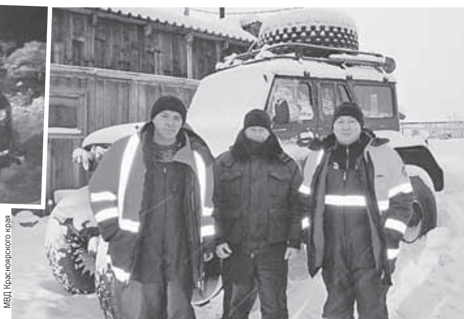
МВД Красноярского края