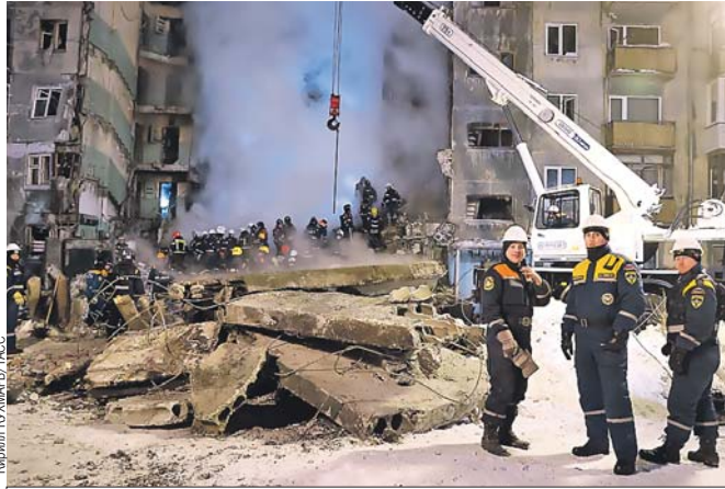
Спасатели на месте ЧП: в результате взрыва обрушились два подъезда, погибли 14 человек.

И вот появилась версия о возможных причинах взрыва: по делу проходят сотрудники неизвестной фирмы, которых принимали за официальных представителей Облгаза.