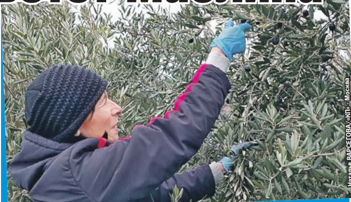
Наталья ВАРСЕГОВА/КП - Москва

А вот роща в Форосе - совсем юная. Участок был заложен в 2008 году учеными Крымского агротехнологического университета (сейчас это Крымский федеральный университет им. Вернадского). Сейчас здесь уже