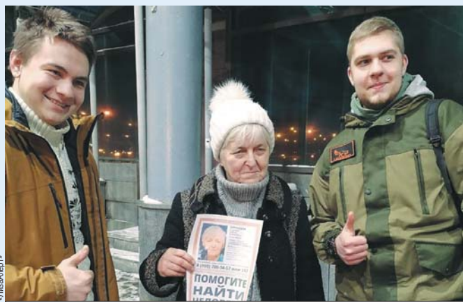
Пенсионерку из Казани нашли на вокзале в Самаре.