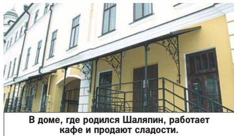
В доме, где родился Шаляпин, работает кафе и продают сладости.

Федор Шаляпин появился на свет довольно болезненным, вдобавок мальчик родился зимой. Побоявшись того, что младенец может умереть некрещеным, родители решили срочно отправиться к священнику в Богоявленский собор, который располагается в нескольких минутах ходьбы от Дома купца Лисицина - на