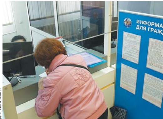
Миграционные потоки в ПФО сегодня меняются по разным причинам.

Самарская область на фоне соседей по Приволжью оказалась самым сбалансированным регионом, где количество прибывших и ушедших наиболее близко к нулевой отметке. В абсолютном большинстве других регионов наблюдался серьезный отток населения. Наименее популярной оказалась Саратовская область - там «отрицательное сальдо» составило более 5,5 тысяч человек.