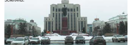
Бывшая Театральная площадь теперь называется площадью Свободы.

Одним из значимых мест для Шаляпина на Театральной площади, несомненно, являлся зал Дворянского собрания (нынешняя Казанская Ратуша). Именно здесь в 1909 году в последний раз в родном городе выступал перед земляками Федор Шаляпин. К началу концерта у входа в здание собралось множество казанцев, было не протолкнуться. В самом зале собралось такое большое количество зрителей, что некоторые даже садились прямо на сцену возле певца. Его выступление прошло с большим успехом и закончилось далеко за полночь. Публика долго не хотела отпускать прославленного земляка.