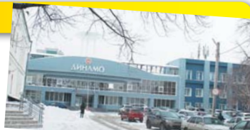
На месте Панаевского театра теперь стоит стадион.

В продолжение нашей прогулки заглянем в бывшую