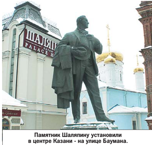
Памятник Шаляпину установили в центре Казани - на улице Баумана.

Сам Дом Лисицина долгое время стоял в плачевном состоянии, без крыши. Нынешний хозяин и вовсе намеревался его снести, однако ему не разрешили этого сделать, так как здание считается памятником культурного наследия. В настоящий момент его отреставрировали, однако детального исторического восстановления не произошло. Непосредственно в сам день рождения певца в 2023 году здесь установили мемориальную табличку, чтобы, таким образом, увековечить память певца.