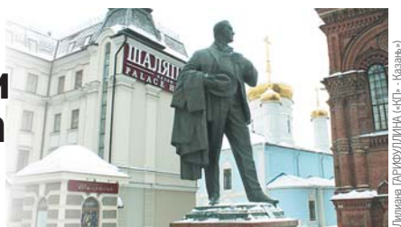
Дмитрия ГАРИФУЛЛИНА (СПТ - Казань)