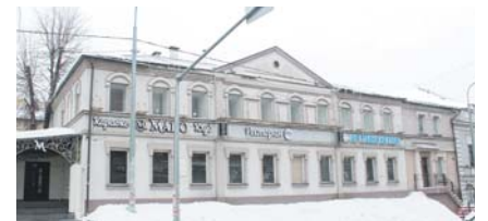
В это доме Шаляпин в детстве обучался сапожному ремеслу.