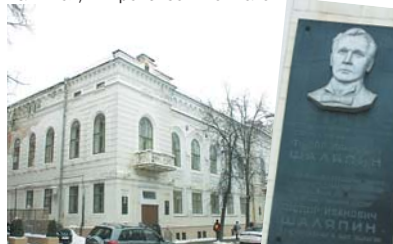
Бывшая Казанская уездная земская управа, в которой работал Шаляпин.

Казанскую уездную земскую управу. В 1886 году Федор поступает сюда на службу в качестве переписчика бумаг и получает жалование в размере 10 рублей. На службу ходил вместе с отцом и был горд этому. Спустя четыре года Федор Шаляпин увольняется из управы, так как ему было трудно совмещать работу и выступления в театре. В то время он уже работал статистом. Сейчас на месте управы располагается Казанский музыкальный колледж имени Ильи Аухадеева, а рабочее место Шаляпина превратилось в одну из учебных аудиторий образовательного учреждения.