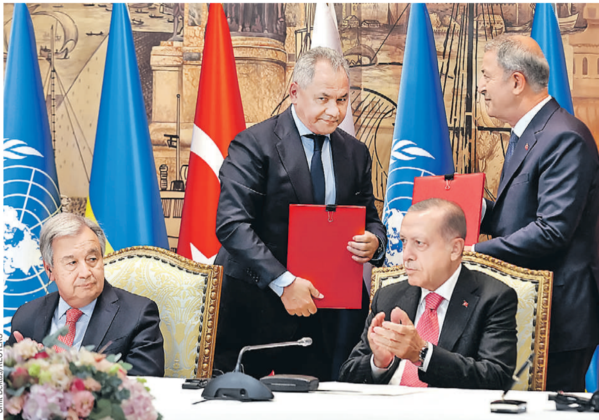
Генсек ООН Антониу Гутерриш, министр обороны РФ Сергей Шойгу, президент Турции Реджеп Эрдоган и глава Минобороны Турции Хулуси Акар (слева направо) на подписании соглашения о вывозе зерна.