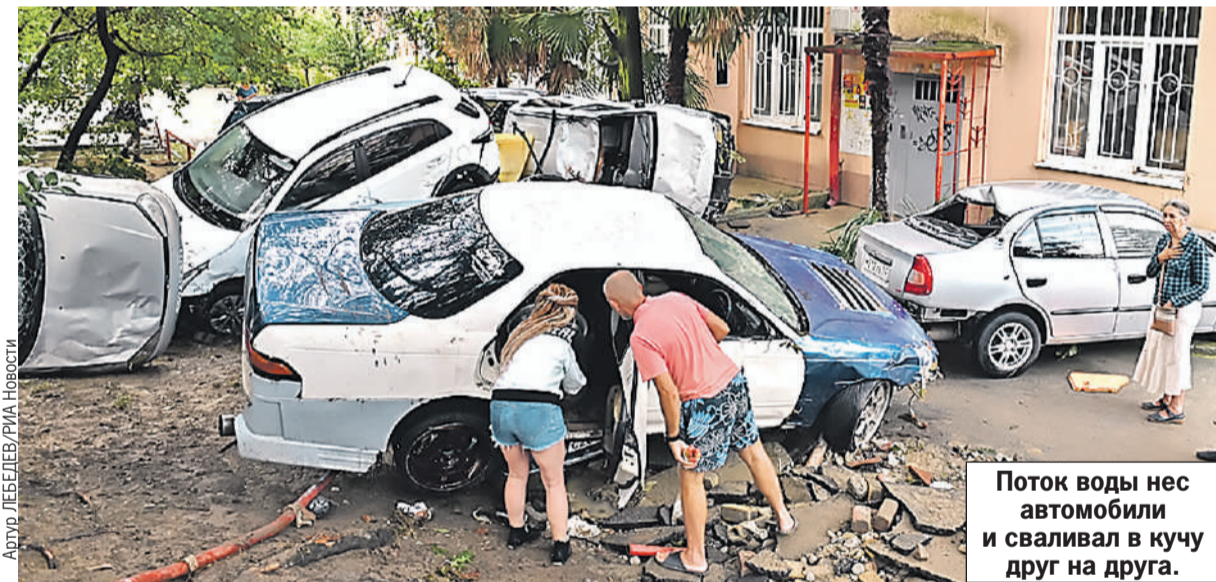
Артур ЛЕБЕДЕВ/РИА Новости