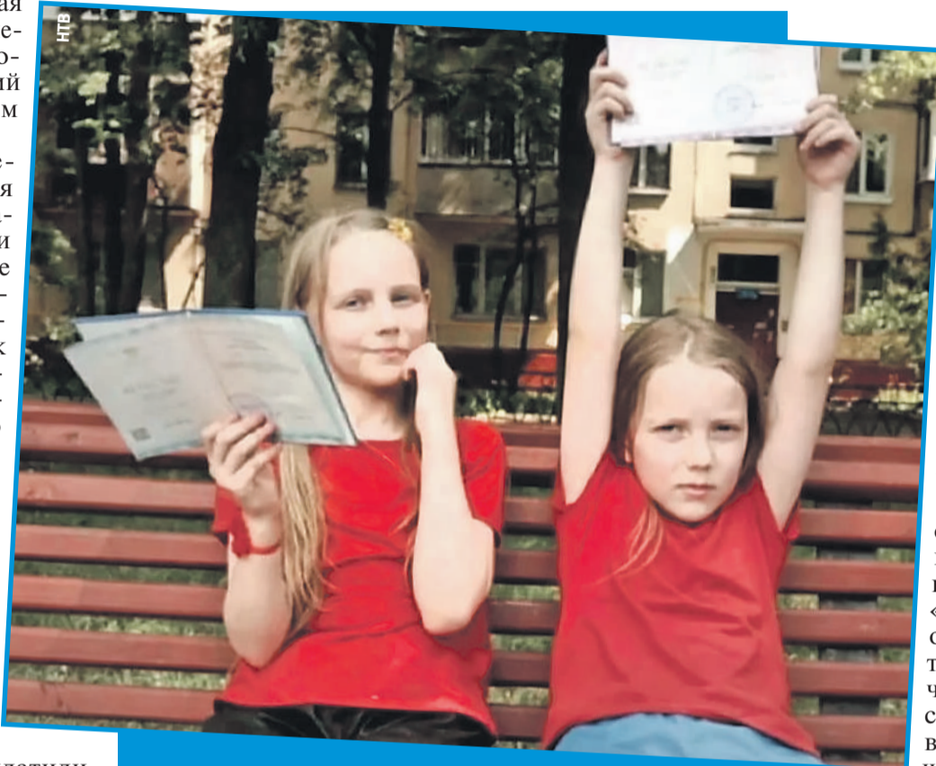
Сестра (слева) и брат очень похожи и лицом, и судьбой. И одинаково не улыбкивы - не оттого ли, что лишены детства?

как оказалось, уже пробовала поступить в «Синергию» в прошлом году, но у нее даже не приняли документы.