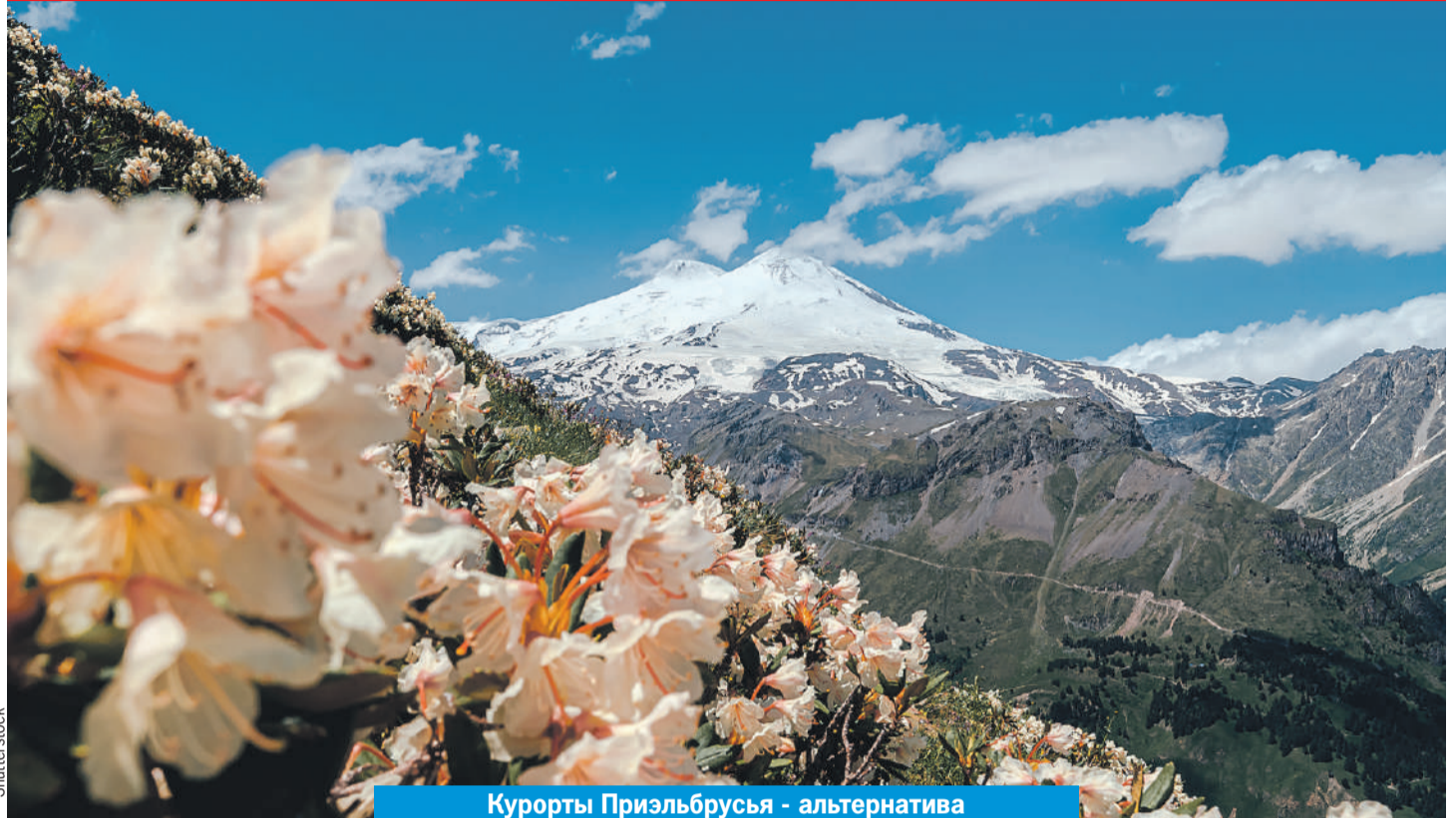
Курорты Приэльбрусья - альтернатива отдыху на море.