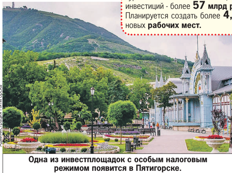
Одна из инвестплощадок с особым налоговым режимом появится в Пятигорске.

- Сегодняшняя ситуация в российской туристской отрасли - это наш «момент истины», и им надо грамотно воспользоваться, - сказал губернатор Ставрополья Владимир Владимиров и поставил задачу превзойти допандемийный уровень турпотока (в 2019-м край принял более 1,6 млн отдыхающих), до 2030 года увеличив его до 5 млн человек в год.