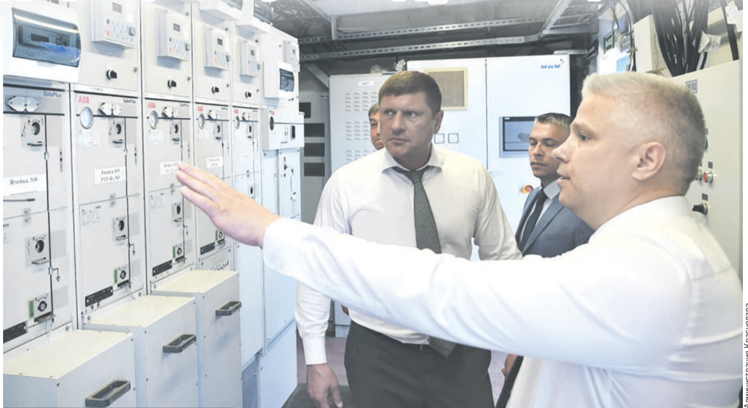
Недавно глава крайцентра Андрей Алексеенко побывал на одном из ресурсных предприятий, знакомом для экономики города.

Потребительский рынок Краснодара тоже растет: обороты розничной торговли выросли на 0,6 процента, объем платных услуг населению - на 1,2 процента, однако незначительно снизились обороты предприятий общественного питания. Как подчеркивает Василий Литвинов, невысокие темпы роста показателей в этой сфере экономики связаны с закрытием ряда магазинов иностранных