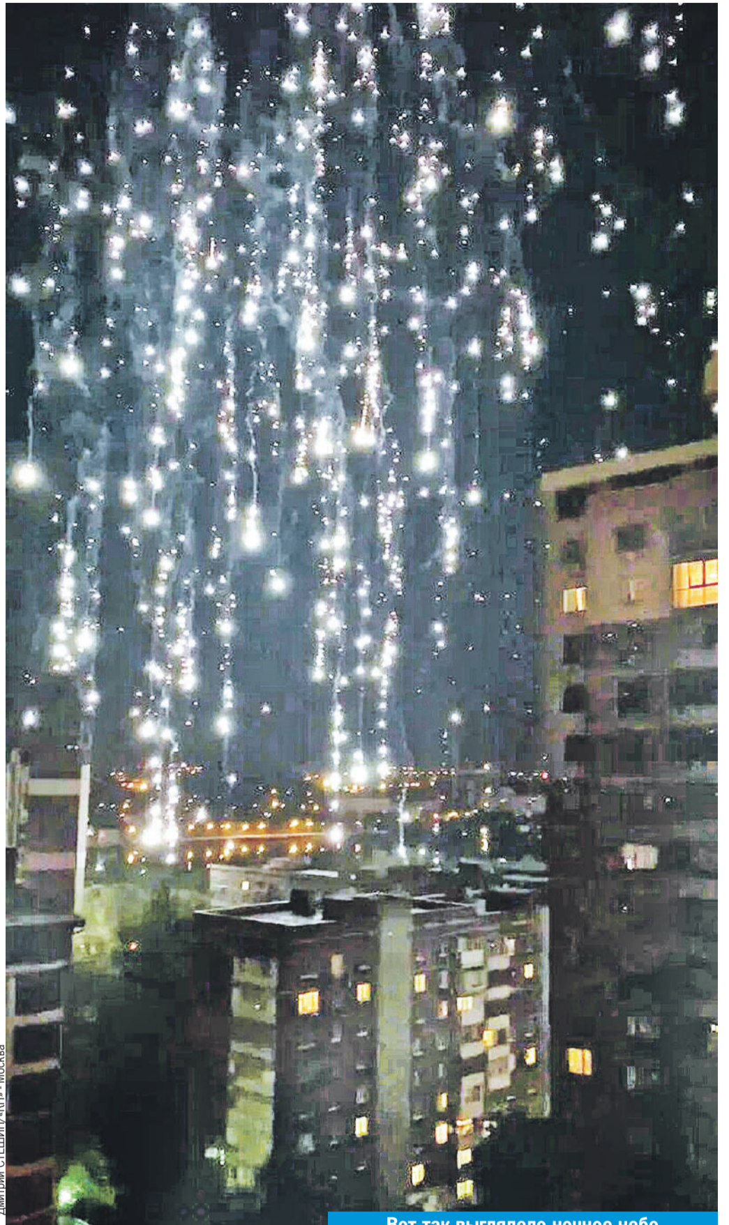
Дмитрий СТЕПИН/«КП» - Москва

Спустя два часа почти заснул, но тут - еще один взрыв в небе. Распахнул окно, но вместо магниевого салюта услышал странный звон - с неба сыпались куски металла. Следом за «зажигалками» прилетело что-то еще. Предполагали, что зенитчики не успеют перезарядиться. А они успели! Возможно, это была «Точка-У» - и ПВО города ее перехватила. Металлические останки падали с неба больше минуты. Похоже, «Точку» или ракету «Смерча» или «Урагана» ликвидировали на большой высо-