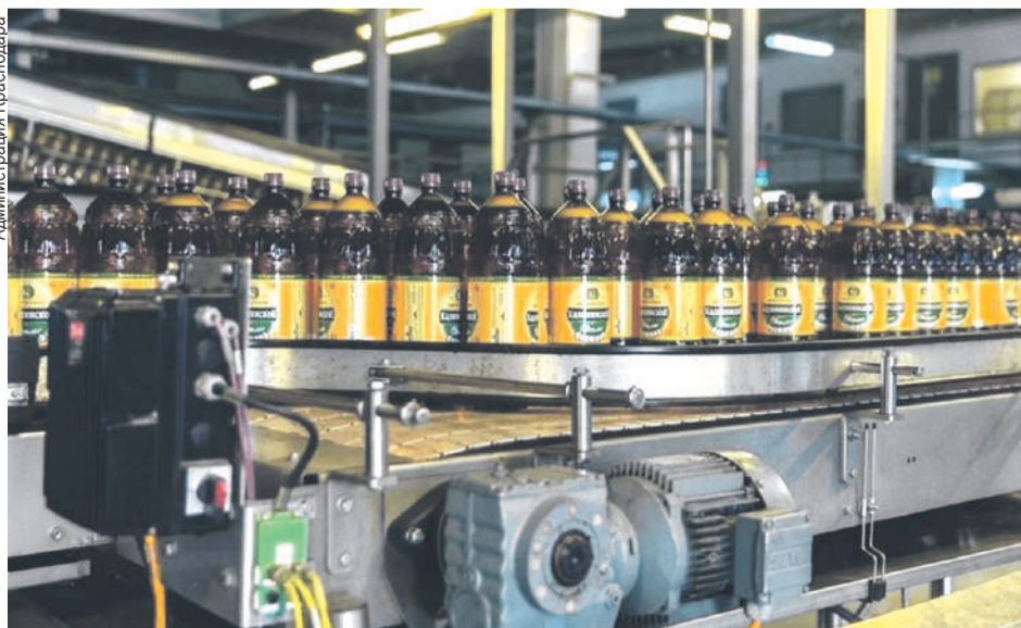
В столице Кубани увеличивается производство в том числе безалкогольных напитков.

Хотя транспортная отрасль экономики Краснодара за первые