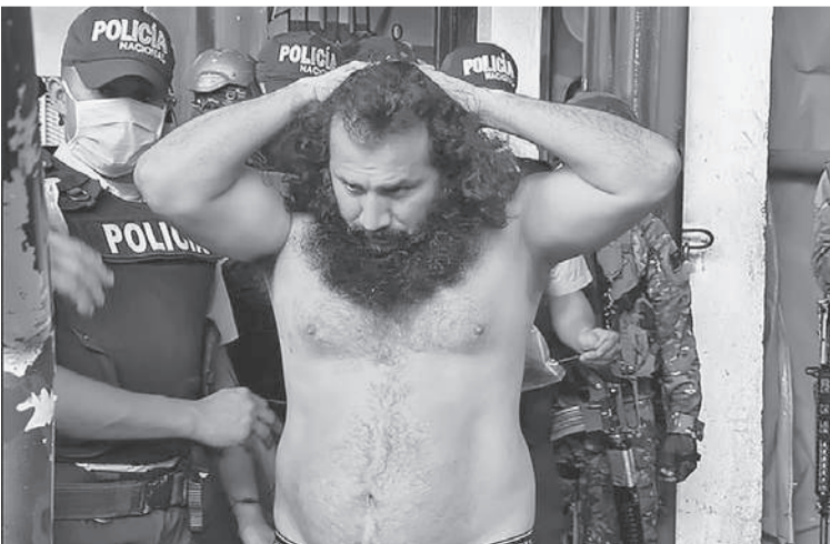
Вид зверский: Фито, лидер картеля «Лос Чонерос».