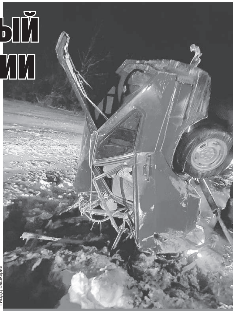
Все, что осталось от «девятки», влетевшей под грузовик.

Очевидцы говорят, что ехал по трассе он неуверенно. Учитывая сложность са-