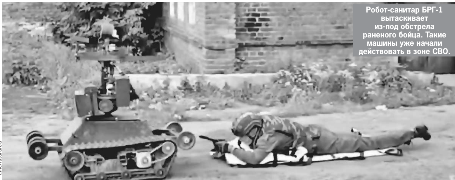
Робот-санитар БРГ-1 вытаскивает из-под обстрела раненого бойца. Такие машины уже начали действовать в зоне СВО.

рядок меньше, чем было в Первую и Вторую мировые войны, - делает вывод известный военный блогер Юрий Подоляка . - Это неизбежно. Поэтому уже отмечаются случаи, когда дроны сбивают друг друга. Но понятно, что они все равно дистанционно управляются человеком.