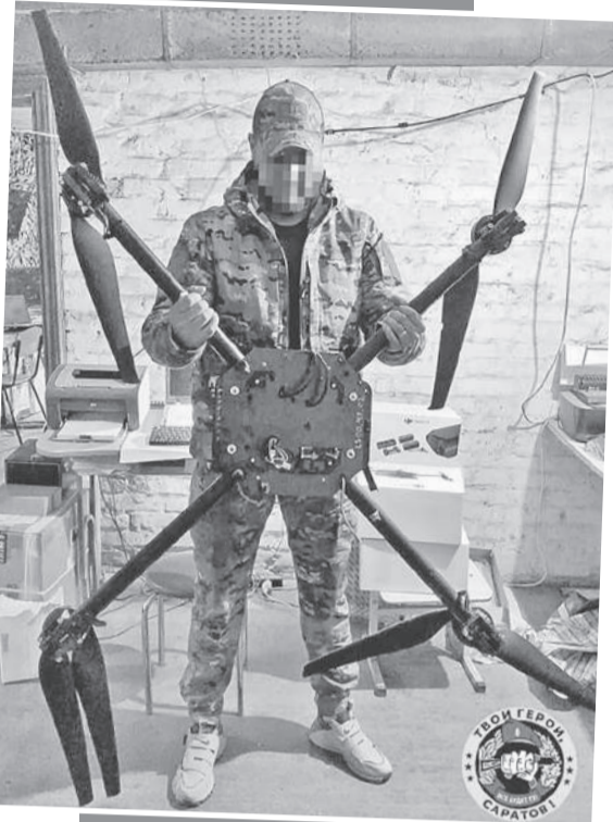
А это трофей! Приземленный и обезвреженный нашими бойцами украинский дрон «Баба-яга».