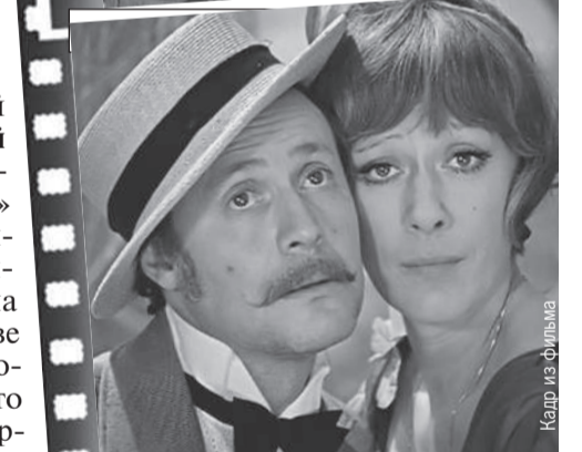
Юрий Соломин в «Дерсу Узала» (1975, с Максимом Мунзуком) и в «Обыкновенном чуде» (1978, с Екатериной Васильевой).

С 80-х годов многое ставил и сам, а в 1988-м стал худруком Малого театра.