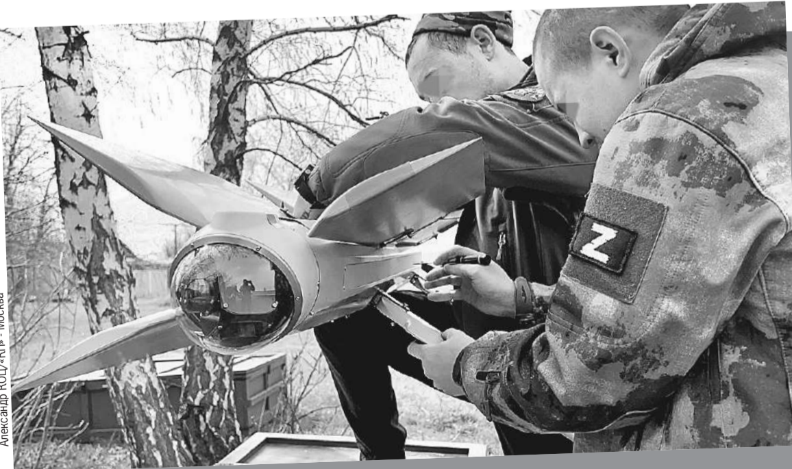
Настоящий хит СВО - наш барражирующий боеприпас «Ланцет». Украинские радары принимают его за птицу за счет крыльев, расположенных буквой Х.

Еще пример - робот «Маркер», который разработали для охраны. Искусственный интеллект позволяет ему вести патрулирование по сложным маршрутам. Робот отслеживает любое движение