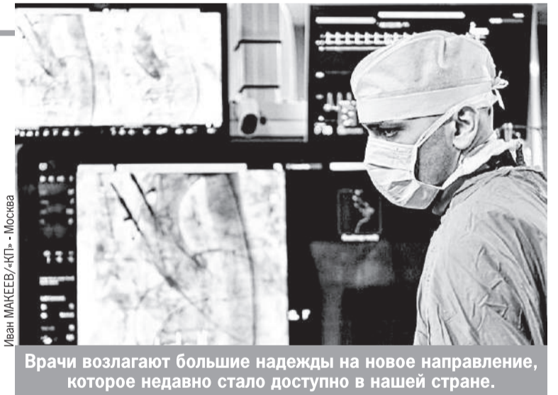
Иван МАКЕЕВ/«КП» - Москва

- Были разработаны специальные микросферы, которые облучаются в реакторе и несут на себе заряд, - рассказывает Константин Викторович. - Первая операция с отечественными микросфе-