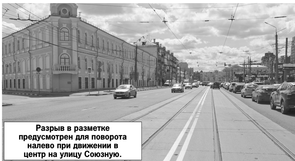
Разрыв в разметке предусмотрен для поворота налево при движении в центр на улицу Союзную.