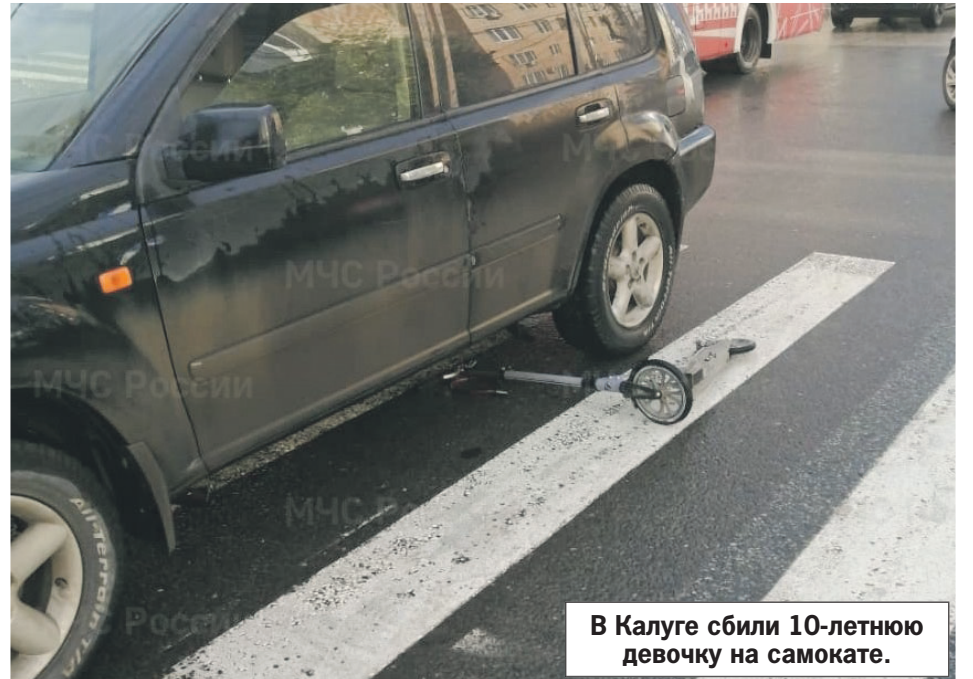
В Калуге сбили 10-летнюю девочку на самокате.

В Калужской области задержан 51-летний мужчина из Мурманска, приехавший 26 мая в Жиздру. Как сообщает региональное управление Следственного комитета, он до смерти избил своего отца, к которому заглянул в гости.