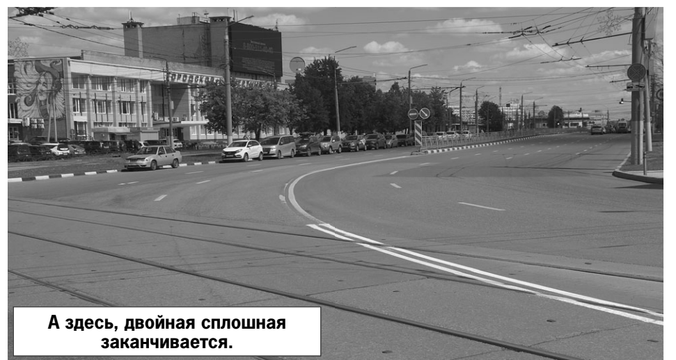
А здесь, двойная сплошная заканчивается.