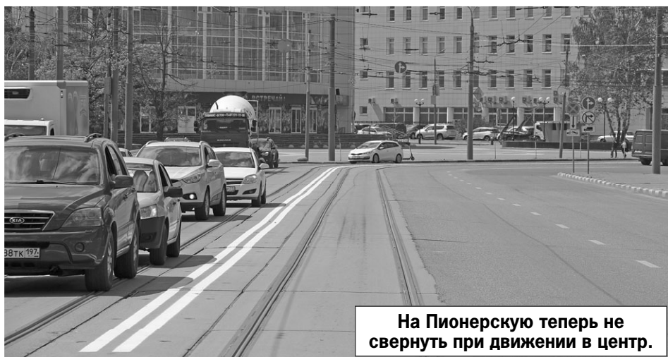
На Пионерскую теперь не свернуть при движении в центр.