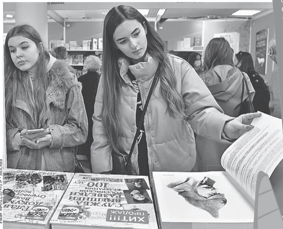
Иван МАКЕЕВ / «КП» - Москва

По анализу редакционной группы конкурса замечено, что конкурсанты почти не пишут о любви, приключениях и романтике, о чем во все времена мечтала и грезила юность. Зато их привлекают вопросы психологии, поиска себя, многие авторы уходят или в мрачную антиутопию, или в мир фантазий. Также приходят работы на темы патриотизма, созидания, на реальные триггеры в обществе - темы военных конфликтов и пандемий.