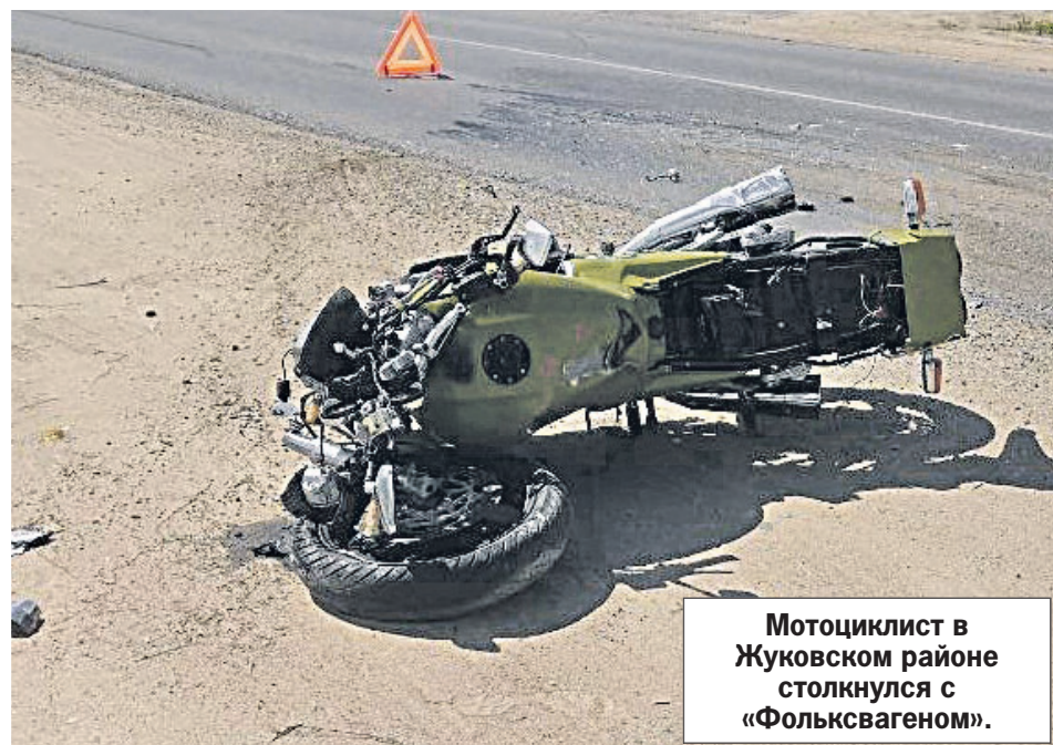
Мотоциклист в Жуковском районе столкнулся с «Фольксвагеном».

Предполагаемому виновнику грозит до восьми лет лишения свободы.