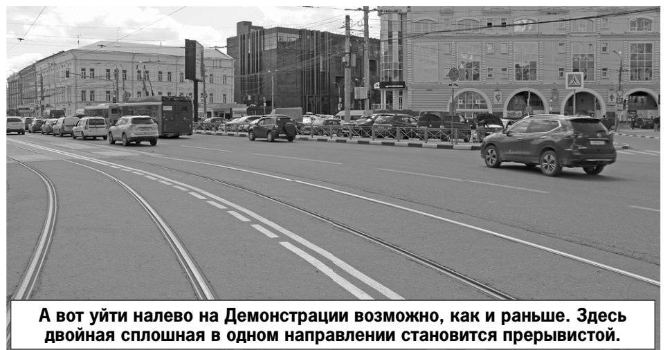
А вот уйти налево на Демонстрации возможно, как и раньше. Здесь двойная сплошная в одном направлении становится прерывистой.