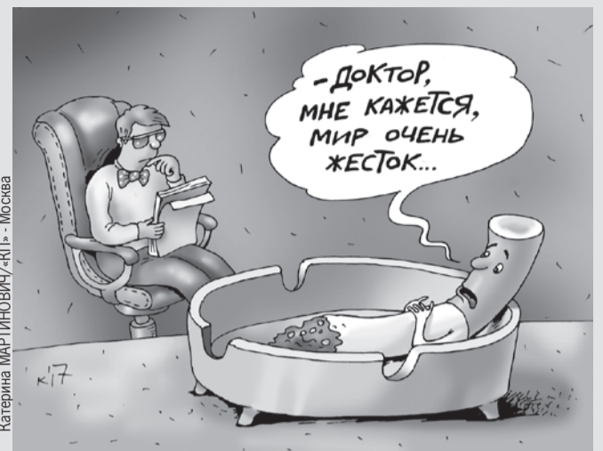
Катерина МАТИНОВИЧ/«КП» - Москва

31 июля - Всемирный день без курения. «Комсомолка» спросила: