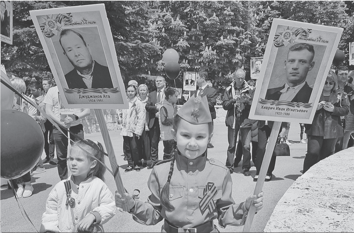
Несмотря ни на что, в Анкаре в этом году прошел «Бессмертный полк».

гий. - Они трудяги. Видишь бледного чудака, бредущего с пляжа, - он! Под зонтом программировал. Вот кого много - так это праздных балбесов. Деток от армии прячут. Напокупали в свое время недвижимости, теперь вспомнили, приехали. Сынкам по 17 - 18 лет, а с ними бабушка или тетюшка для контроля. Вот и живут на квартирах, домах, виллах. Пережидают. А прав батюшка.