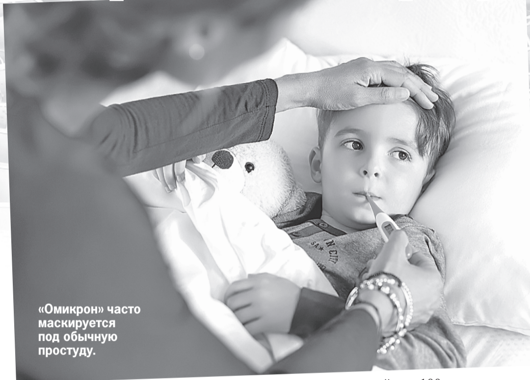
«Омикрон» часто маскируется под обычную простуду.