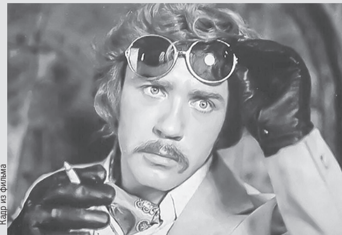
Артист сыграл более 200 ролей в кино (кадр из комедии «Иван Васильевич меняет профессию»).

Не стало Леонида Куравлева (вспоминаем актера - стр. 15). «Комсомолка» спросила: