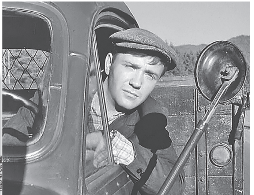
Роль шофера Паши Колокольникова актер называл любимой и лучшей («Живет такой парень», 1964, режиссер - Василий Шукшин).