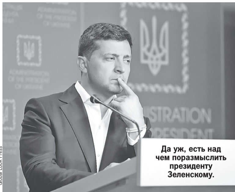
Да уж, есть над чем поразмыслить президенту Зеленскому.

На месте ЦРУ я бы так уж сильно не рассчитывал на необандеровцев. Нагадить они, конечно, могут. Но переломить ситуацию, взять власть - нет. Разумеется, если остальные граждане Украины не захотят еще раз наступить на бандеровские грабли русофобской самостоятельности. Но что такое, неуловимо разлитое в воздухе подсказывает, что второй серии у этой бандеровской истории не будет.