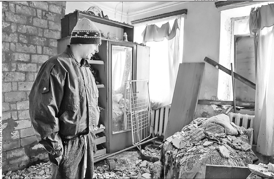
На Украине сейчас из каждого утюга вещают о грядущем «российском вторжении», а ВСУ между тем продолжают методично обстреливать города и поселки ДНР и ЛНР. Диалог с республиками Киев вести не желает. На фото: житель Донецка в своем доме на улице Дружбы, в крышу которого попал снаряд.

Сергей Лавров: - Президент отвечал на этот вопрос: если Зеленский хочет обсуждать нормализацию двусторонних отношений, страдающих от действий его режима, мы готовы - пожалуйста, пусть приезжает в Москву, в Сочи, в Петербург. Но если он хочет обсуждать Донбасс, идите, пожалуйста, в контактную группу, в которой должны напрямую рассматриваться все вопросы урегулирования между Киевом и Донецком, Киевом и Луганском. А когда он заявляет, что не будет с ними разговаривать, это плохо для внутриукраинского кризиса.