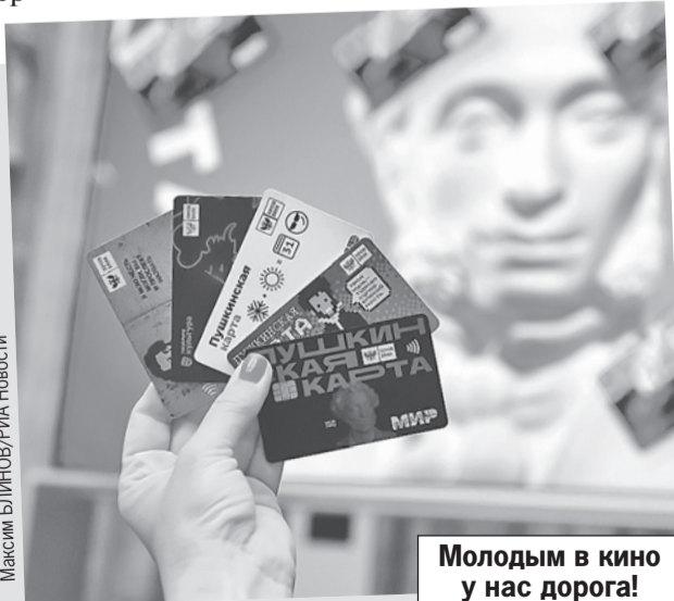
Молодым в кино у нас дорога!

С 1 февраля Пушкинской картой для молодежи можно оплачивать билеты в кино. Правда, не на любые фильмы. В списке - те, что созданы при поддержке Минкульта, Фонда кино и региональных органов власти, а также из золотой коллекции отечественного кинематографа. Что именно посмотреть за госсчет, можно выбрать в приложении «Госслуги Культура» или на сайте культура.рф.