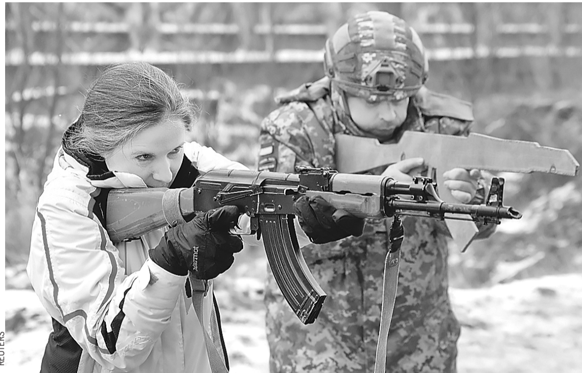
Под Киевом мужики-инструкторы с фанерными макетами учат женщин стрелять из настоящего автомата. Стремятся научиться немногие.

- Пошли отсюда, таких идиотов полный Крещатик, - топчет меня мой приятель.