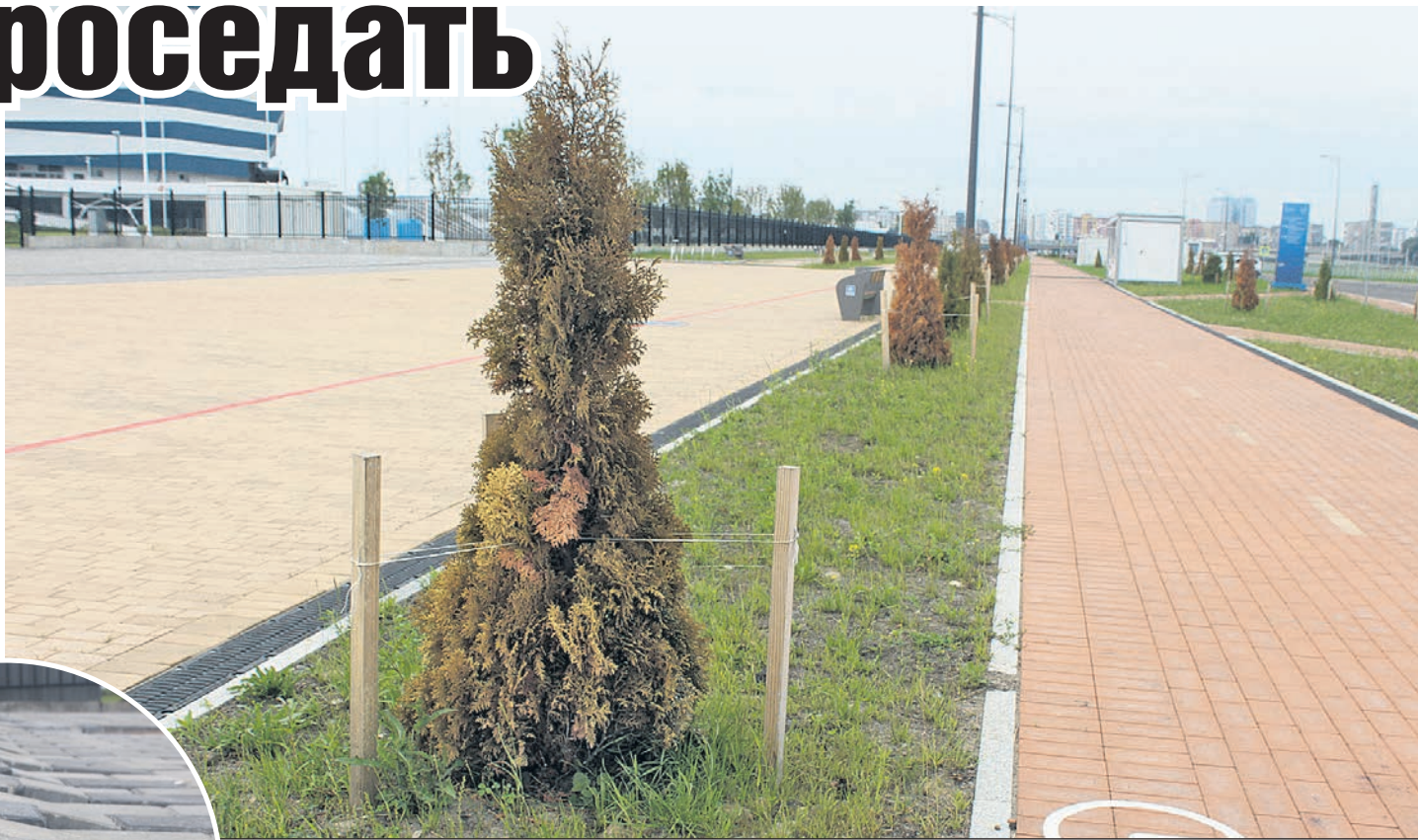
Большая часть туй, высаженных рядом со стадионом, засохла еще во время проведения чемпионата.

Первое, что бросается в глаза, - просадки грунта. В районе второго