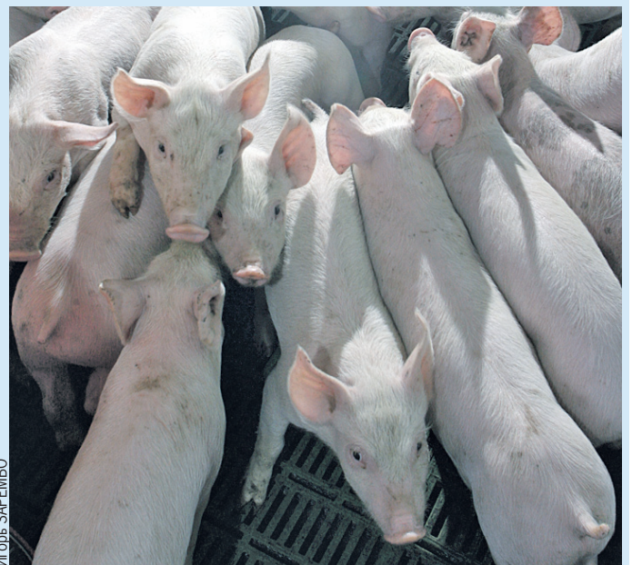
Вирус отличается очень высокой устойчивостью.

Напомним, на прошлой неделе стало известно о том, что вирус африканской чумы свиней нашли в компании «Правдинское свинопользование» - одном из крупнейших комплексов региона. Там погибли 11 тысяч животных. Всего вирус АЧС на сегодняшний день обнаружили в семи округах Калининградской области. По данным областного минсельхоза, африканская чума свиней