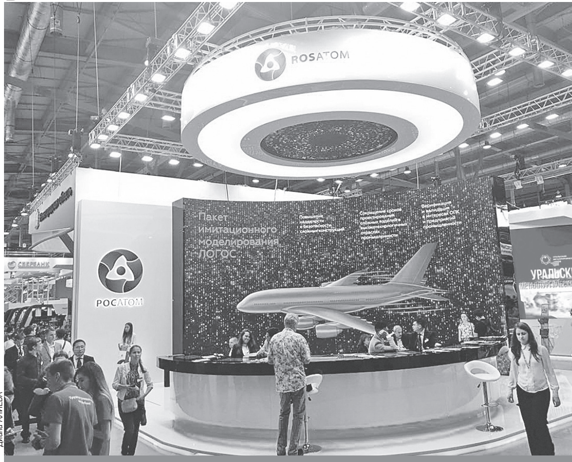
«Росатом» представил свои цифровые продукты и продукты новых направлений бизнеса.

ная для работы с продукцией и документами, имеющими ограничения доступа по типу информации. Система Multi-D - это комплексная цифровая платформа поддержки объектов капитального строительства на полном жизненном цикле, начиная от проектирования и заканчивая сдачей в эксплуатацию.