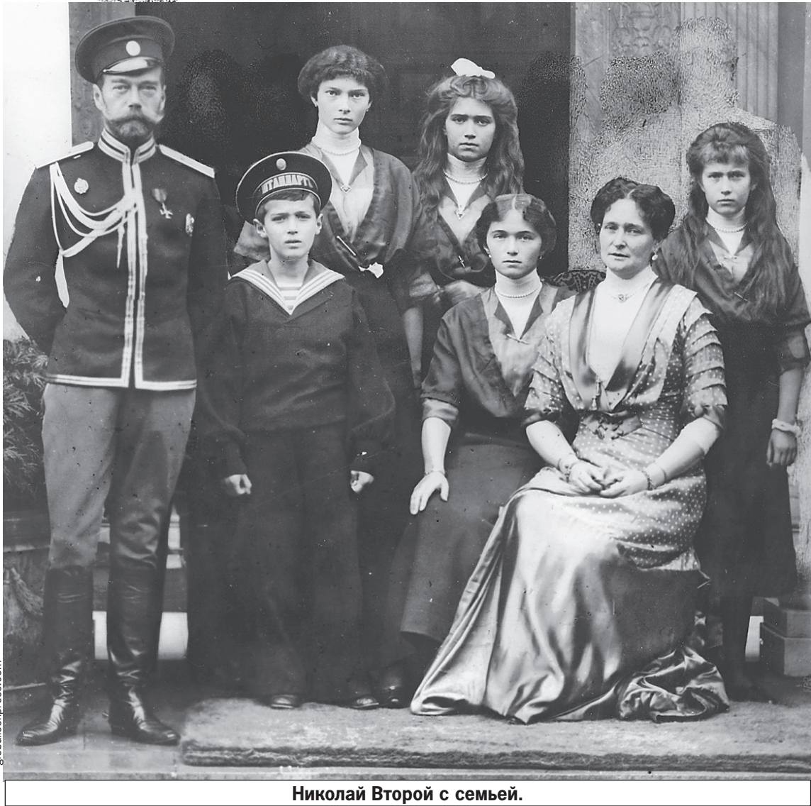
Николай Второй с семьей.

тейшество 20 минут в нашем присутствии читал это и сказал: решайте вопрос места и времени захоронения. Но через пару недель после нашей встречи с Патриархом Алексием Вторым Синод все же останки не признал. И Святейший, как человек компромиссный, это решение принял.