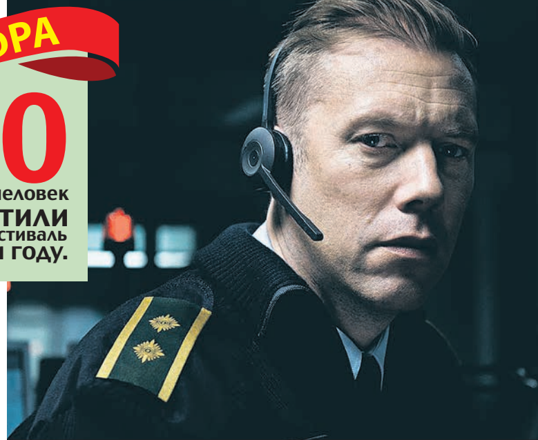
Фильм-победитель «Виновный» рассказывает о диспетчере службы спасения, который однажды принимает звонок от похищенной женщины.

ЦИФРА 20 тысяч человек посетили кинофестиваль в этом году.