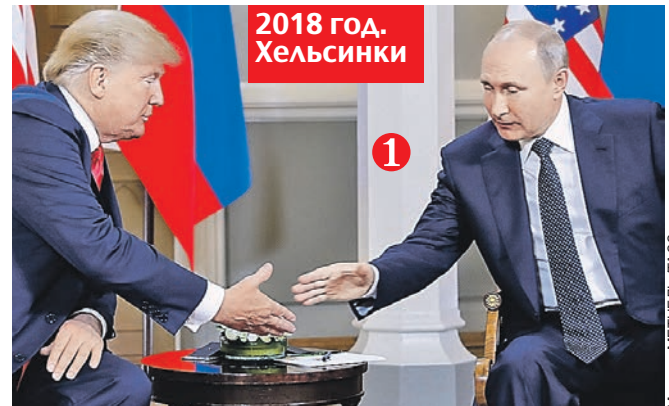
2018 год. Хельсинки

- Судя по всему, они нашли общий язык, - объяснил нам эксперт. - При этом американец все равно общается слегка фамильярно: мол, обсудим по-свойски, но и я свою выгоду упускать не намерен.