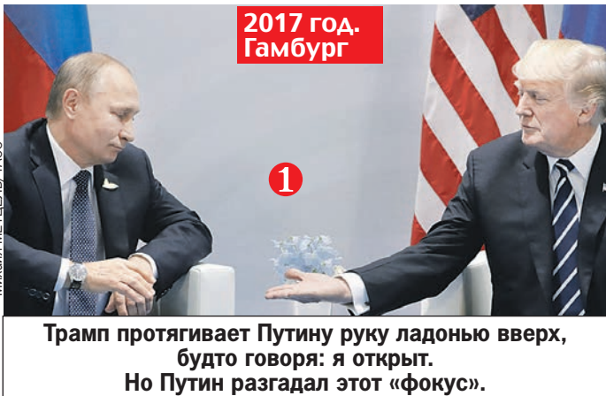
2017 год. Гамбург