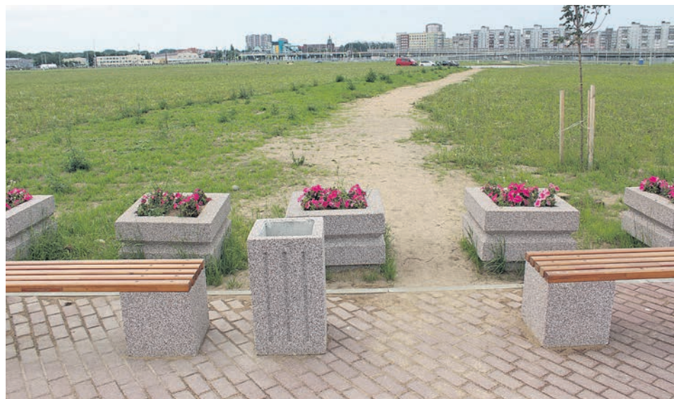
Кое-где на траве можно заметить вот такие народные тропы - здесь точно успели пройти сотни раз.

И все же можно сказать, что Калининград перенес чемпионат с наименьшими потерями и проведенное к мундиалу благоустройство серьезно не пострадало. Ожидавшийся наплыв мародеров не состоялся, а ошибки, допущенные проектировщиками, хочется надеяться, еще можно исправить.