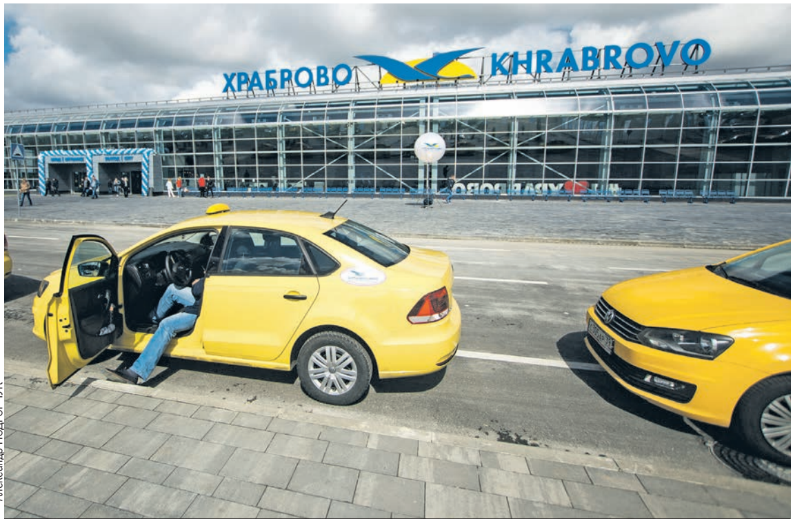
Как ни удивительно, но на стоянке вечером не было даже машин такси.

Во время чемпионата из аэропорта «Храброво», напомним, круглосуточно увозили и привозили иностранных болельщиков - автобусы ходили каждые 20 минут. Но