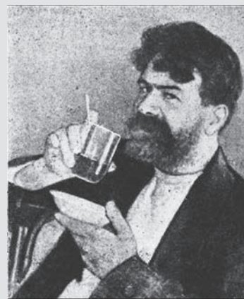
Яков Юровский был комендантом дома, где держали царскую семью. И стал одним из главных ее палачей.