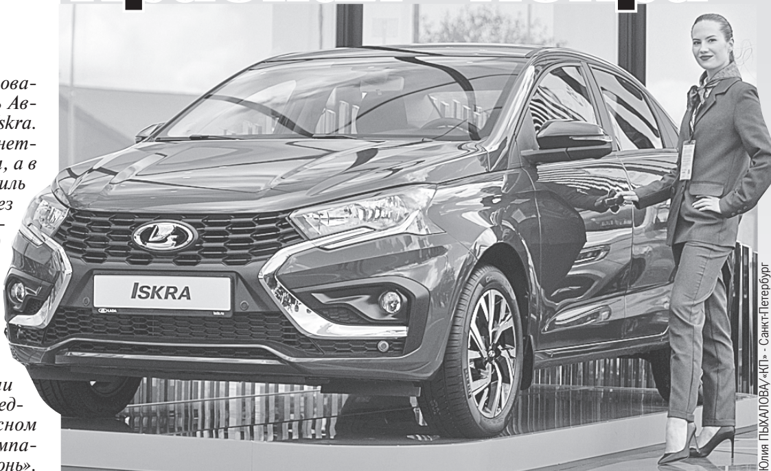
Новая модель «Лады» будет одной из самых доступных машин на российском рынке.