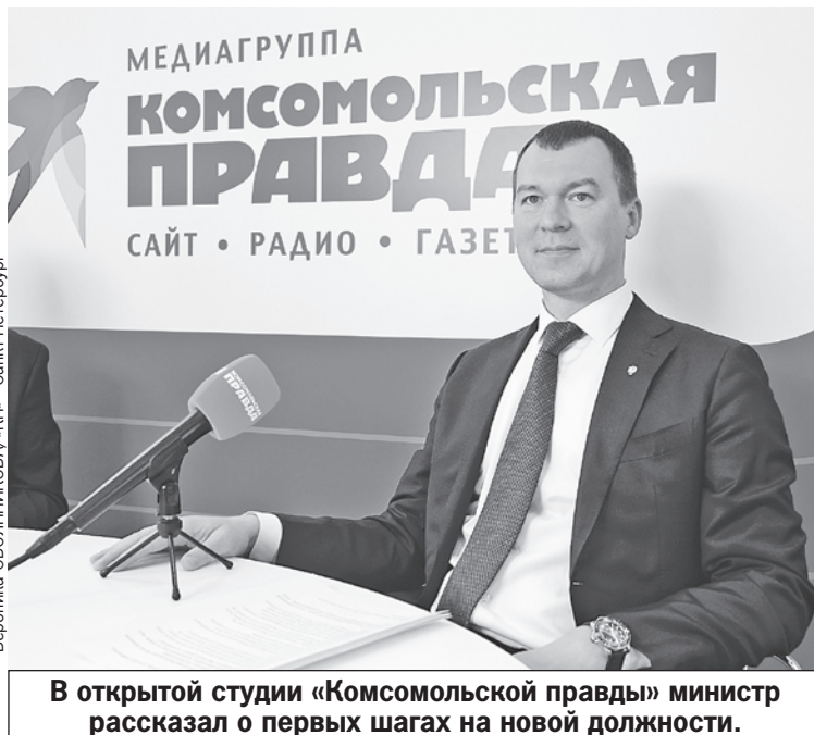
В открытой студии «Комсомольской правды» министр рассказал о первых шагах на новой должности.

спортивной общественности. Закон о спорте требует нового взгляда и подхода. Тоже эту работу мы начинаем. В свое время, когда я возглавлял комитет, мы закон правили десятки раз. На сегодняшний день, по моему ощущению, он требует принятия новой редакции. Не спеша, через рабочую группу по законодательству Совета по спорту. Это большой стратегический орган, его возглавляет президент. На эту тему придется поработать. Президент уже дал поручение - новая комплексная государственная программа.