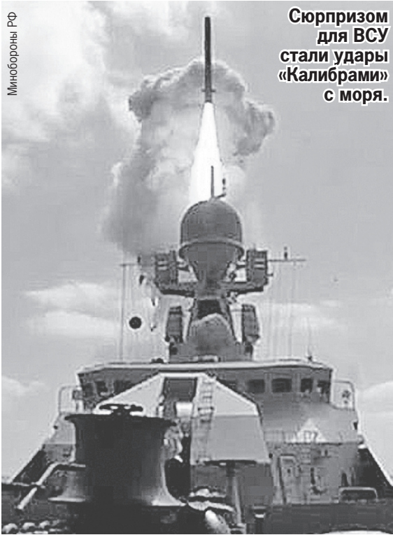
Сюрпризом для ВСУ стали удары «Калибрами» с моря.

Еще один «хит СВО» - дальнобойные крылатые ракеты «Х-22», их разрабатывали при СССР как противокорабельные. Но украинский флот закончился, потому ракеты применяются по наземным целям, несколько раз в неделю. «Х-22» выдает 3600 км/ч и в принципе не перехватывается ПВО, которые сегодня есть у противника.