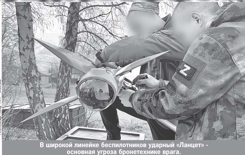
В широкой линейке беспилотников ударный «Ланцет» - основная угроза бронетехнике врага.

Ударный беспилотник «Ланцет» впервые показали в 2019-м, через год приняли на вооружение, а в 2021-м применили по боевикам в сирийском Идлибе. Двигатель у «Ланцета» электрический, скорость до 300 км/ч. Но главное отличие от западных аналогов - нашим «Ланцетам» не нужна спутниковая навигация. «Ланцет» может маневрировать в воздухе до 30 минут, уклоняясь от ПВО. Выходя из зоны поражения и возвращаясь - важное отличие от ракет. Запускаются «Ланцеты» с переносной катапульты, могут даже с кузова грузовика. «Ланцет» работает