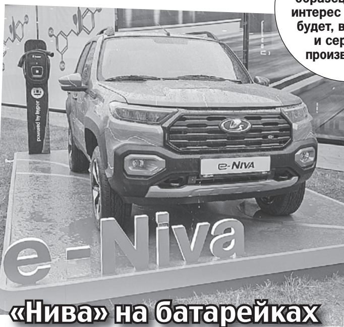
«ЭлектроНива» - пока опытный образец. Но если интерес к новинке будет, возможно и серийное производство.

- Я думаю, если загадывать на 2025 год, все, что они выпустят, они продадут. Спрос, на мой взгляд, будет превышать предложение. Китайские автомобили, понятно, лучше технически оснащены, но у них совсем другая цена, - заметил Максим Кадаков.