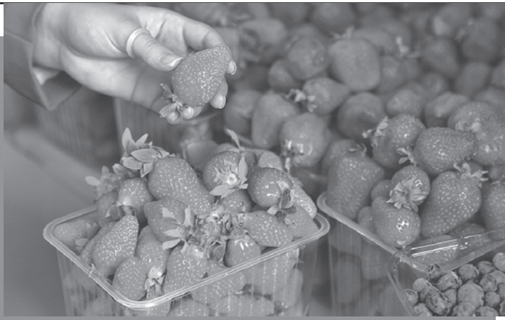
Оксана ЗУЙКО/«КП» - Москва