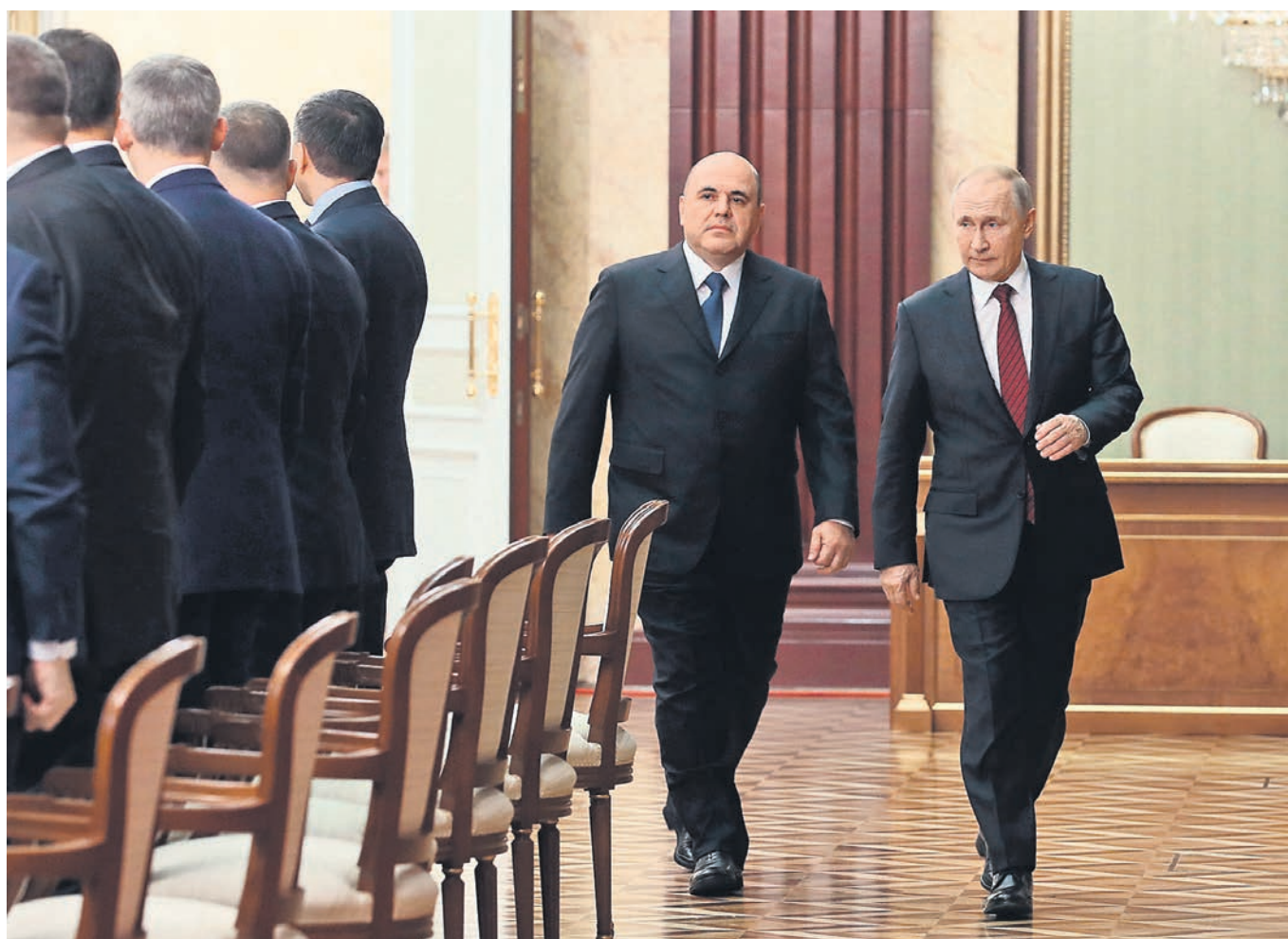
Отказ Владимира Путина и Михаила Мишустина от прежней системы сдержек и противовесов в кадровых вопросах Белого дома сделал новое правительство необычно однородным.