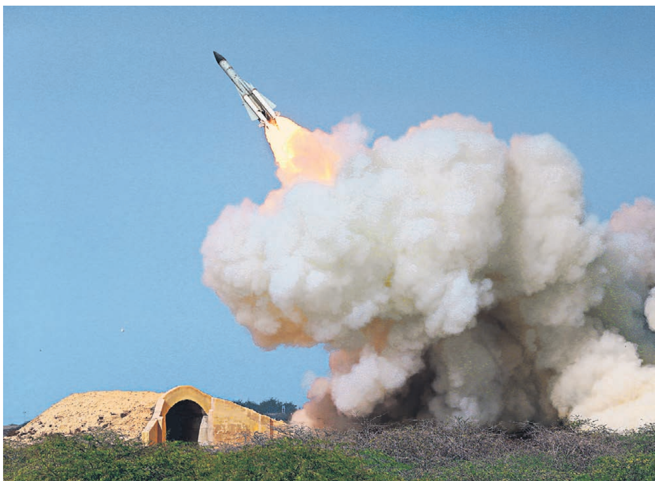
Ракета, выпущенная сирийским зенитным ракетным комплексом С-200 уже после того, как израильские истребители F-16 улетели на базу, сббили заходящий на посадку российский разведывательный самолет Ил-20

Цепью трагических случайных обстоятельств назвал вчера события, приведшие к гибели экипажа российского Ил-20 в небе над Сирией, президент РФ Владимир Путин. Ранее Минобороны РФ возложило ответственность за это на Израиль, поскольку сирийские ПВО сббили российский самолет, целясь в израильские истребители, которые совершали налет на военные объекты на территории Сирии. Израильские истребители, которые совершали налет на военные объекты на территории Сирии. Израильские истребители, которые совершали налет на военные объекты на территории Сирии. Израильские истребители, которые совершали налет на военные объекты на территории Сирии.