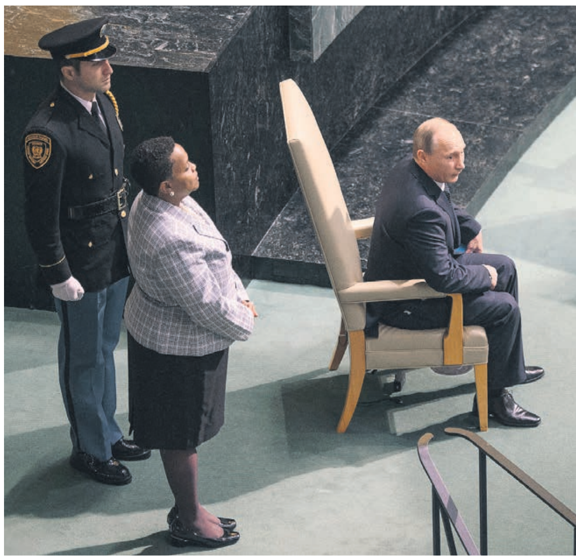
Владимир Путин перед речью в ООН был подвергнут сидению на стуле

Организаторы хулиганили и перед встречей Сергея Лаврова