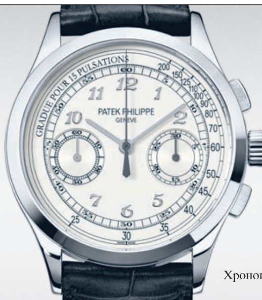
Хронограф мод. 5170G