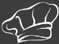
График работы 5/2. З/п от 50000 руб. м. «Семеновская», «Бульвар Рокоссовского»

8 (903) 722-0579, 8 (916) 120-6671, 8 (916) 585-3927, 8 (499) 369-1572. e-mail: mixeeva1974@mail.ru